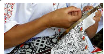
Rumänische Stickerei

Der Eintritt ist frei. Bitte anmelden unter stadtbibliothek@bruchsal.de .