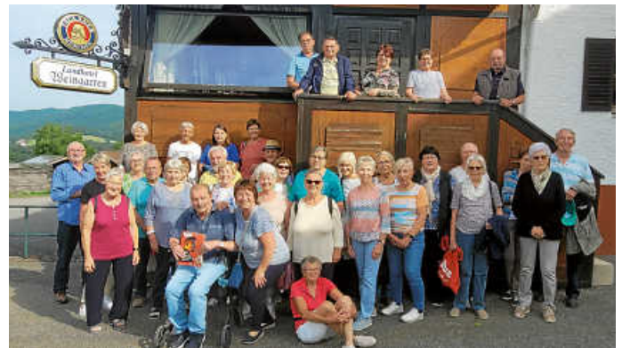
Abschied von schönen Tagen im LandHotel Weingarten