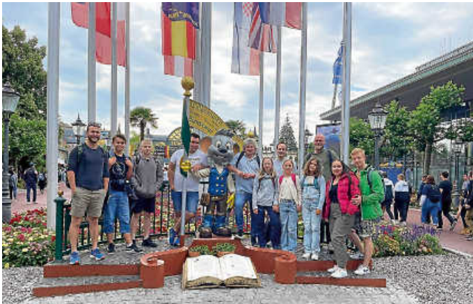
Vereinsausflug in den Europa-Park

Das JTB freut sich schon, die Tradition auch im nächsten Jahr fortzuführen.