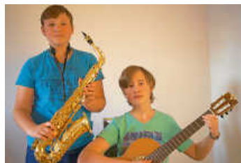
Große und kleine Meisterinnen und Meister ihres Fachs sind bei Klassik, Pop, et cetera zu erleben

Am Sonntag, 7. Juli ist es wieder so weit: Unser Traditionsformat „Klassik, Pop, et cetera“ präsentiert sich um 11 Uhr im Rimolini-Saal der Musik- und Kunstschule (MuKs) Bruchsal. Die bunte Familie der Zupfinstrumente, deren Protagonisten in allen stilistischen Bereichen der musikalischen Kultur tief verwurzelt, ja zum Teil stilprägend sind, wird wieder zahlreich vertreten sein.