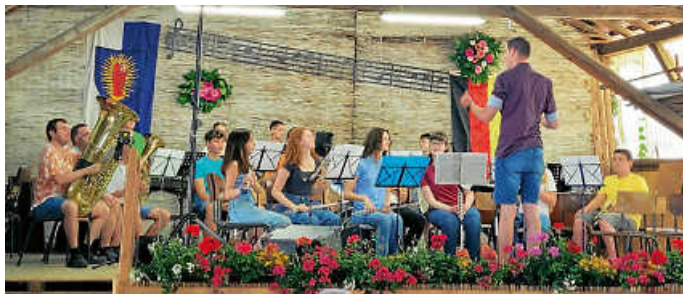
Grobacher Jungmusiker mit Schülerverstärkung

Am 23. und 24. Juni schallten wieder einmal Blasmusik und fröhliche Gespräche durch Obergrombach, in der Dreschhalle stieg das alljährliche Musikfest des Musikvereins Eintracht Obergrombach. Es war ein voller Erfolg. Das Wetter spielte hervorragend mit, Essen und Kuchen waren wie gewohnt sehr lecker, abwechslungsreich sorgten die verschiedenen Kapellen für gute Unterhaltung. Beim Public Viewing wurde gemeinsam der deutsche Gruppensieg jubelt, beim Seniorennachmittag der Stadt Bruchsal Kaffee und Kuchen genossen und dann klang der Abend musikalisch aus. Für einen großen Part der guten Unterhaltung sorgten erfolgreich am frühen Sonntagnachmittag Kinder und Jugendliche. Zunächst die Jugendkapelle aus Neudorf, daran schlossen sich aus Obergrombach Bläserklasse und Schülerkapelle sowie die Grobacher Jungmusiker an. Trotz verschiedener krankheitsbedingter Ausfälle nahmen jeweils ungewohnt große Ensembles auf der Bühne Platz. Bei den Jungmusikern war das Schlagwerk sogar fünffach besetzt. Es stand eben der Generationenwechsel bei diesen Kapellen an, sodass einige Musiker/-innen mehrfach auftraten. Rundum sehr gelungene Auftritte! Jetzt ist wieder alles aufgeräumt, die Erinnerung verblasst und schon steht Obergrombachs nächster Höhepunkt auf dem Programm: Vom 20. bis 22. Juli findet wieder das Burgfest statt. Vorbereitungen und Vorfreude laufen auch beim MVO schon auf Hochtouren.