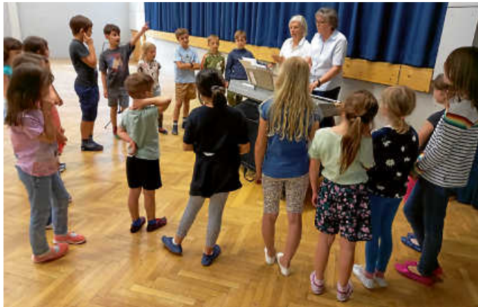
Bei der Probe