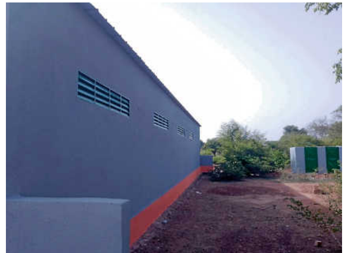
Die von Schülern frisch gestrichene Rückwand der Lehrwerkstatt (rechts hinten Toilettenhäuschen)

Auch unsere Lehrwerkstatt zur praktischen Ausbildung von Agrargeräte- und Solaranlagen-Mechanikern sowie das Agrar-Entwicklungsprojekt in Bantougo/Burkina Faso werden noch dieses Jahr fertig.