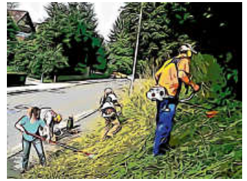
Böschungspflege 2024

BITTE zu beachten: Sollte der Termin verschoben werden müssen, zum Beispiel wetterbedingt, werden wir dies freitags auf unserer Webseite: www.freie-waehler-helmsheim.de und auf Facebook und Instagram bekannt geben.