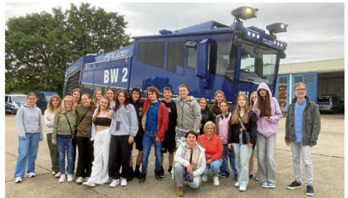
Besuch der Bereitschaftspolizei