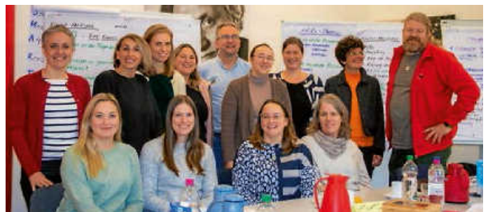
Das Team von Projekt ACT

Mit einer Kick-Off-Veranstaltung am 21. Juni ist das Projekt ACT offiziell gestartet. Das Projekt ACT richtet sich an alle Familien mit Kindern im gesamten Landkreis Karlsruhe, die von sozialer Ausgrenzung und Armut bedroht sind. Die Buchstaben stehen dabei für „Aktivierung, Coaching, Teilhabe“ und sind zugleich auch die Anfangsbuchstaben der Projektbeteiligten AWO, Caritas und Tageselternverein.