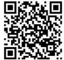
QR-Code zum Video

Falls Sie Interesse an weiteren Infos zur Bläserklasse und darüber hinaus haben, können Sie sich jederzeit an jugendleitung@musikverein-harmonie.de wenden. Unsere Jugendleiterinnen Linda & Lea stehen euch für alle Fragen zur Verfügung.