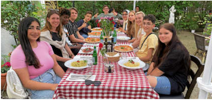
Letztes gemeinsames Abendessen