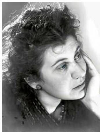
Etty Hillesum, Porträt 1940