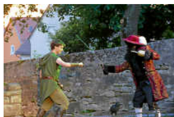
Peter Pan kämpft mit Kapitän Hook

Peter Pan fliegt an lauen Sommerabenden ins Atrium des Theater- und Kulturvereins Bundschuh ein, denn das diesjährige Theaterstück ist angelaufen. Wenn Sie genau hinhören, können Sie die Piraten grölen hören oder Tinkerbells Glöckchen schimmern sehen oder die Rauchzeichen von Tiger Lilly und ihrem Stamm schnuppern. Ein eindeutiges Zeichen für den Saisonauftakt sind die sichtbaren Umrissse von Peter Pan, Wendy und ihren Geschwistern, die im Vollmond erkennbar sind, wenn sie nach Nimmerland fliegen.