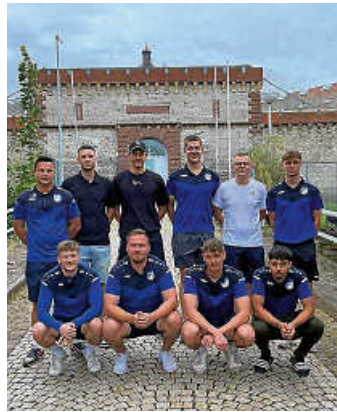
Mannschaft beim JVA-Turnier

Das dritte und vierte Spiel war gegen die beiden Mannschaften der JVA Bruchsal. Hier konnten wir zuerst gegen die Mannschaft JVA 2 einen 5:1-Erfolg feiern, um im Anschluss das Turnier mit einem furiosen 8:0-Sieg gegen die Mannschaft JVA 1 zu beenden.