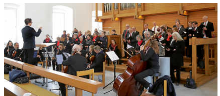
Der Chor der Hofkirche Bruchsal an Ostern 2024