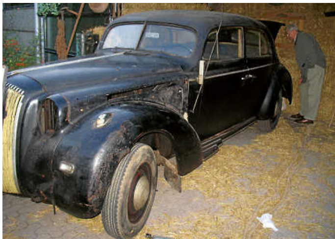
Opel Admiral AD38, Baujahr 1939 der Oldtimerfreunde Bruchsal

Während die 180 Rallye-Teams in zwei Tagen auf insgesamt 540 Kilometern die Zuverlässigkeit ihrer Oldtimer unter Beweis stellen, brauchen ihre Fahrer und Beifahrer aus ganz Deutschland und den Nachbarländern Geschick und Findigkeit. Sie müssen 18 Wertungsprüfungen möglichst exakt bestehen.