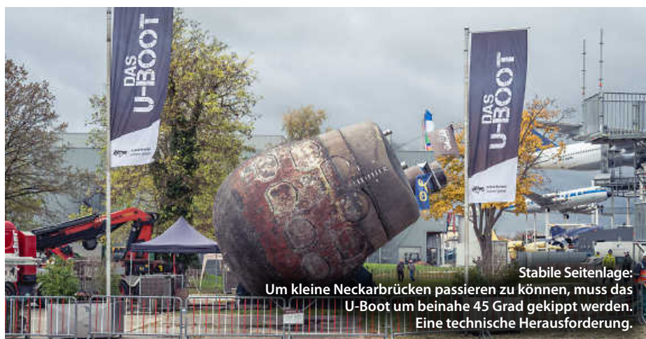
Stabile Seitenlage: Um kleine Neckarbrücken passieren zu können, muss das U-Boot um beinahe 45 Grad gekippt werden. Eine technische Herausforderung.

Insgesamt investierte der Verein Auto-Technik-Museum rund 2 Millionen Euro in das Projekt. Doch das, so Einkörn, habe sich gelohnt. (ral)