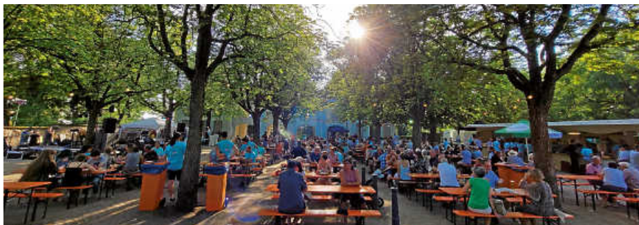
Brusler Sommerdorscht 2023