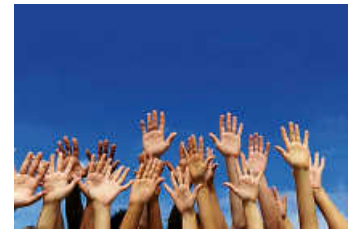
Hände, Label von Café Paul

Im Festgottesdienst zum Patrozinium der Bruchsaler Stadtkirche am Sonntag, 7. Juli, 10.30 Uhr, erklingt die „Windhaager Messe“ in C-Dur