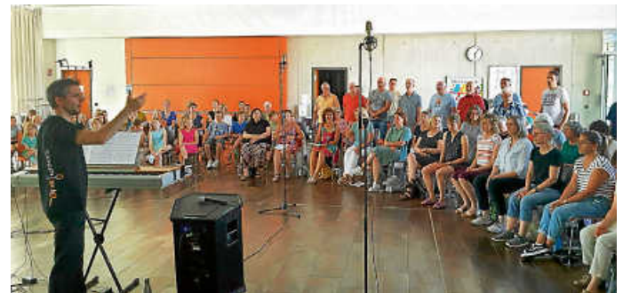
Tonaufnahme zu „(M)Ein Song für Bruchsal“