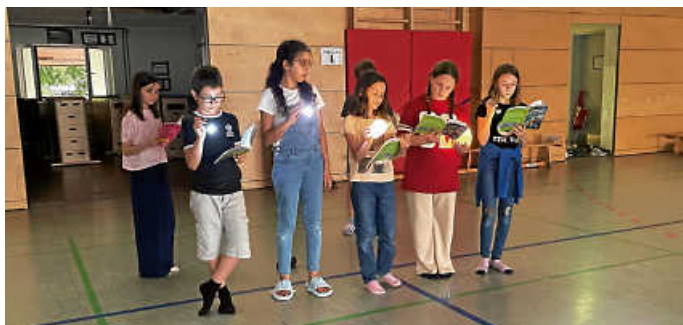
Lektüre lesen mal anders!