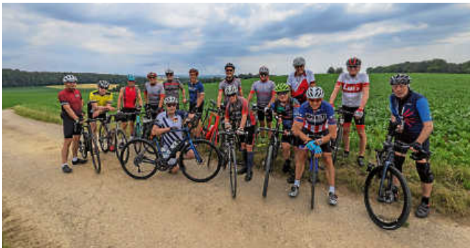
Fotostopp am Howald