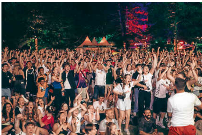
Public Viewing im Bürgerpark