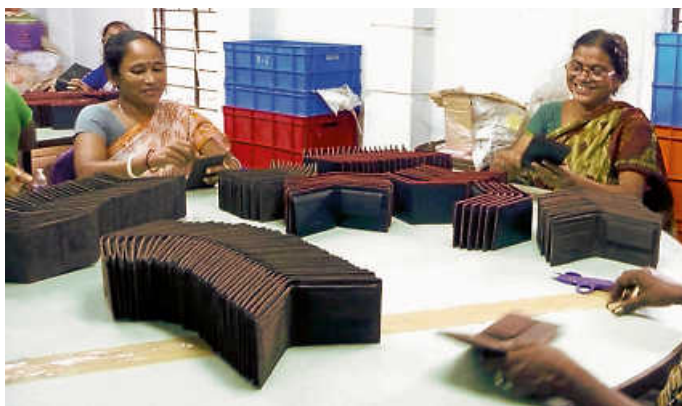
Faire Arbeitsbedingungen erhalten handwerkliche Kenntnisse