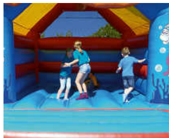
2019 Hüpfburg-Spaß beim DRK

Vorbeikommen lohnt sich für Jung und Alt! DRK und Jugend-Rotkreuz freuen sich auf Euch!