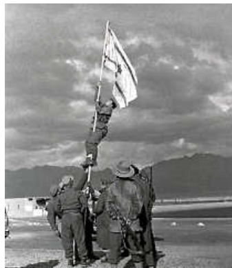
Israelische Soldaten hissen die improvisierte „Tintenflagge“ nach der kampflosen Einnahme von Eilat Foto: Eilat; 10. März 1949; Wikipedia