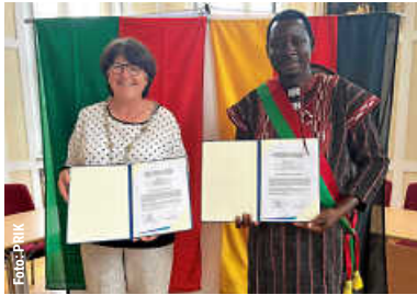
Internationaler Besuch | 13

Aktuelle Stellenangebote finden Sie unter: www.bruchsal.de/stellenangebote