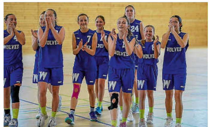
U14w fährt nach Berlin