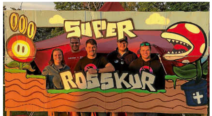
Unser Stationsteam bei der Rosskur

Und schließlich hieß es am Pfingstwochenende wieder Zeltlagerzeit! Unsere Taucher verbrachten dieses Jahr ihr Taucherlager des Bezirks Karlsruhe in Eggenstein-Leopoldshafen, während unsere Jugend am Zeltlager der DLRG-Jugend Baden in Furtwangen teilnahm.