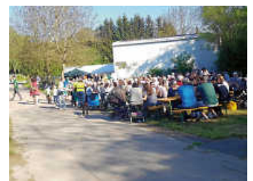
Vatertagsfest bei der OGV-Halle

Bei schönstem Wetter und mit vielen Besucherinnen und Besuchern konnte der OGV wieder sein traditionelles Vatertagsfest bei der OGV-Halle feiern. Wir bedanken uns ganz herzlich bei allen Helferinnen und Helfern, sei es für den Auf- oder Abbau, für die Kuchenspenden oder für die Dienste beim Getränke- und Essensstand, an der Kasse, beim Geschirrspülstand, in der Kuchenbar oder als Springer. Ebenso ein großes Dankeschön an unsere Bedienungen, die nicht müde wurden, Essen und Getränke zu den Gästen an die Tische zu bringen. Ohne diesen Einsatz wäre ein solches Fest nicht möglich. ISc