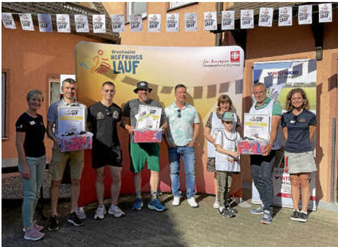
Vertreter der Siegermannschaften nahmen die Ehrungen entgegen

Der Bruchsaler Hoffnungslauf war am 4. Mai im Hof der Stirumschule gestartet, führte über die altbekannte Strecke durch die Bruchsaler Innenstadt und den Schlossgarten. Bereits zum 27. Mal gingen Menschen aller Alters- und Leistungsklassen unter der Leitung des Caritasverbandes für den guten Zweck an den Start. Die dadurch erlaufenen Spenden gehen zugunsten von durch Armut bedrohte Familien im nördlichen Karlsruher Landkreis und werden beispielsweise für bedarfsgerechte Beratung oder individuelle Einzelfallhilfen eingesetzt.