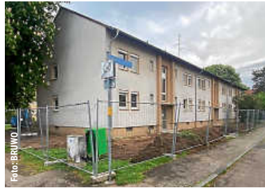
Baumaßnahmen „Alte Siemensiedlung“ | 14