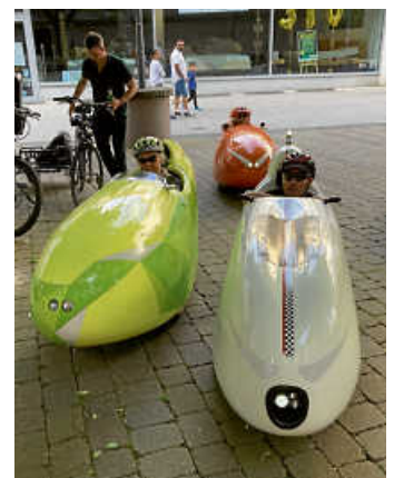
Velomobile im Mai 2023

Es geht am neuen Feuerwehrhaus vorbei Richtung Südstadt zum Kreisel an der Ernst-Blickle-Straße über die Fritz-Erler- und