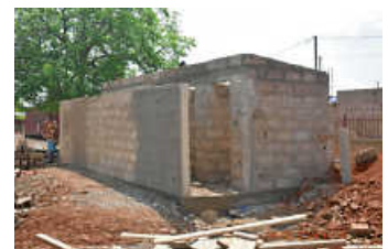
Besucher-WCs brauchen noch Dach, Außen- und Innenputz sowie sanitäre Installationen

Unser Entwicklungshilfeministerium (BMZ) hat unser bisher größtes Entwicklungsprojekt mit knapp 612.000 Euro bezuschusst. Der Pro-