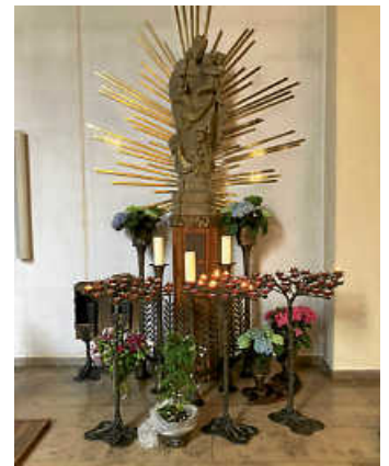
Marienaltar in der Kirche Unsere liebe Frau, Eppingen

Es hat nur leicht genieselt! Vergangene Woche startete die Frauengemeinschaft kfd ihren Halbtagsausflug in die romantische Stadt Eppingen, die 985 nach Christus zum ersten Mal urkundlich erwähnt wurde. Schon auf der Hinfahrt genoss man die Zeit für gute Unterhaltungen. Aus dem Alltag einmal herauskommen, fördert Geist und Seele. Gleich nach der Ankunft freute man sich auf die Maiandacht in der Kirche Unsere liebe Frau. Die gut erhaltenen Fresken aus dem 15. Jahrhundert wurden schweigend und voller Ehrfurcht betrachtet. Eine Mitreisende lud mit ihrer kleinen Flöte zur Ruhe und zur inneren Einkehr ein. Zwei