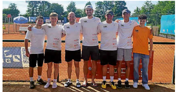
1. Herrenmannschaft DJK Bruchsal

Ein toller Bezirksligaspieltag mit vorwiegend ortsansässigen Spielern, traumhaftem Wetter und dem besten Publikum.