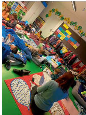
Lesenacht 2b