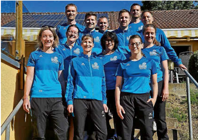
Herren 30 und Damen 30