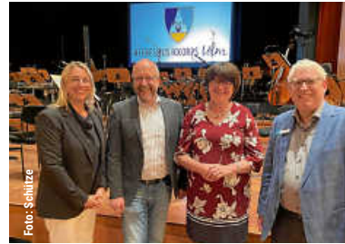
Benefizkonzert des Heeresmusikkorps | 2