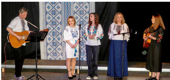
Teil des ukrainischen Chores