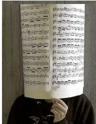
„Musiktheorie“ in verschiedenen Leistungsstufen gibt es an der MuKs

Infos ab dem 3. Juni über (072 51) 91 340 oder jederzeit unter mail@muks-bruchsal.de