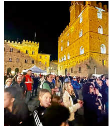
Die Piazza dei Priori mit Rockkonzert zur Museumsnacht

Die festliche Museumsnacht wurde wieder gut angenommen und die Straßen waren voller gut gelaunter Menschen. Man konnte übrigens auch über Heidelheimer stolpern, sind doch unsere Fahnen-schwinger der FFW Heidelberg zu einem Trainingsbesuch gerade in Volterra!