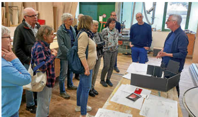
Mitglieder des Freundeskreises hören gespannt den Ausführungen des Werkstattleiters zu

Wer sich über den Freundeskreis und die besonderen Veranstaltungen im Jahresprogramm informieren möchte, schreibe bitte einfach an freundeskreis@badische-landesbuehne.de . Und all diejenigen, die das nächste Mal auch etwas Besonderes erleben möchte, finden auf der Internetseite der Badischen Landesbühne ( https://www.badische-landesbuehne.de/de/seiten/freundeskreis.html ) die Mitgliedsanträge.