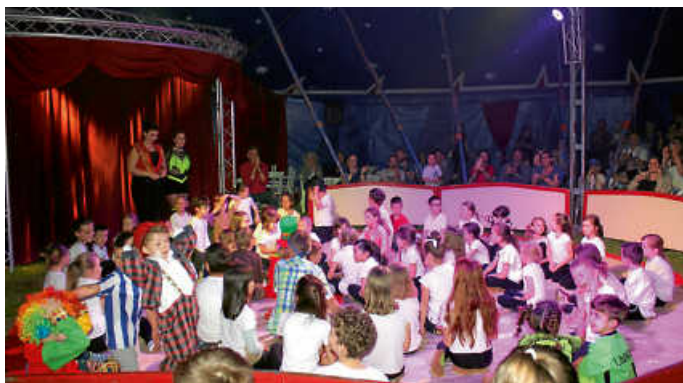
4. Mai – Abschied vom Zirkusprojekt