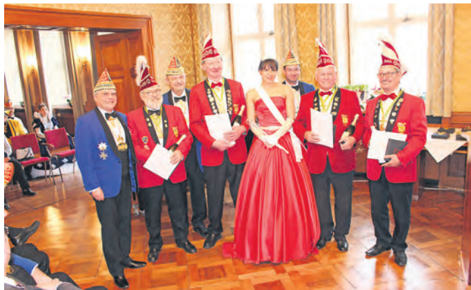
Goldene Löwen der BKG