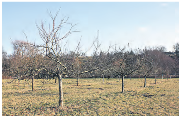
Streuobstwiese am Ende des Reitschulweges