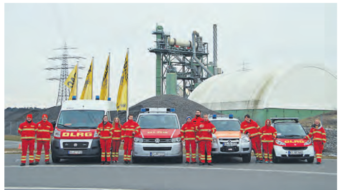
Teilnehmer des Fahrsicherheitstrainings