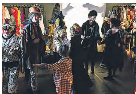
Tag der offenen Tür beim neuen theater treppab