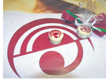
Champagner-Trüffel-Neujahrspraline mit dem GV Logo