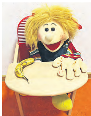
Kindertage in Bruchsal

In Bruchsal sowie in den Stadtteilen stehen Ihnen einige Tagespflegepersonen in privaten Räumen sowie 7 TigeR Modelle zur Verfügung. Die Kindertagespflege ist eine individuelle Form der Kinderbetreuung für Kinder zwischen 0 und 14 Jahren. Die Tagespflegepersonen bieten Ihnen als Eltern für Ihr Kind eine flexible Betreuung in familiärer Atmosphäre. Durch die kleinen Gruppengrößen und die dauerhafte Bezugsperson findet eine individuelle Förderung für Ihr Kind statt.