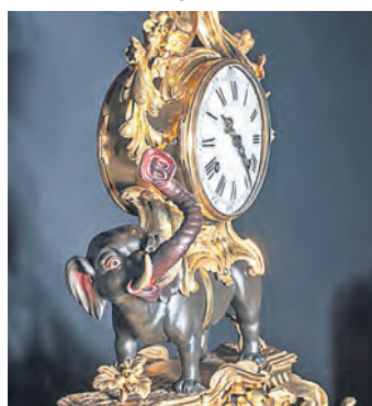
Der gesuchte Elefant Detailaufnahme

Am Sonntag, 29. Januar, 14 Uhr, können sich Groß und Klein im Deutschen Musikautomaten-Museum (DMM) im Bruchsaler Schloss unter charmanter Führung auf die Suche nach einem wundersamen Elefanten begeben. Dabei erfahren sie auf spielerische Art, wie der Elefant ins Museum gekommen ist und warum er so klangvolle und über 200 Jahre alte Musik spielt. Das DMM ist eine wahre Schatzkiste, so dass außer dem Elefanten noch weitere spannende Figuren aufgespürt werden. Nach der musikalischen Spurensuche können die Kinder unter Anleitung auch eine kleine Überraschung basteln. Die Führung ist für Familien mit Kindern ab 6 Jahren geeignet. Sie beginnt um 14 Uhr. Der Eintritt entspricht dem Museumseintritt und beträgt sechs Euro, ermäßigt drei Euro.