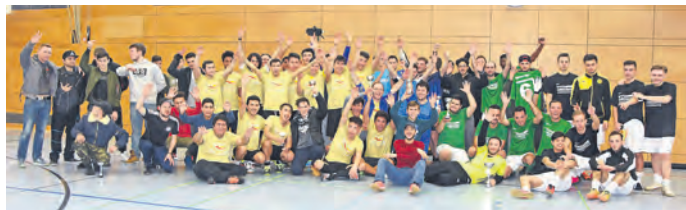
Bei den insgesamt acht Mannschaften aus Bruchsal und der Umgebung stand der Spaß am Fußball im Vordergrund.

Neben den sportlichen Leistungen sind aber vor allem der faire Umgang und der gegenseitige Respekt der Spieler und Teams untereinander zu erwähnen, der über das gesamte Turnier hinweg gegeben war. Ein besonderer Dank gilt wieder den beiden Schiedsrichtern, die wieder eine hervorragende Leistung boten und die Spiele jeder Zeit im Griff hatten. Ein weiteres Dankeschön an die Verantwortlichen beim SV 62 für die gute Zusammenarbeit und an die Jugendlichen aus dem HdB, die für die Turnierleitung und die Bewirtung der Spieler und Zuschauer verantwortlich waren.