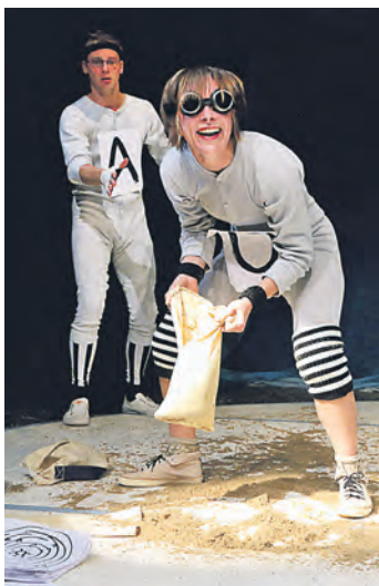
Gastspiel „Himmel und Hände“

Drei Gastspiele zur Eröffnung der Spielstätte „theater treppab“ Mit einem bunten Festival vom 20. bis 28. Januar 2017 eröffnet die Badische Landesbühne ihre neue Spielstätte für das Kinder- und Jugendtheater.