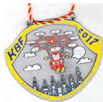
Jahresorden des KBF Bruchsal 2017

2017 bewegt sich der traditionelle (51.) Bruchsaler Fasnachtsumzug am 19. Februar 2017 ab 13:33 Uhr durch die Innenstadt. Doch wie eigentlich sieht die Zukunft aus, wenn der 55. Umzug ansteht? Das ist unsere Vorausschau!