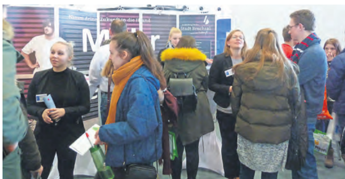
Stadtverwaltung Bruchsal als Ausbildungsbetrieb auf der Azubimesse in der dm-Arena vertreten.

Bruchsal (pa) | Am 21. Januar 2017 fand in der dm-Arena Karlsruhe die alljährliche Ausbildungsmesse „Einstieg Beruf“ statt. 18.500 Besucher zählten die Verantwortlichen der IHK, der Handwerkskammer und der Bundesagentur für Arbeit, so viele wie nie zuvor. Zeitweise war ein Durchkommen nur schwer möglich. Auch die Stadt Bruchsal war mit einem Messestand durch Azubis verschiedenster Bereiche und den Ausbildungsverantwortlichen vertreten. Viele gute und erfolgreiche Gespräche wurden geführt.