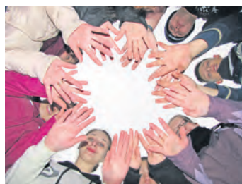
Viele Hände retten viel Natur