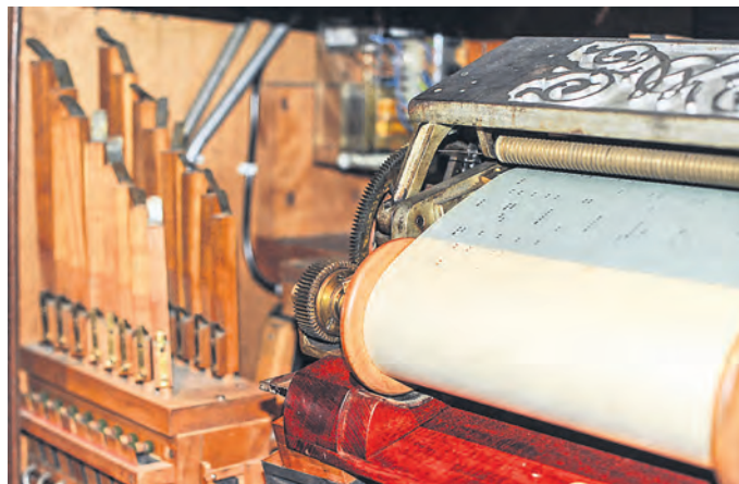
Die „Weber Unika“ ist ein „Highlight“ des selbstspielenden Instrumentenbaus.

Am Sonntag, 5. Februar um 11 Uhr wird Klaus Biber, Restaurator im DMM, diese besondere „Weber Unika“ – so der Name des Automaten – vorstellen. Dabei berichtet er von der Waldkircher Firma Weber, spricht über die Technik des Instrumentes – und spielt natürlich viel Musik. Der Vortrag findet statt im Rahmen der monatlichen Stammtische des DMM-Fördervereins in der Historischen Wirtschaft (3. Obergeschoss). Auch interessierte Gäste sind hierzu herzlich eingeladen. Für Nicht-Mitglieder wird lediglich der reguläre Eintritt in Schloss Bruchsal erhoben, der Vortrag selbst ist unentgeltlich. (tam)