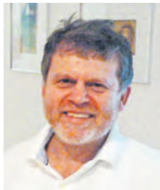
Bruchsaler Men's Night Teilnehmer