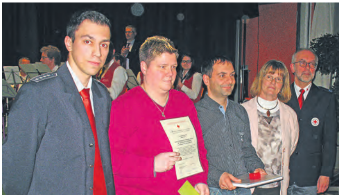
Ehrung der Blutspender beim Neujahrsempfang der Arge