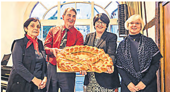
Gekonnt präsentiert, die GV Neujahrsbrezel

Eine gelungene, glanzvolle Auftaktveranstaltung zum Jahresbeginn 2017 des GV Helmsheim mit Sektempfang, schönem Chorgesang, starken Soloauftritten, würdevollen Ehrungen und Dankesworte, ein toller Überraschungsgast mit Gefühl, kreativen Leckereien, vielfacher Prominenz und vielen emotionalen Momenten.