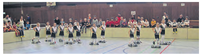
Der Auftritt unserer Cheerleaders war wieder ein voller Erfolg

Die Jugendabteilung des FC Germania Untergrombach hat wieder einmal einige sehr schöne Hallenturniere bzw. Spielfeste in der Bundschuhhalle in Untergrombach durchgeführt. Für die bereits erfahrenen Jugendfußballspieler unserer E, D und B-Junioren ging es hier wieder darum sich gegen die eingeladenen Gastmannschaften aus der Region durchzusetzen. Um auf das Siegerpodest zu gelangen, dies gelang dann auch unserer B-Jugend mit einem guten zweiten Platz und unseren D-Jugendspieler die sich hier den ersten Platz erspielen konnten. Während bei den F-Jugendspieler und unseren jüngsten im Verein den Baminifußballer die altersentsprechenden beziehungsweise kindgerechten Spielfeste durchgeführt wurden. Bei diesen Spielfesten werden grundsätzlich keine Gruppensieger ermittelt. Hier sind die Spielergebnisse nicht so von Bedeutung sondern es soll die Spielfreude maßgeblich gefördert werden. Daher wurde dann auch jedes teilnehmende Kind für die erbrachten Leistungen am Ende mit einer Medaille belohnt. Unsere Cheerleaders hatten hier auch gleich ihren ersten Auftritt in diesem Jahr. Mit einer toll einstudierten Vorführung sorgten sie wieder für eine besondere schöne Stimmung in unserer Sporthalle. Nach einem langen Wochenende können die Organisatoren auf ein sehr erfolgreiches Hallenturnier zurückblicken.