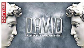
David - Ein Leben nach dem Herzen Gottes

Kaum eine Person der Bibel fasziniert so sehr wie David. Er ist der kleine Hirtenjunge, der zum König wurde. Sozusagen vom Tellerwäscher zum Millionär. David war ein treuer Hirte, ein loyaler Diener, ein erfolgreicher Feldherr, ein mächtiger König und ein begnadeter Dichter. Aber er war auch ein Lügner, ein Mörder und ein Ehebrecher. Er war ein Mann mit Ecken und Kanten.