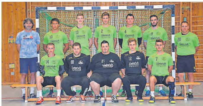
Die Herrenmannschaft I der HSG