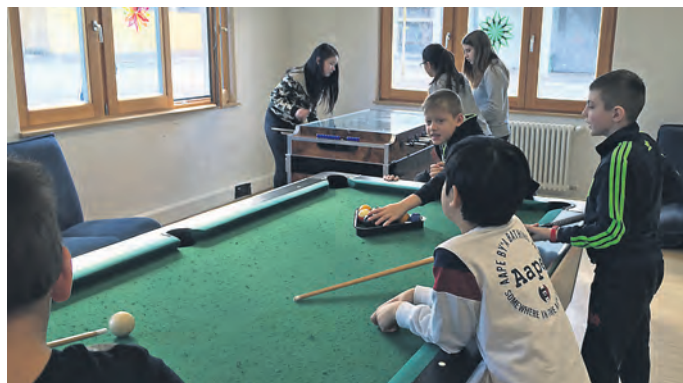
Zu Besuch in der Konrad-Adenauer-Schule