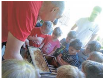
Besuch beim Imker