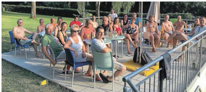
Die neuen Helferteams in geselliger Runde