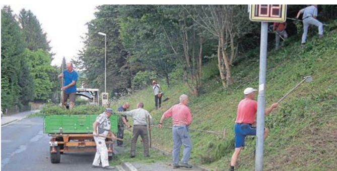
Viele fleißige Helfer bei der Böschungspflege