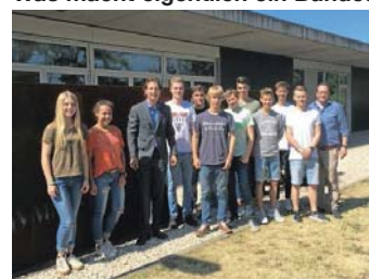
MdB Gutting zu Besuch beim Heisenberg-Gymnasium