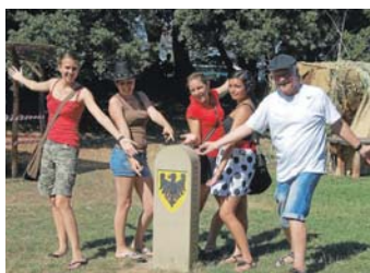
Heidelberg beim Partnerschaftsstein in Volterra

Während des diesjährigen Reichsstadtfestes geht ein großer, langgehegter Wunsch des Freundeskreises Volterra in Erfüllung: ein Zwillingstein zum Partnerschaftsstein wie er seit 2009 in Volterra steht, wird nun den Bürgerinnen und Bürgern Heidelheims übergeben!