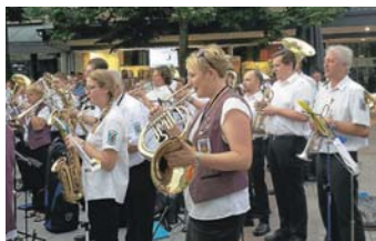
Musikverein Eintracht Obergrombach und MV Helmsheim auf dem Rathausplatz

Am Sonntag fand die OB-Wahl in Bruchsal statt. Zusammen mit der Feuerwehr, dem Fanfarenzug und anderen Bruchsaler Musikvereinen sowie vielen Schaulustigen wartete auch der MVO auf dem Rathausmarkt auf die Bekanntgabe des vorläufigen amtlichen Endergebnisses.