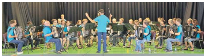
Das Orchester I des HCU beim MatineeKonzert in der Joß-Fritz-Schule