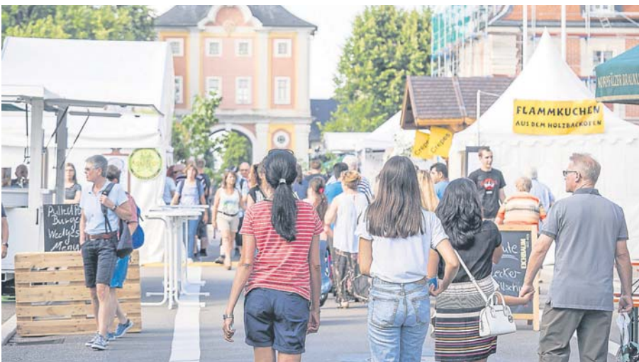
Sonniges, aber dennoch erträgliches Wetter macht zuversichtlich, die Zahl der 25.000 Besucher vor zwei Jahren wieder zu erreichen.

amtlichen Sanitäter des DLRG Bruchsal. Der Dank der Stadtverwaltung gilt ausdrücklich all den freiwilligen Helfern, die mitunter lange im Voraus und bei heißem Wetter viel zusammen geleistet haben und blickt zurück auf ein erlebnisreiches Fest. tri