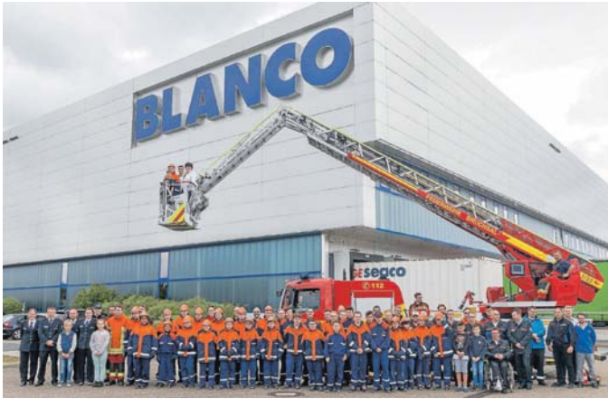
Gruppenbild mit allen Übungsteilnehmern und Gästen

Jugendfeuerwehren der Stadt Bruchsal üben anlässlich ihrer Jahreshauptversammlung auf dem Gelände des BLANCO-Logistikzentrums in Bruchsal.