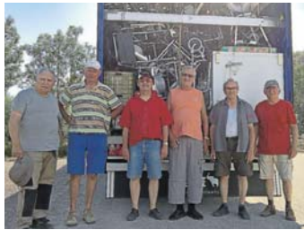
Das verbliebene Lade-Team an unserem Container-Außenlager

Nennen Sie uns in der Überweisung bitte Ihren Verwendungswunsch ( Burkina Faso, Burundi, Kongo, Togo, Uganda, Flüchtlinge im Libanon, Lepra-Heilung, Osteuropa, Behindertenhilfe , Regionale Sozialhilfe ) und Ihre volle Adresse für die Spendenquittung!