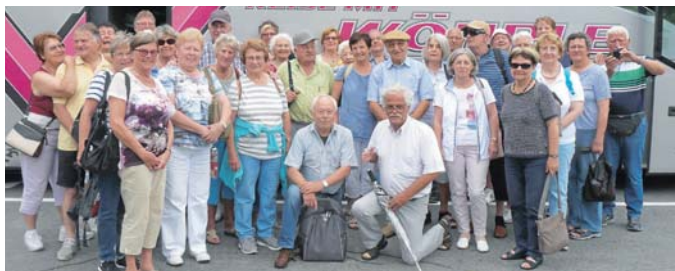
MSC-Reise Millstätter See