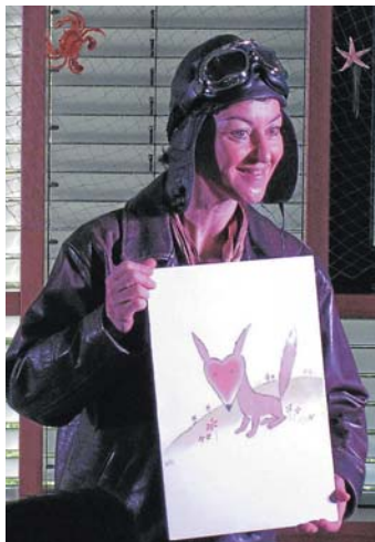
Prominenter Gast am Schönborn-Gymnasium