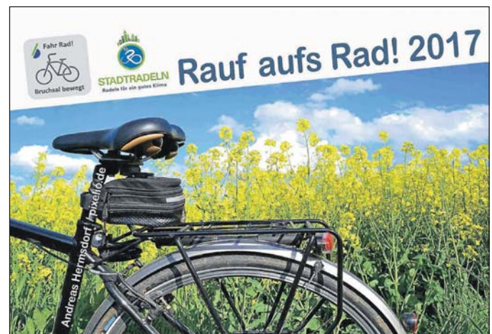
„Rauf aufs Rad“ nach Speyer am 17. Juli

Die Route führt über Huttenheim und Philippsburg nach Speyer. Der Rückweg beginnt mit einer Fährenfahrt über den Rhein nach Rheinhäusen über Waghäusel zur Eremitage und weiter nach Hambrücken zum Vogelpark und wieder zurück nach Bruchsal. Die Strecke umfasst ca. 70 km in der Ebene. Von Speyer besteht zudem die Möglichkeit mit dem Zug zurückzufahren. Anmeldung zur Tour beim Agenda-Büro, Telefon: (07251) 79-512 oder Agendabuero@Bruchsal.de