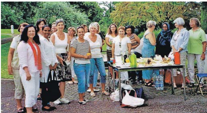
Die fröhliche Picknickrunde vom Vorjahr