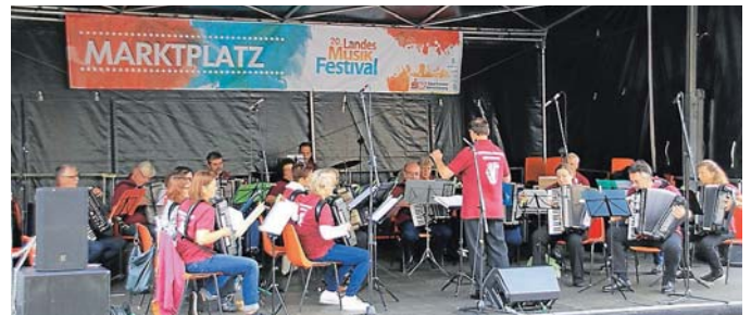
Auftritt des HFB-Orchesters