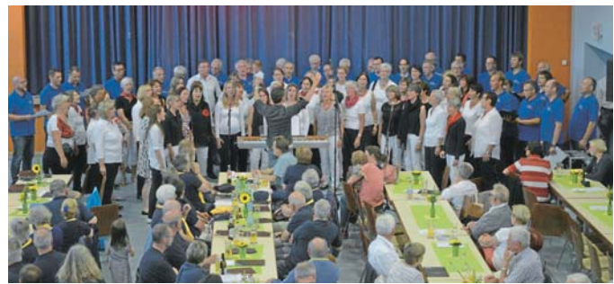
Gut besuchtes Festival