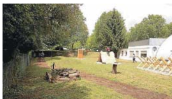
Parcours im Pugilist

Nun ist es endlich so weit – das Training unter freiem Himmel kann starten! Nutze unser Outdoor-Rack oder unseren Outdoor-Trim-Dich-Parcours. Damit kannst Du viel Abwechslung in Dein Work-out bringen. Auf einer Laufstrecke von 1,2km sowie dem Trimm-Dich-Bereich findest Du verschiedene Old-School Hindernisübungen, die ein geniales Training einfach perfekt machen! Einfach mal vorbeikommen und ausprobieren! Infos: Pugilist Boxing Gym, Schwetzing Str. 60, 76646 Bruchsal 07251-934988 oder www.pugilist.de