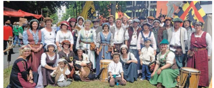
Bürgerwehr Heydolfesheim beim Peter-und-Paul-Fest 2017