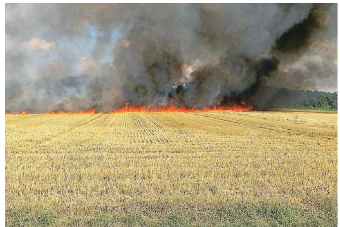
Das Feuer breitete sich durch den Wind angefacht rasend schnell aus und erreichte auch den angrenzenden Wald

Die Feuerwehr Bruchsal wurde mit den Abteilungen Büchenau, Untergrombach, Obergrombach und Bruchsal am Samstagnachmittag um 16.49 Uhr mit dem Alarmstichwort „Flächenbrand groß“ auf eine Feldfläche im Gewann „Unterer Vogelgesang“ gerufen. Von weitem war eine Rauchsäule auf der Anfahrt schon sichtbar. In der Erstphase wurde von den Wehrleuten an verschiedenen Stellen versucht, das Feuer aufzuhalten. Hierfür wurde die Feuerwehr Bruchsal von der Feuerwehr Karlsdorf-Neuthard, der Feuerwehr Stutensee, der Feuerwehr Weingarten und der Werkfeuerwehr des KIT unterstützt. Das Feuer war allerdings schon an zwei Stellen über einen Weg auf das angrenzende Waldgebiet übergesprungen. Es musste schnellstmöglich eine stabile Wasserversorgung hergestellt werden. Neben dem betroffenen Feld befand sich ein Saugbrunnen der mit einer Tragkraftspritze angezapft wurde. Im weiteren Einsatzverlauf wurde mit dem Abrollbehälter Schlauch eine Leitung vom etwa 750 Meter entfernten Wasserwerk Bruchsal zur Einsatzstelle über die Feldwege verlegt. Schließlich gelang es der Feuerwehr den Brand auf dem Feld und in den Waldstücken unter Kontrolle zu bringen. Zur Unterstützung und Ablösung der teilweise erschöpften Einsatzkräfte vor Ort wurde die Feuerwehr Ubstadt-Weiher hinzu gerufen. Zur Sicherung des Grundschutzes für weitere Einsätze wurden die Abteilungen Helmsheim und Heidelberg auf Bereitschaft alarmiert.