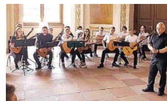
Ensemble Junge Gitarristen

Am 23. Juli findet um 17 Uhr im Saal des Vinzentiushauses, Josef-Kunz-Str. 4 in Bruchsal das Schülervorspiel des Tonkünstlerverbandes Karlsruhe/Bruchsal statt. Es spielen fortgeschrittene Schüler der Verbandslehrkräfte auf Klavier, Querflöte und Gitarre. Auch Kammermusik mit Querflöte und Gitarre wird dargeboten sowie Werke für Gitarrenensemble vom Ensemble Junge Gitarristen. Der Ton-