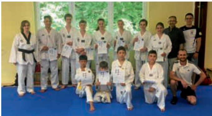
Prüflinge, Trainer und Prüfer der Taekwondo Abteilung