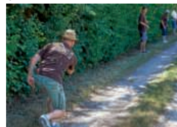
Impressionen vom Boßeln

Wir laden alle Ortsvereine, befreundete und benachbarte Vereine, Gruppierungen, Stammtische, Parteien usw. recht herzlich ein, beim 19. Helmsheimer Boßeltturnier mitzumachen. Start ist wie all die Jahre bei der Turnhalle am 16. Juni um 13:30 Uhr, Anmeldungen und Informationen erhalten Sie unter www.mvhelmsheim.de und können bei Achim Böhler, Am Giesgraben 10, Telefon (07251) 5889 (nach 19 Uhr), Sabine Bucher, Zum Rötig 40, Telefon (07251) 59714 (nach 19 Uhr) eingeholt werden. Wir freuen uns auf viele Mannschaften zum Boßeln!