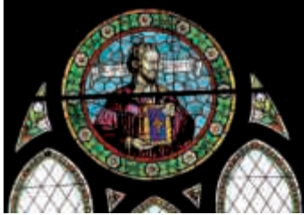
150 Jahre Kirchturm der evangeli- schen Kirche in Heildelshheim