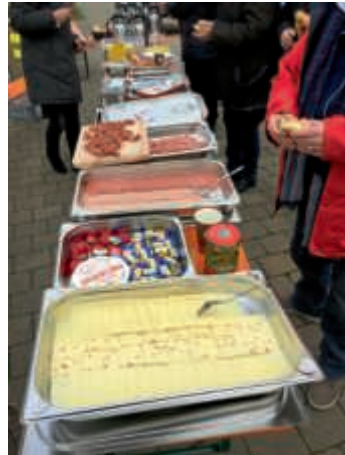
Ein reichhaltiges Picknick (Symbolbild)