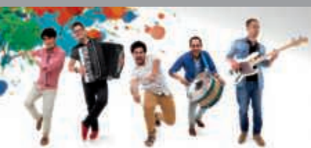
Brasilianische Rhythmen am Bergfried