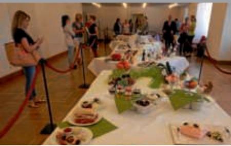
Aufgebretzelt - Ausstellung Schloss