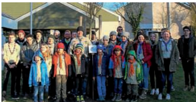
Bild der DPSG Bruchsal beim Pflanzen ihres Jubiläumsbaums bei St. Paul

Vom 8. bis 9. September feiert die Deutsche Pfadfinderschaft St. Georg, genauer gesagt der Stamm Christophorus Bruchsal, in St. Paul sein großes Jubiläumswochenende.