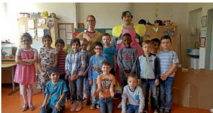
Badische Landesbühne in der Stirumschule