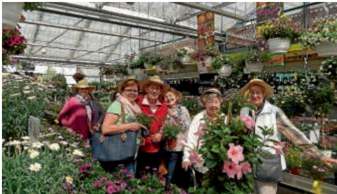
Haus Silbertal on Tour