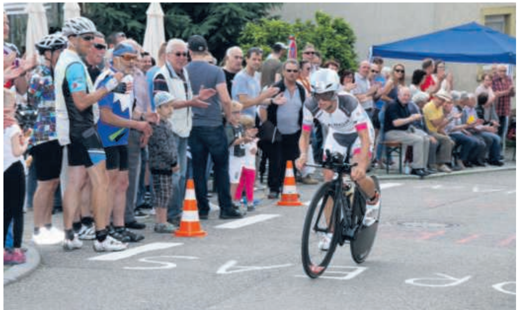
Ein hartes Programm: 1,9 Kilometer Schwimmen im Hardtsee, 90 Kilometer Radfahren durch die wunderbare Kraichgau-Landschaft mit den Fixpunkten Östringen (Herausforderung Schindelberg) und Kraichtal sowie die 21,1 Kilometer Laufstrecke mit Start und Ziel in Bad Schönborn