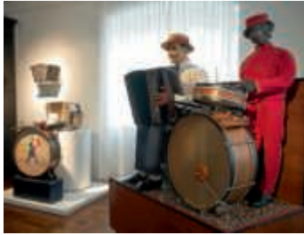
Orchestrion „Pneuma-Accordeon Jazz“, genannt „Tino Rossi“ (Paris, Camerano, Berlin) um 1930

Führung für blinde und sehbehinderte Besucher „Musik nach Feierabend. Musikautomaten in Gaststätten und Tanzsälen“ Samstag, 9. Juni, 15.30 Uhr