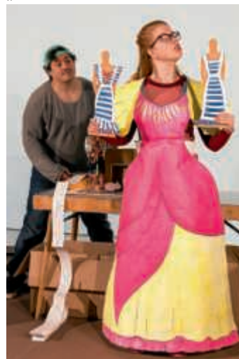
„Die Prinzessin und der Schweinehirt“