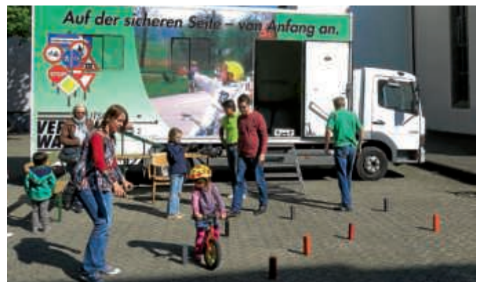
Fahrradparcours für die Kleinsten