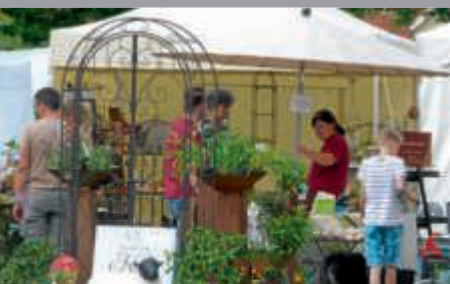
DiGA am Schloss vom 25. - 27. Mai