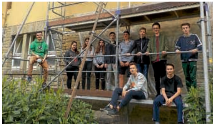
Die JKG-Sprayer auf dem Baugerüst

Auch wenn das Ergebnis vielleicht etwas anders aussieht als ursprünglich gedacht, können die Schüler stolz sein. Im Schulhof gibt es Veränderungen, von denen die ganze Schulgemeinschaft profitiert. Alle Beteiligten haben erfahren, wenn viele gemeinsam zusammenarbeiten, lassen sich Veränderungen bewirken.