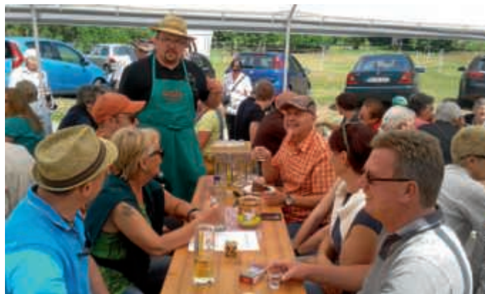
2017 - Besuch beim Obst- und Gartenbauverein Obergrombach, bei schönem Wetter

Gesangverein von Spöck sein Waldfest ins Vereinsheim verlegt. Mit großem Hallo wurden wir spätnachmittags noch empfangen. Allen, die bei den Vatertags Gegenbesuchen dabei waren, ein „Dankeschön“. GV