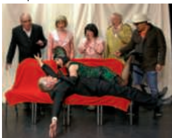
Die Koralle führt „Pension Schöllner“ auf.

Philipp Klapproth will sich in Berlin mal so richtig amüsieren – in einer Irrenanstalt! Sein Neffe Alfred braucht das Wohlwollen und das Geld des Onkels und weiß sich daher zu helfen: Er nimmt den Gutsbesitzer aus der Provinz mit zu einer Soirée in die Pension Schöllner – und lässt ihn in dem Glauben, er befände sich in einer Nervenheilanstalt. Onkel Klapproth unterhält sich prächtig mit den skurrilen Bewohnern der Pension – vom Großwildjäger bis zur Romanschriftstellerin – und fährt anschließend vergnügt nach Hause. Dort muss er feststellen, dass die vermeintlichen Iren keineswegs sicher verwahrt sind. Und während Philipp Klapproth versucht, die „Gäste“ im Zaum zu halten, dreht sich die Spirale des Wahnsinns für ihn immer weiter.