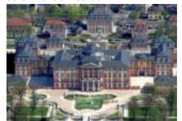
„Essen und Trinken“ in der Bruchsaler Barockresidenz

Passend zum Themenjahr 2018 der Staatlichen Schlösser und Gärten – „Von Tisch und Tafel“ – steht der Schlosserlebnistag diesmal unter dem Motto „Essen und Trinken“. Die drei im Bruchsaler Schloss ansässigen Einrichtungen präsentieren ein buntes