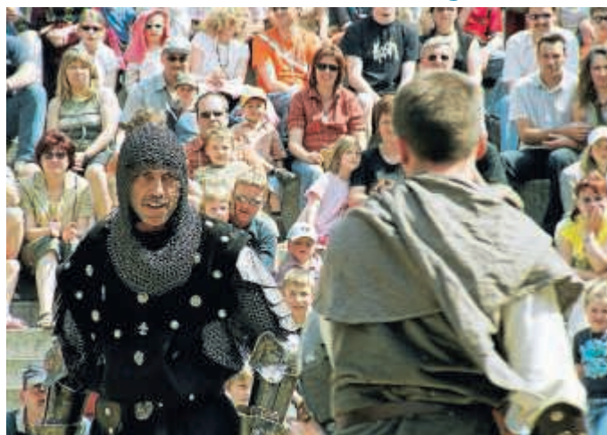
Ritterliches Spektakel erwartet die Zuschauer

Eingeladen haben der Bruchsaler Kultur- und Heimatverein, der Fanfarenzug und die „Schwallebrunnegeister“ gemeinsam mit der Stadtverwaltung. Die Zeitreise rund um Lagerleben und Bewirtung beginnt am Freitag, 15. Juni, um 12 Uhr. Das Besondere daran: Der Eintritt ist durchweg frei. Ein solches Fest für die ganze Familie unter vollständigem Verzicht auf Ticketkosten dürfte wohl landesweit in der Mittelalterszene ziemlich einzigartig sein und ist nur möglich durch das große Engagement der drei ausrichtenden Vereine. Freitag und Samstag bis 24 Uhr, am Sonntag bis gegen 20 Uhr dau-