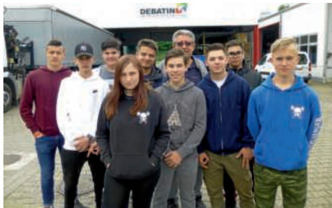
Schüler des Wahlpflichtfaches „Natur- und Technik“ beim Kooperationspartner Werner Debatin