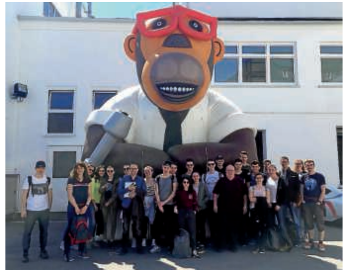
Schülerinnen und Schüler des Technischen Gymnasiums Bruchsal bei Trigema

Das Thema Klöster und Burgen nahm die Schüler weiter mit auf eine spannende Zeitreise ins Mittelalter; neben dem Besuch der Burg Wildenstein bei Leibertingen, erlebten die Schüler auf dem „Campus Galli“ bei Meßkirch den Bau einer karolingischen Klosteranlage. Mit den Mitteln und Bautechniken des 9. Jahrhunderts wird dort ein Kloster nach Vorlage des St. Galler Klosterplans errichtet.