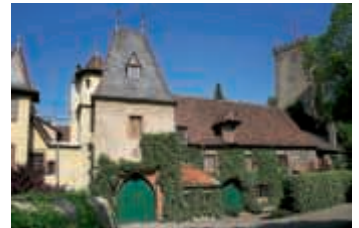
Schloss in Obergrömbach

Nähere Informationen: Touristinformation Bruchsal, Am Alten Schloss 22, 76646 Bruchsal, Telefon (07251) 50594-61, E-Mail: touristinformation@btmv.de