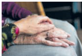
Helfende Hände – Hospizbegleitung ist Lebensbegleitung

Der Ökumenische Hospiz-Dienst (ÖHD) in Trägerschaft des Caritasverbandes Bruchsal und des Diakonischen Werkes ist für Sie da – in Zeiten schwerster Krankheit und des Abschiednehmens.