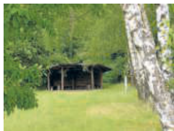
Grillhütte am Aschberg