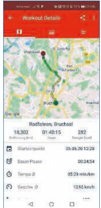
Von überall her mit dem Fahrrad zur Schule und am Nachmittag noch eine Runde laufen gehen.

Hoffen wir darauf, dass die Lust, sich zu bewegen, anhält und wir im kommenden Schuljahr auch endlich wieder in den Sporthallen aktiv werden können! (NM)