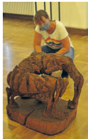
Besucherin vor der Skulptur "Rückblick"