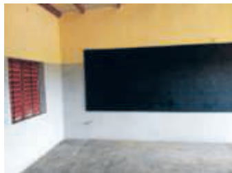
Auch die Schulzimmer darin sind jetzt ganz fertig

Mit dem Bau unserer Berufsschule in Bantougdo/Burkina Faso ging es bis zum Beginn der Coronapandemie gut voran. Zwei der vier Gebäude waren fast fertig als der Bau wegen fehlender Hygiene-Maßnahmen und ausreichenden Unterkünften für die Bauarbeiter eingestellt wurde. Doch die Probleme sind inzwischen behoben, so dass bis September alle vier Schulgebäude errichtet sein werden. In der ganzen Region mit über 60.000 Einwohnern gab es