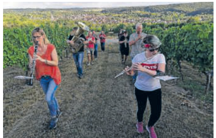
Abschlussprobe MVO in den Weinbergen

Auch wenn die sonntäglichen "Balkonzerte" doch schon zu einer schönen Regel wurden, hofft der MVO, dass es im Herbst in bekannteren Bahnen mit Proben und Auftritten wieder losgehen kann und wünscht einen herrlichen Sommer und hoffentlich einen gesunden Neustart Mitte September. Passen Sie auf sich auf! BB