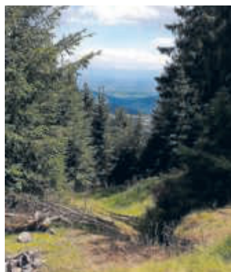
Ausblick vom „Grand Brezouard“ Richtung Schwarzwald

Hier oben, direkt am nördlichen Abschnitt der „Route des Crêtes“ erhebt sich der bewaldete „Grand Brezouard“ mit einer Gipfelhöhe von 1229 Meter. Vier hochmotivierte Paar Wanderschuhe machten sich auf den anspruchsvollen Weg. Im Gepäck vor allem genügend zu trinken, unbedingt Sonnencreme (die UV-Strahlung in dieser Höhe ist enorm) und ein kleiner Snack zur Stärkung. In unserem Fall ein ganzer (!) Apfelkuchen und weitere schmackhaf-