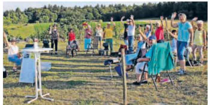
Fröhlich in die Sommerferien