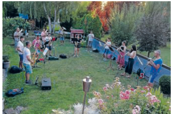
Erste Probe nach der Coronapause

Wir freuen uns, endlich wieder Musik machen zu dürfen! Haben Sie uns am Mittwochabend vielleicht sogar gehört?