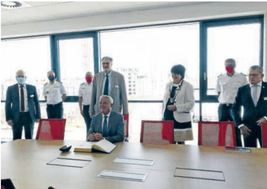
Der stellvertretende Ministerpräsident und Innenminister von Baden-Württemberg, Thomas Strobl, trug sich auch in das Goldene Buch der Stadt Bruchsal ein.

Es war ein ereignisreicher Nachmittag im neuen Feuerwehrhaus. Eine gelungene Veranstaltung, mit einer umfangreichen Führung durch das neue Feuerwehrhaus, für die sich Innenminister Thomas Strobl viel Zeit ließ, endete mit einem außergewöhnlichen Höhepunkt. Der stellvertretende Ministerpräsident des