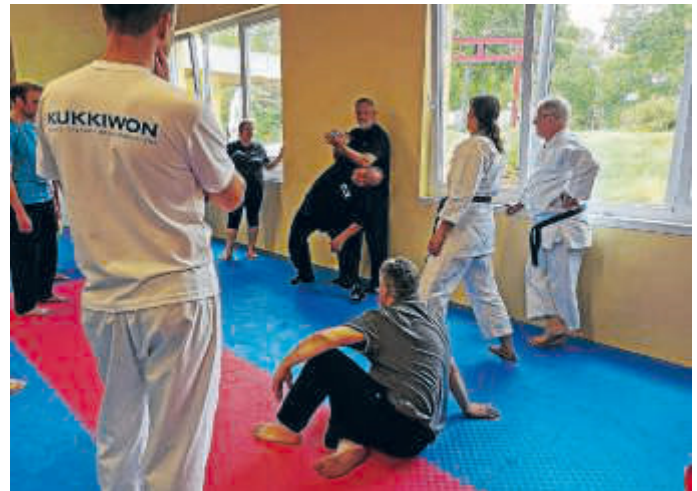
Teilnehmende SV mit System

Informationen gibt es auf unserer Homepage www.vgs-sicherheit.de oder telefonisch unter 07251/83838.