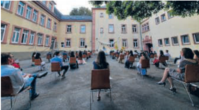
Zeugnisübergabe im Innenhof

eigenen Anlagen und Begabungen zu erkennen, aber auch einzusehen, wo die eigenen Grenzen sind. Dass wir nicht alles selbst in der Hand haben, aber versuchen müssen, das Beste daraus zu machen, hat uns das Corona-Jahr 2020 vor Augen geführt - bei der Abiturfeier am SBG ist dies gelungen. Th