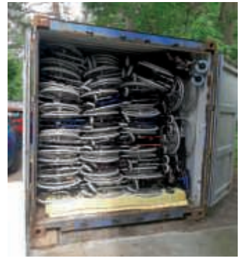
Ein 40-Fuß-Container voll Behindertenhilfsmittel für Äthiopien

Mit 177 Rollstühlen, 70 Rollatoren, 48 WC-Stühlen, 20 Paar Krücken, 50 Gehstöcke u.v.m. können rund 400 behinderten Menschen neue Hoffnung und Menschenwürde gegeben werden. Denn in diesen armen Ländern gibt es kein „soziales Netz“ wie bei uns und viele dieser „Ärmsten der Armen“ können sich nur auf dem Boden kriechend fortbewegen oder vegetieren auf Matratzenlagern. Für die Eltern behinderter Kinder bedeutet die Hilfe auch eine große Erleichterung, wenn die Kinder immer schwerer werden und nur noch mit viel Mühe getragen werden könnten.