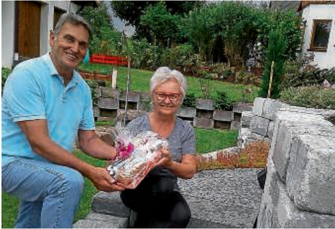
Zum Geburtstag ein Geschenk