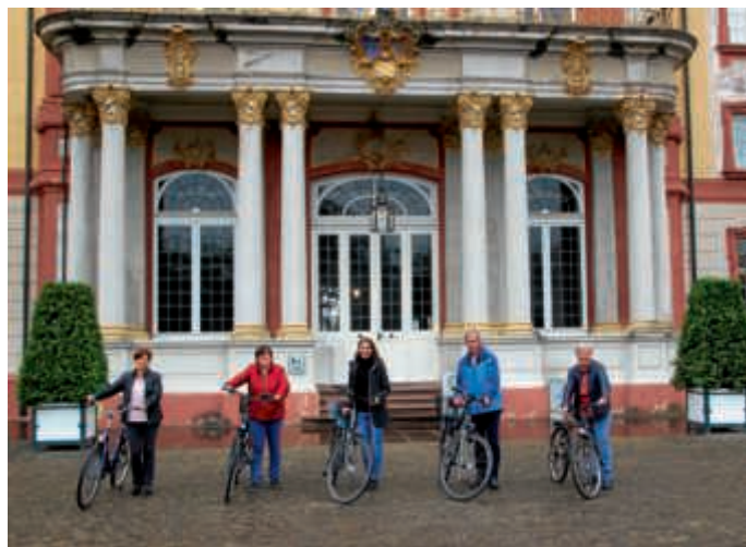
Das Museumsteam für das Bruchsaler Stadtradeln