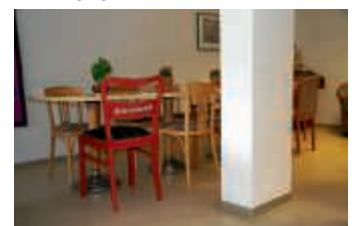
Die Stühle dürfen wieder belegt werden

Nahezu im Wochentakt erlässt das Land weitere Lockerungen hinsichtlich der geltenden Corona-Verordnungen. So konnten Mitte Juni erstmalig nach dreimonatiger Pause in den Räumlichkeiten des AWO BW Bruchsal in der Durlacher Straße wieder Treffen stattfinden. Vorab wurde zur Sicherheit aller ein hausinternes Gesundheitskonzept erstellt, bei dem die Hygiene, der Mindestabstand zwischen den Teilnehmern sowie das Tragen eines Mundschutzes im Vordergrund stehen. Auch wenn es immer noch Einschränkungen im Vergleich zum Jahresbeginn gibt, so bedeuten die Lockerungen doch für alle Anwesenden den Rückgewinn von Lebensqualität durch die wiedergewonnene Gemeinschaft, die allen spürbar fehlte. Mit einem vorgerichteten Frühstück, leichten gymnastischen Lockerungsübungen und einem gemeinsamen Bingo-Spiel konn-