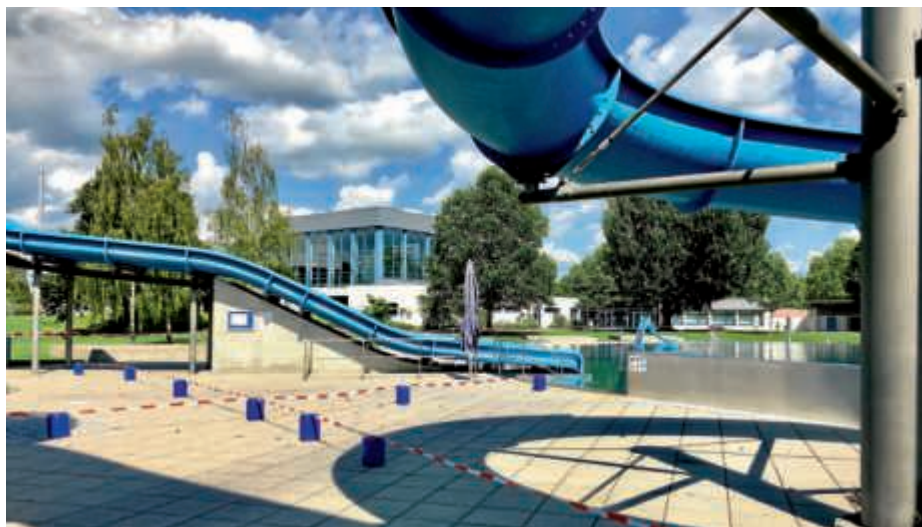
Die Ruhe vor dem (An-) Sturm: SaSch!-Freibad mit ausgeklügeltem Abstandssystem für die Badegäste

Becken, jede Rutsche und den Sprungturm, kurz: für jede „Attraktion“. Zugang und Ausgang der Freibäder sind ebenso wie der Becken-Einstieg und Ausstieg nach Möglichkeit räumlich voneinander getrennt. Die Freibäder Heildelsheim und Obergrombach sind bereits am 22. Juni in die Saison gestartet, das Bruchsaler Freibad SaSch! öffnet bei idealen Bedingungen am heutigen 25. Juni. – Das Hallenbad und die Sauna müssen aufgrund der noch aktuell vorherrschenden Situation weiterhin geschlossen bleiben.