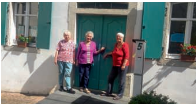
Die drei Frauen vom AWO Ortsverein