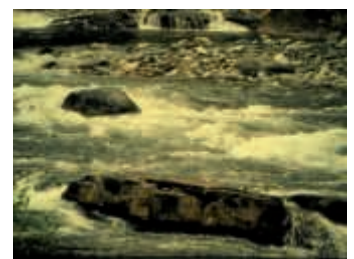
Immer in Bewegung