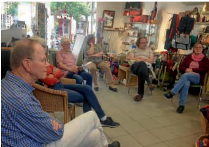
Ladenaktive und Unterstützende nach langer Zeit wieder zur Besprechungsrunde im Weltladen

Öffnungszeiten: Dienstag bis Freitag: 9 bis 18 Uhr, Samstag: 9 bis 13 Uhr, Tel.: 07251 3 926 960