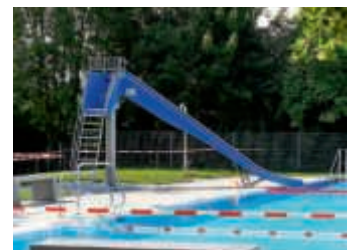
Es darf gerutscht werden

Seit Montag, 22. Juni, hat nun unser Freibad in Heidelberg geöffnet. Eintrittskarten sind vorab über die Homepage der Stadtwerke Bruchsal zu buchen und zu bezahlen. Ohne dieses Online-Ticket ist kein Einlass möglich. Direkt am Eingang an der Kasse lässt sich kein Ticket kaufen. Die Homepage zum Buchen der Tickets lautet: https://eticket.stadtwerke-bruchsal.de oder www.stadtwerke-bruchsal.de . Nach den