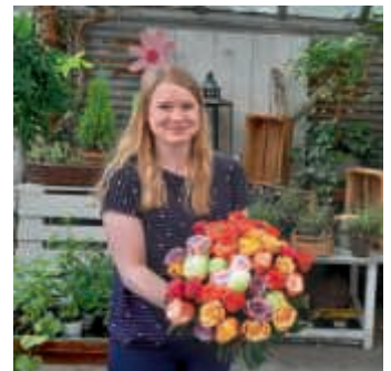
Blumenspende des Floristen Sieg aus Bruchsal

Eigentlich war das vergangene Wochenende insbesondere für die Mitglieder der Stadtkapelle anders geplant. Es hätten arbeitsreiche, aber sehr schöne Tage werden sollen. Doch in diesem Jahr fiel das Marktplatzfest der Stadtkapelle Heildesheim aufgrund der aktuellen Situation aus. Und so gab es im Ortskern Heildesheim weder Sternmarsch noch Fassanstich, keine Musikkapellen und Bands und auch keine Hitparade der SKH. Irgendwie fehlte etwas. Als kleine Aufheiterung in diesen (zumindest für die Kapelle) ungewöhnlich ruhigen Tagen sorgte daher ein Überraschungspaket am Sonntagmittag. Die Musiker fanden vor ihrer Tür einen Gruß des Vorstandes in Form einer Tüte – angefüllt mit kleinen Aufmerksamkeiten: Von Trostpflaster über saure Drops, Taschentücher zum Tränen trocknen bis hin zu einem Foto und ein paar Keksen. Das besondere Etwas verlieh dem Paket eine Rose des Floristen Sieg in Bruchsal. Dank einer Spende des Blumengeschäfts erhielt jedes aktive Mitglied eine große, schöne Rose. (Ein herzliches Dankeschön für diese tolle Unterstützung.)