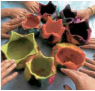
Verschiedene Angebote für Kinder in der Ferien

Es gibt kein gedrucktes Programmheft, alle Veranstaltungen stehen aber online. Auf der Plattform NUPIAN - www.unser-ferienprogramm.de/bruchsal - können Eltern ihre Kinder ab sofort für verschiedene Freizeitangebote in den Sommerferien anmelden. Das geht von zu Hause oder auch unterwegs mit dem Smartphone. Die Anmeldung dauert nur wenige Minuten. Einfach mit einer E-Mail-Adresse registrieren, sich die passenden Veranstaltungen aussuchen und buchen. Bei Änderungen oder Ausfall wird man schnell informiert.