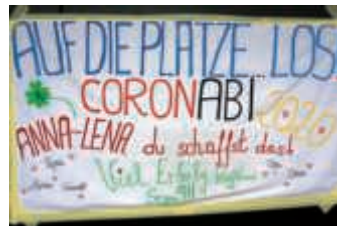
Abitur 2020 am HBG