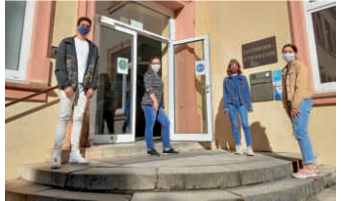
Neustart mit Abstand

vereinbarten Treffpunkt auf dem Pausenhof abgeholt und in die ihnen zugewiesenen Klassenzimmer gebracht wurden. Dort ging es auf zuvor festgelegten Sitzplätzen mit ausreichend Abstand erst einmal um die Einführung in die neuen Hygienevorschriften: Regelmäßiges Händedesinfizieren, das Tragen von Masken im Schulgebäude und das Abstandsgebot. Auch wer sich lange nicht gesehen hatte, durfte sich leider nicht um den Hals fallen oder sich mit einem Abklatschen begrüßen, sondern Körperkontakt musste weiterhin vermieden werden. So bleibt doch vieles am gegenwärtigen Schulalltag noch sehr ungewohnt.