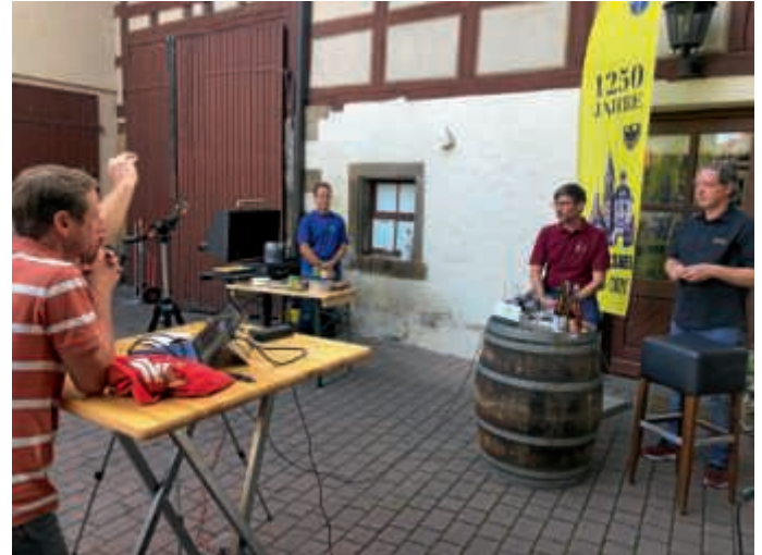
Weinprobe beim Weingut Lutz

Weinfest im August mitgemacht hätte. Bei Traumwetter konnten wir im Innenhof mit den vorgeschriebenen Corona-Abstandsregeln den Abend verbringen und vier Weine vom Weingut Lutz verköstigen und eine Flasche Jubiläumswein. Dazwischen wurden unter launiger Anweisung von Alex H. die Hamburger gegrillt, für die wir Rezepte und Gewürzmischung und hausgemachte Hamburgersoße dem Weinpaket beigelegt hatten. Mit dabei waren vor den Bildschirmen zu Hause gut 25 Teilnehmer.