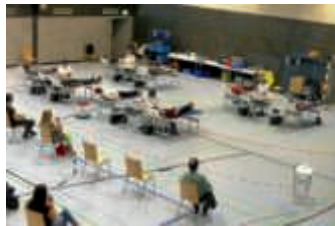
Blutspenden mit Sicherheitsabstand

Die „1. Blutspende-Aktion 2020 in Zeiten von Corona“ war für den Büchenauer DRK-Ortsverein ein großartiger Erfolg. 151 Spender waren erschienen, zwölf konnten leider nicht zugelassen werden, aber 139 Konserven gingen an die DRK-Blutspendezentrale. Unter den 139 Spendern waren acht Erstspender. Danke für Ihr/Euer Engagement im Zeichen der Menschlichkeit.