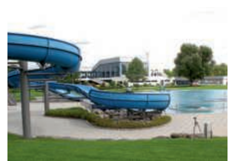
Die Freibäder unterliegen in diesem Jahr schweren Rahmenbedingungen

Die Tickets müssen im Vorfeld eines Besuches über ein eigens hierfür einge-