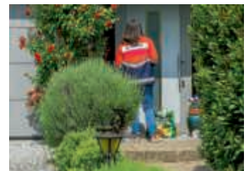
Malteser Einkaufshelferin beim Ausliefern eines Einkaufes

Wir bedanken uns herzlich bei allen Freiwilligen, die ihre Unterstützung angeboten haben, für die vielen positiven Rückmeldungen von Kunden und aus der Bevölkerung, bei der Seelsorgeeinheit St. Vinzenz Bruchsal für die Nutzung ihrer Räumlichkeiten, sowie bei Fa. SEW-EURODRIVE für die Bereitstellung von mehreren Firmenfahrzeugen.