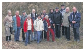
Die 58 plus-Wandergruppe in der Rennweg-Höhle.