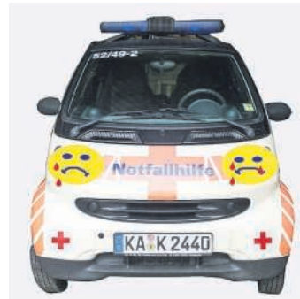
Büchenau ade – scheiden tut weh!

In Büchenau (teilweise auch in Staffort) war ich, der Notfallhilfe-Smart , 13 Jahre im Einsatz. Alle Straßen und viele Hofeinfahrten sind mir bestens bekannt, auch wenn ich viele nur bei Nachteinsätzen gesehen habe.