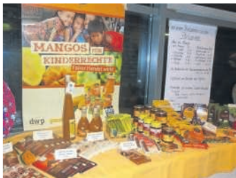
Faire Produkte beim Weltgebetstag

Beim Weltgebetstag, der kürzlich in der Stadtkirche von Bruchsal, den umliegenden Gemeinden und weltweit dieses Jahr auf die Probleme der Philippinen aufmerksam machte, war beim anschließenden Feiern auch der Weltladen mit einem Stand vertreten.