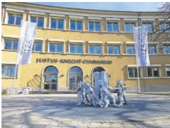
Festakt zum 125-jährigen Jubiläum