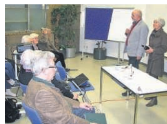
Sicherheitstag des Seniorenrates