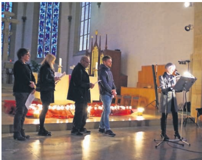
Taizégottesdienst für „Hoffnung und Vertrauen“.