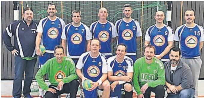
AH-Mannschaft des TV Büchenau