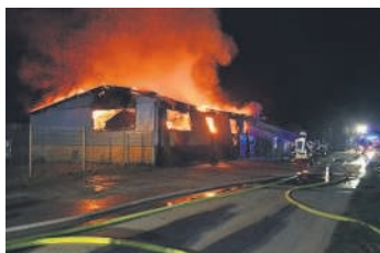
Das Gebäude brannte trotz schnellem Eingreifen der Feuerwehr komplett nieder

In der Nacht von Freitag auf Samstag wurde die Feuerwehr Bruchsal um 1:40 Uhr mit den Abteilungen Helmsheim, Heidesheim und Bruchsal zu einem Wohnungsbrand in die Helmsheimer Straße gerufen. Bereits auf der Anfahrt wurde den Kräften klar, dass es sich hier um einen Vollbrand eines kompletten Gebäudes handeln musste. Der Feuerschein, welcher ein ungefähres Ausmaß erahnen ließ war bereits von weitem zu sehen. Sofort wurden weitere Kräfte aus