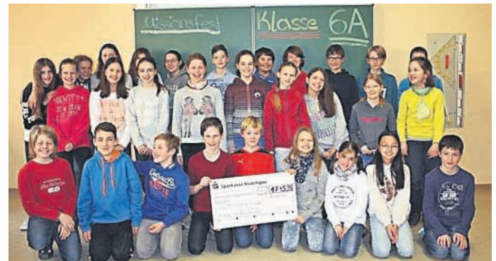
Klasse 6a des Gym. St. Paulusheim