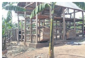
Uganda: Aufgebaute Stallung für geplante Viehzucht