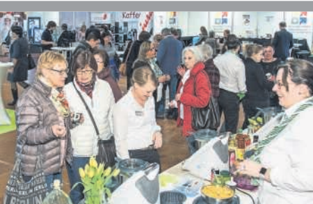
15. Bruchsaler Gewerbeschau und Immobilientage