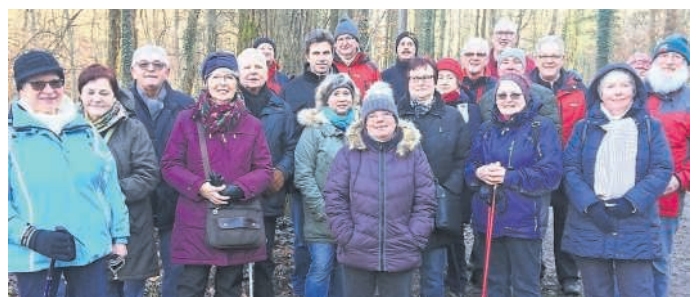
Im Heidelberg Wald bei der Januar-Wanderung