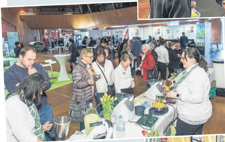
◀ An allen Ständen war probieren und informieren angesagt – auch bei den aktiven Damen von Thermomix.