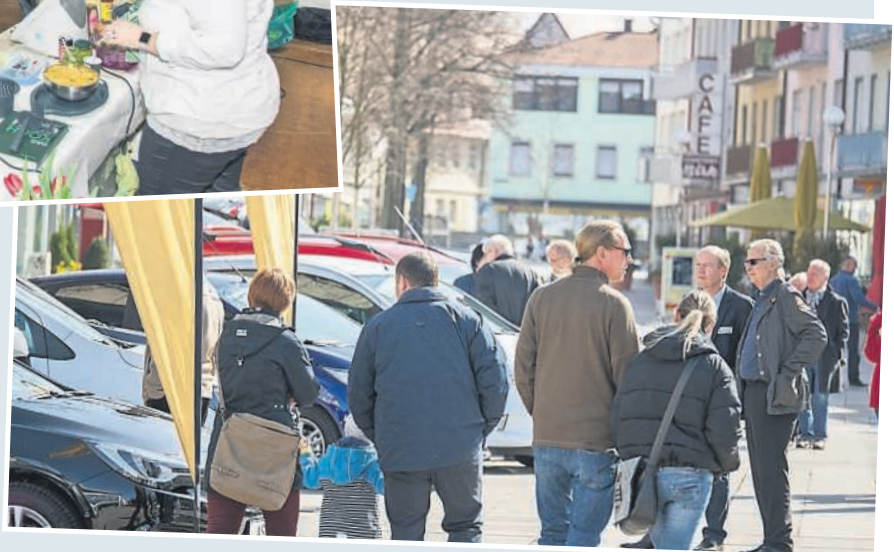
Das herrliche Wetter und die Autoschau in der Fußgängerzone lockten viele Schaulustige ins Freie. Foto: Trinter ▶