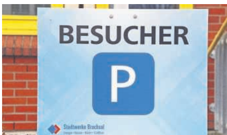
Wer auf einem Besucherparkplatz vor der Stadtwerke-Verwaltung dauerhaft parkt, nimmt billigend in Kauf, dass sein Fahrzeug abgeschleppt wird.

Missbräuchliche Nutzung der Plätze durch Berufspendler wird dadurch eingeschränkt