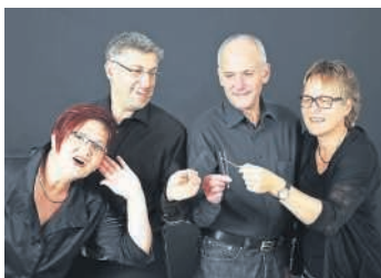
Das A-cappella-Ensemble „Stimm und Gabel“ singt am 2. April im Bruchsaler Schloss

Am Sonntag, 2. April um 11 Uhr / Nur regulärer Schlosseintritt