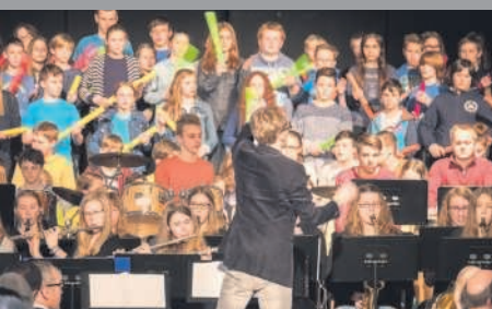
125 Jahre Justus-Knecht-Gymnasium Bruchsal