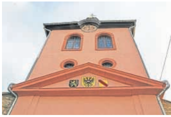
Im historischen Stadttor von Heidecksheim ist das örtliche Heimatmuseum untergebracht