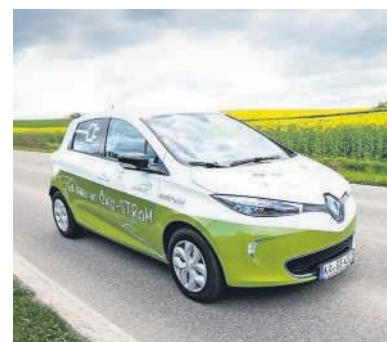
Carsharing-Angebot „zeozweifrei unterwegs“ mit sieben Standorten in Bruchsal vertreten.