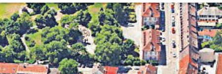
Jetzt anmelden zur lokalen Zukunftswerkstatt