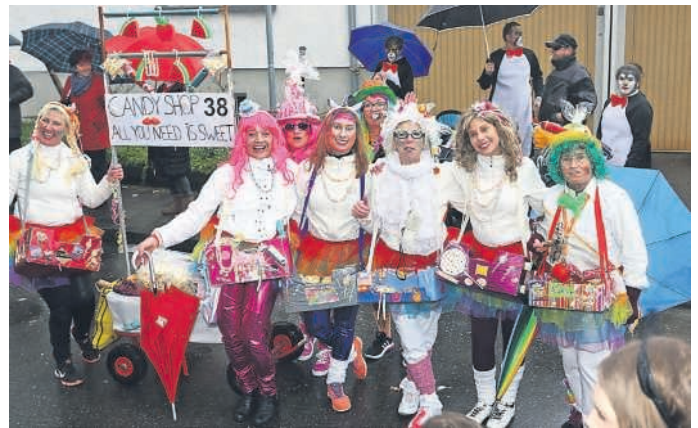
TV-Damen-Gruppe beim Faschingsumzug