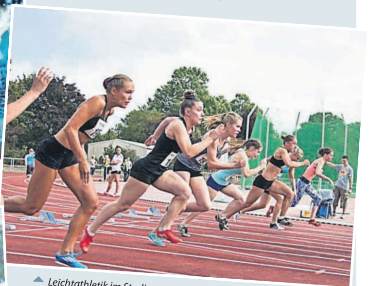
▲ Leichtathletik im Stadion - auf die Plätze, fertig, los.