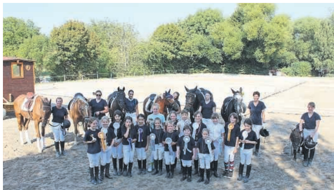
Der erfolgreiche Nachwuchs vom Reiterverein Heidelberg