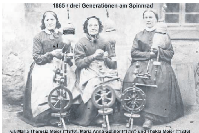
„Spinnen“ am Spinnrad: Das bisher älteste Foto aus Büchenau von 1865 zeigt drei Generationen einer Familie bei dieser Betätigung

Der dreiteilige Beitrag des Arbeitskreises Ortsgeschichte umfasst die Besichtigung und Führung durch die „Heimatkundliche Sammlung“ im Keller der „Alten Schule“ (Gustav-Laforsch-Str. 27), eine öffentliche Führung durch die Pfarrkirche St. Bartholomäus und einen Historischen Ortsrundgang. Die Sammlung im Schulgebäude ist von 14 bis 18 Uhr zugänglich. Wie jüngst dort die Handhabung des nur noch selten praktizierten „Sensendengels“ zur Vorstellung kam, wird es nunmehr etwas als „besondere Aktion“ sein, was mit Sicherheit kaum noch bekannt ist: Das Arbeiten („Spinnen“) am Spinnrad. Diese Handfertigkeit wird zwischen 15 und 17 Uhr von Heidi Hyar-Röpke vorgestellt werden. Um 15 Uhr beginnt auch die Führung durch die Pfarrkirche, der sich um 16 Uhr der Historische Ortsrundgang anschließt (Treffpunkt: vor dem Gotteshaus, Wegstrecke: ca. 1 km, Dauer: etwa 1 Stunde).