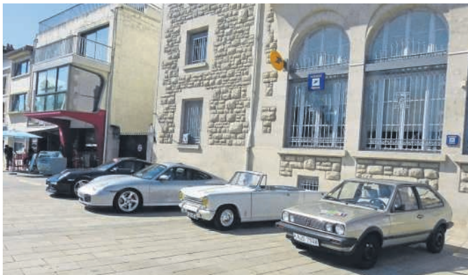
Ein Damenteam im Citroen Mehari Azur