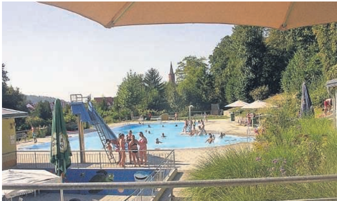
Viele Besucher beim „Abschwimmen“ bei bestem Wetter

Für sie alle haben wir einen kleinen Trost; Schon bald laden wir Sie für den ein- oder anderen Arbeitseinsatz ein. Dafür sind wir Obergrombacher bekannt; wir schaffen es, dass Schaffen Spaß macht! Das verdanken wir der Tatsache, dass wir bei der Arbeit nie vergessen, beispielsweise bei einem zünftigen Vesper, die Gemeinschaft zu pflegen. Im Vorstand des Vereins, geht die Arbeit gemeinsam mit den Stadtwerken Bruchsal, nahtlos weiter. Diese reicht von der Organisation der Arbeiten, die der Verein vertragsgemäß für den Erhalt des Bades ausführt, über Reparaturen, Planung von Sanierung und Erweiterung des Spielbereichs bis hin zur Eröffnung des Bades im nächsten Jahr.