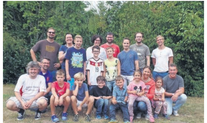
Familientag beim JTB