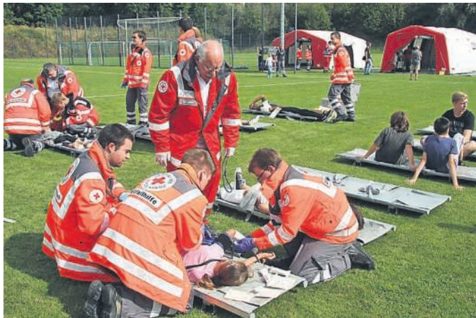
SEG-Großübung in Büchenau

Die Übung lief reibungslos – kleine Fehler wurden von den einzelnen Bereitschaften besprochen, dadurch können die nächsten Einsätze optimiert werden.