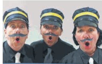
Drei einfallsreiche Museumsführer retten ihren Arbeitsplatz vor einer Blamage

Kinder stehen vor einer Museumstür und freuen sich auf den Besuch. Doch dieses Museum ist nicht gerade in einem guten Zustand. Die Ausstellungsstücke sind wenig präsentabel. Alle gezeigten Tiere sind vielmehr ziemlich ramponiert und daher wenig attraktiv.