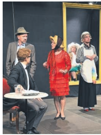
Was hat es mit dem Blutleck auf sich?

Oscar Wildes „Das Gespenst von Canterville“ ist ein wunderbarer Märchenspaß für die ganze Familie, in dem er das klassische „böses Gespenst / guter Zeitgenosse“ einfach auf den Kopf gestellt hat: