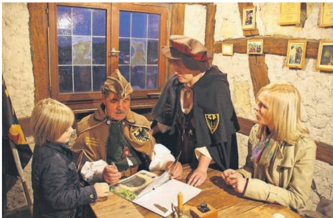
Unterwegs mit Türmer und Jung-Türmerin

Begleiten Sie die beiden Türmer beim Mittelalter-Abenteuer am Sonntag, 25. September 2016 um 14* Uhr. Treffpunkt für die zirka eineinhalbstündige Führung ist der Brunnen am Marktplatz Heidelesheim. Unkosten: drei Euro pro Person.