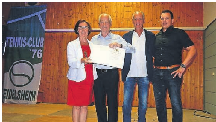
Verleihung der Landesehrennadel