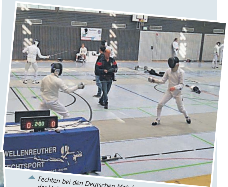
▲ Fechten bei den Deutschen Mehrkampfmeisterschaften in der Mehrzweckhalle in Büchenau.