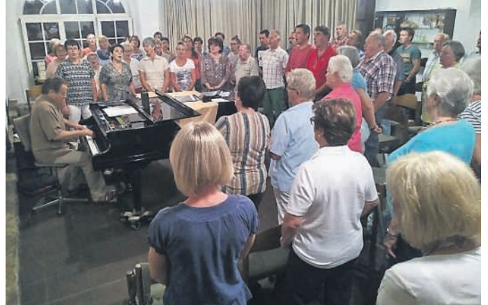
Eine beengte Chorprobe