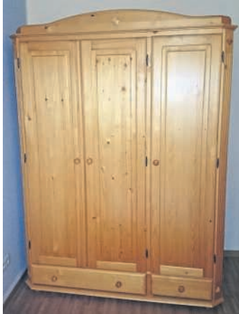
Schmale Kleiderschränke und Kleinmöbel für die Flutopfer in Rumänien dringend benötigt

Wir bitten um gute, gebrauchsfähige Sachspenden die wir direkt zu den Flutopfern nach Bocsa in Rumänien bringen! Dafür werden vor allem gute Kleinmöbel sowie Einzel- und Kinderbetten und kleine Kleiderschränke benötigt. Aber auch gute Fahrräder, Werkzeug, Gartengeräte, Kinderwagen jeder Art, Küchengeräte, Waschmaschinen, Kühl-/Gefrierschränke (nicht älter als 10 Jahre), Tisch-Nähmaschinen, Nähmaschinen und Stoffe, Wolle, Schreib- und Schulsachen, Musikinstrumente, kleine Bau- und Legosteine, kleine Plüschtiere, haltbare Lebensmittel, Toilettenartikel, Windeln, Brillen, Hörgeräte, Handys (simlock-frei!) mit Ladegerät, Laptops, alte CD's und CD-Hüllen, kleine Holz-/Kohle-Öfen.