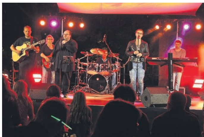
Buntes Programm beim Kinder- und Jugendtag am 17. September im Bruchsaler Bürgerpark.