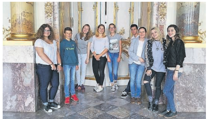
Im Bruchsaler Schloss