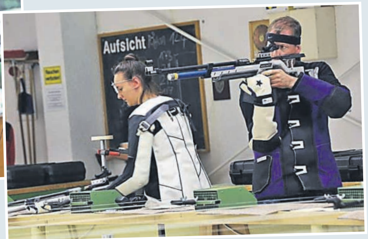
▲ Schießen beim KKS Heidelberg - die Mitte der Scheibe im Visier.