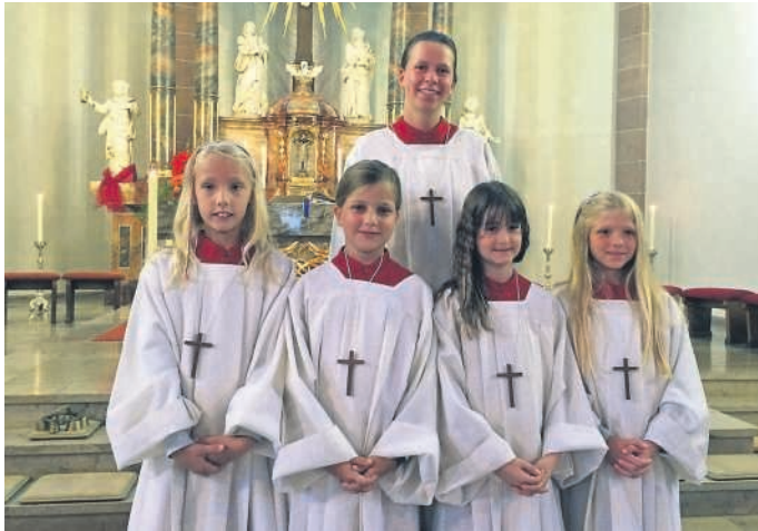
Miniaufnahme und Verabschiedung