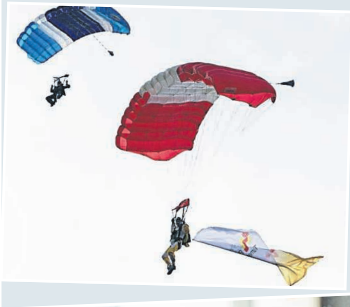
◀ Eröffnung der Deutschen Mehrkampfmeisterschaften 2016 in Bruchsal - Grüße von ganz oben.