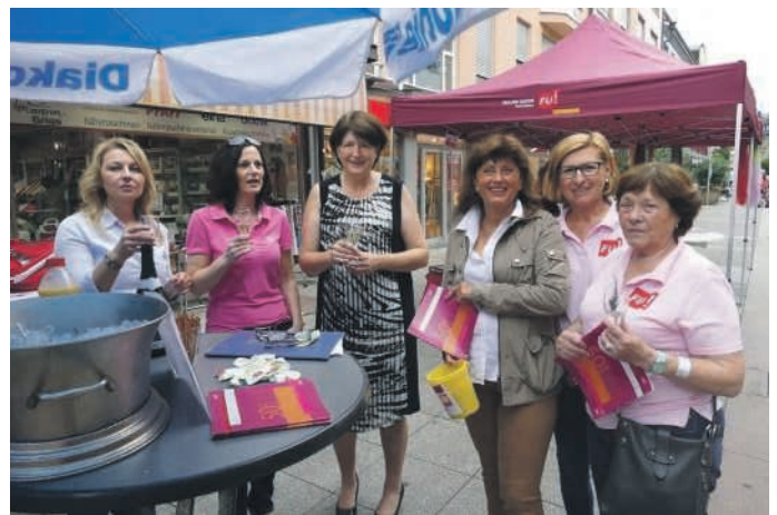
30 Jahre Trödelmarkt der Frauenunion im nördlichen Landkreis Karlsruhe