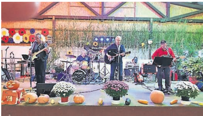
Die „Riff-Band“ beim Mostfest 2015