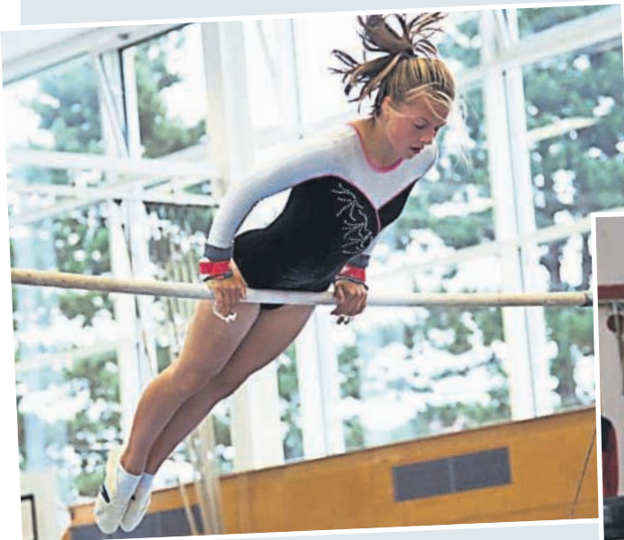
▲ Turnen in der Sporthalle - volle Konzentration bei einer schwierigen Übung.