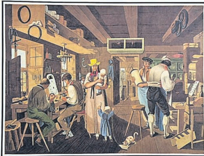
„Uhrenmachen in d. Neustadt“, Christian Meichelt um 1823. Einblick in die Arbeitssituation der Flötenuhrenbauer

Führung über Kinder- und Frauenarbeit im Heimgewerbe am Anfang der Musikautomatenproduktion