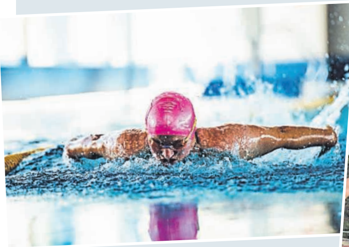
▲ Schwimmen im Hallenbad - volle Kraft voraus.