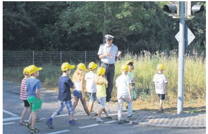
Übung an der Ampel

Straßenverkehr. Und unmittelbar vor dem Schulbeginn übt sie in ihrer Jugendverkehrsschule gemeinsam mit dem Polizeipräsidium Karlsruhe mit den Schulanfängern das sichere Verhalten bei der Bewältigung des Schulweges. Dies ist deshalb von besonderer Wichtigkeit, weil Kinder in diesem Alter noch nicht in der Lage sind, die besonderen Gefahren des Straßenverkehrs richtig einzuschätzen und darauf zu reagieren. Diese Fähigkeiten erwerben sie erst nach und nach durch fleißiges Üben. Eher Kontraproduktiv sind dabei die „Elterntaxis“, die auf dem Schulweg selbst Verkehrsgefährden darstellen und verhindern, dass die transportierten Kinder den sicheren Umgang mit dem Straßenverkehr erlernen. Als förderlich erwiesen hat sich der sog. BaB, der „Bus auf Beinen“, bei dem sich benachbarte Kinder zusammenschließen und in Begleitung eines Erwachsenen gemeinsam zu Fuß den Schulweg zurücklegen.