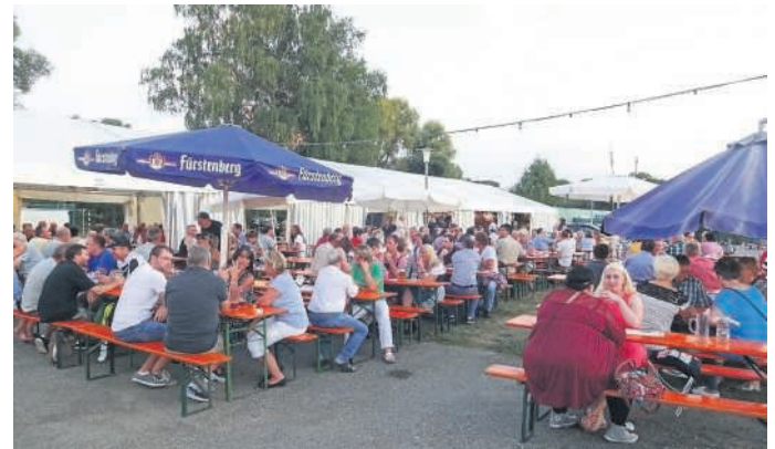
Draußen sitzt es sich am schönsten