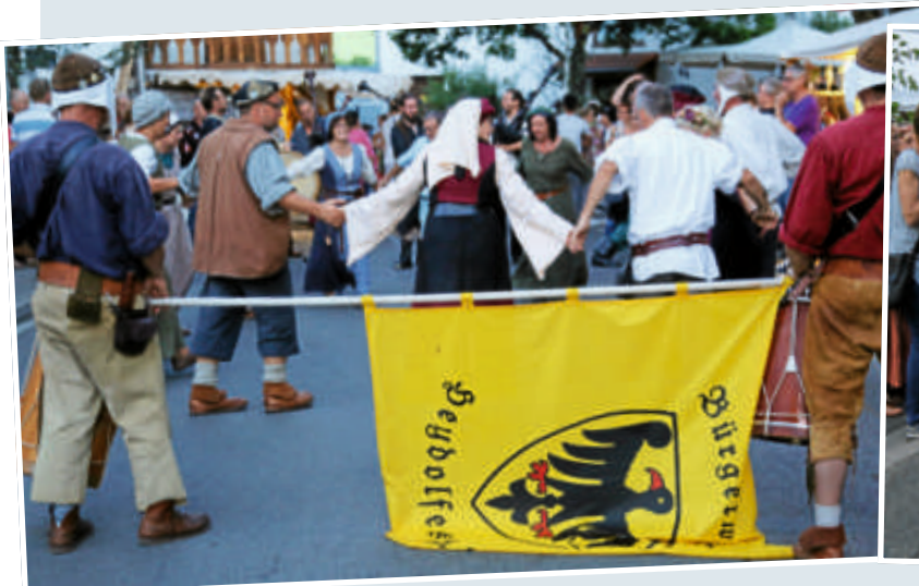
▲ Altertümliche Tänze auf dem Festgelände, Modenschau sowie Fahenschwinger- und Fanfarenumzüge sorgten für ein abwechslungsreiches Programm.