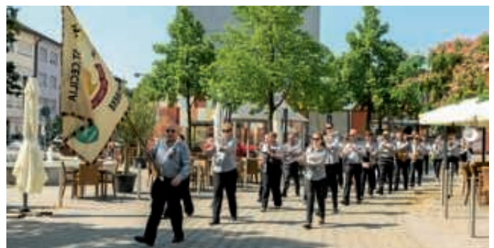
Straßenkonzerte des belgischen Orchesters „Koninklijke Fanfare Sint-Cecilia Kruikebe“