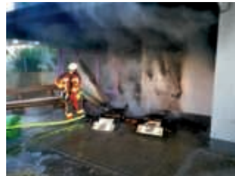
Durch das schnelle Eingreifen konnte schlimmeres verhindert werden