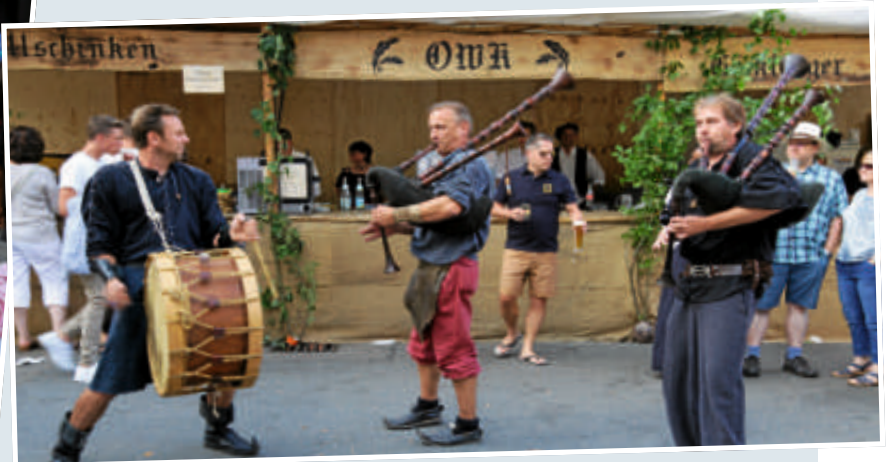
▲ Mittelalterliche Klänge wehten durch die Gassen der Altstadt.