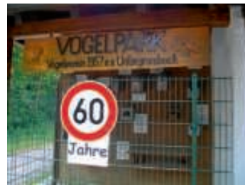
Jede/r ist willkommen

Anlässlich unseres 60-jährigen Vereinsjubiläums veranstaltet der Vogelschutz- und Zuchtverein Untergrombach e.V. am Sonntag, den 23. Juli 2017 ein Parkfest im Vogelpark Untergrombach, Am Brunnenbach 1 neben der Talschänke. Hierzu laden wir die gesamte Bevölkerung recht herzlich ein.