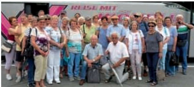
Reisegruppe MSC Bruchsal am Millstätter See