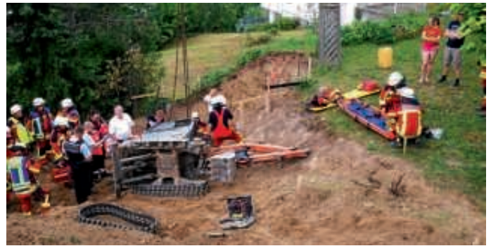
Beim Eintreffen der Feuerwehr war der Mann glücklicherweise nicht mehr eingeklemmt

Abstrachen getroffen und Strategien überlegt werden. Nach heftigen Diskussionen und etlichen Fehlschlägen wurde auch diese Aufgabe schließlich bewältigt. Nach einer Pause ging es dann im zweiten Teil endlich an das heiß ersehnte Klettern. Mit Helmen und Gurten ausgestattet und gut gesichert durch mehrere Klassenkameraden durften die Kinder an einem Kletterturm so weit nach oben klettern, wie sie sich trauten. Vom Boden sah das allerdings viel einfacher aus! Zum Abschluss ging es dann hoch in die Bäume. Einige Schüler balancierten ca. 6 Meter über dem Boden über einen Holzstamm, andere liefen lieber über eine Wackelbrücke. Wer sich traute, durfte dann mit einem gezielt abgefangenen Sprung in die Tiefe stürzen. In der Abschlussrunde wurde reflektiert, wie wichtig Zuhören, Rücksichtnahme, Aufeinanderzugehen und sich Zurücknehmen für eine funktionierende Klassengemeinschaft ist. Die Schüler haben diesen Ausflug mit so viel Freude und Bewegungsdrang begangen, jeder Schüler hat etliche Herausforderungen erlebt und ist mit vielen persönlichen Erfahrungen und Erlebnissen nach Hause gegangen – es war ein wunderschöner Vormittag! A BA