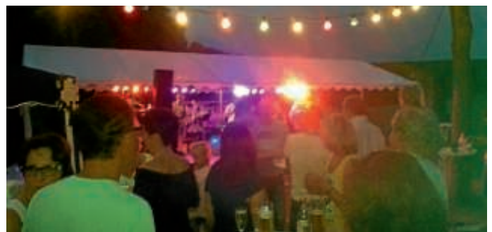
Rock am Court