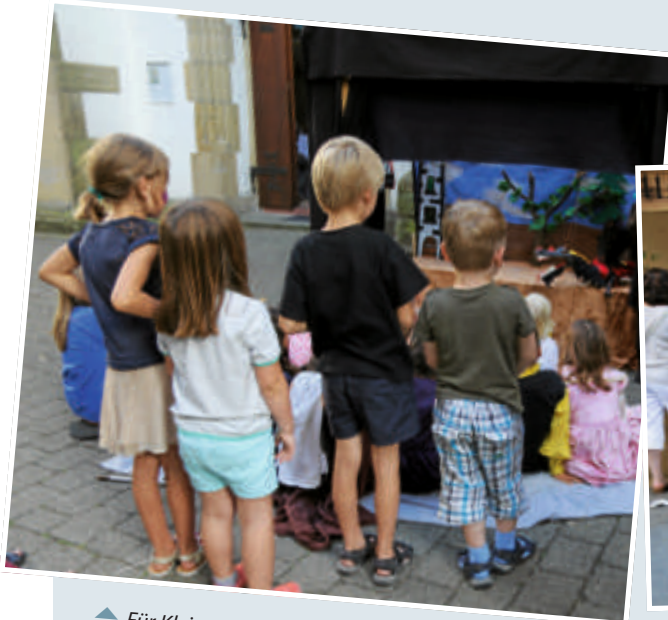
▲ Für Klein und Groß war bestens für Unterhaltung an allen Ecken gesorgt.