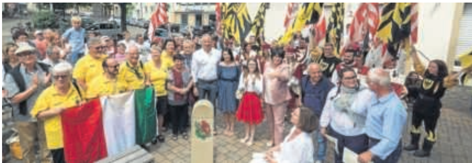
Bei der feierlichen Enthüllung des Partnerschaftssteins mit allen Mitwirkenden.