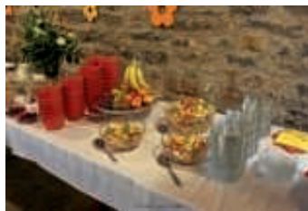
BKG Frühstück

Infos zur Anmeldung erfährt Ihr nächste Woche. Wir freuen uns auf euren Besuch.