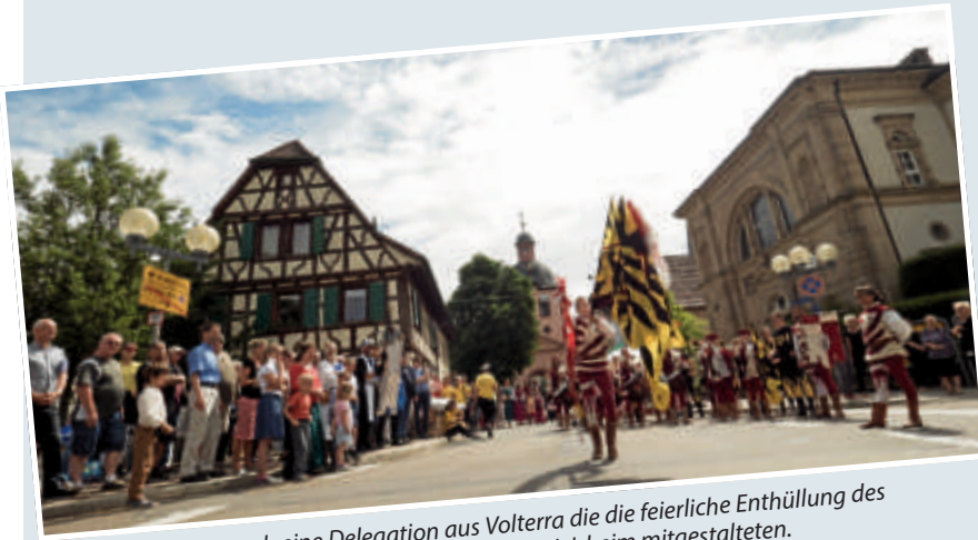
▲ Zu Besuch eine Delegation aus Volterra die die feierliche Enthüllung des Partnerschaftssteins von Volterra-Heildesheim mitgestalteten.