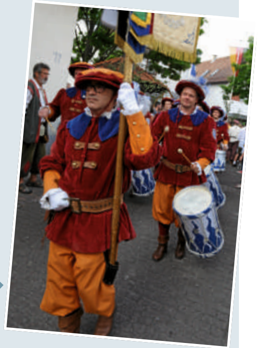
▶ Der Fanfarenzug Bruchsal und weitere Gruppen marschierten unter Jubelrufen beim Festumzug vom Stadttor zum Kirchplatz.