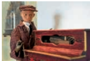
„Miniaturausgabe eines spanischen Straßenklaviers mit Androiden“

Ein literarischer Museumsrundgang "Glauben Sie wirklich, dass eine Maschine denkt?"