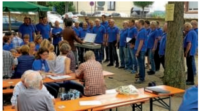
Der Sängerbund auf dem Festplatz Belvedere