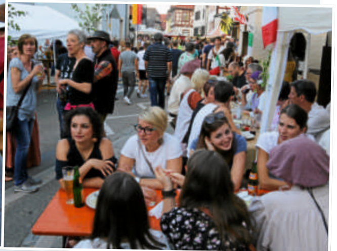
▲ Zahlreiche Besucher aus nah und fern genossen das Fest im historischen Heildesheimer Stadtkern.