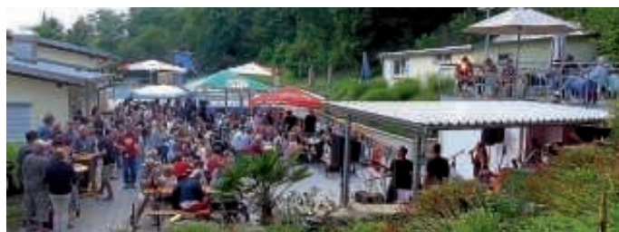
Tolle Atmosphäre bei Moondance"live" am vergangenen Freitag