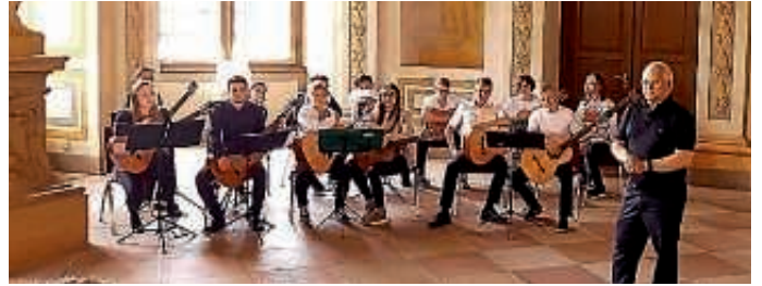
Ensemble Junge Gitarristen