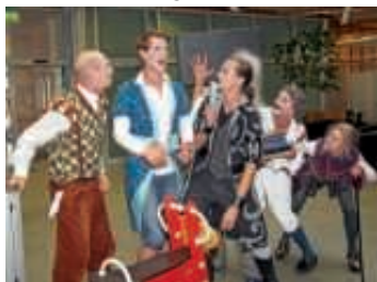
Szenen aus „Der Widerspenstigen Zähmung“