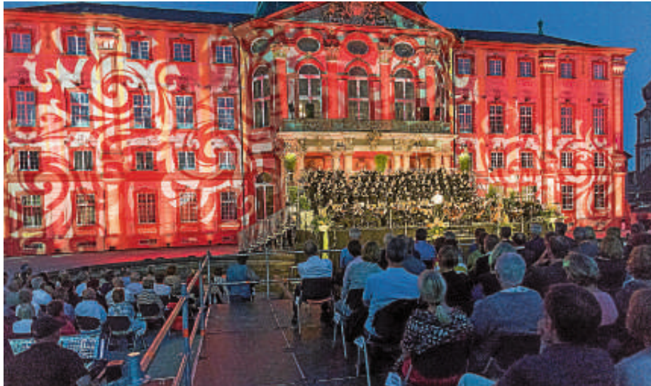
Werke von Beethoven erklingen beim Bruchsaler Klassik Open Air vor der barocken und illuminierten Fassade des fürstbischöflichen Residenzschlosses.