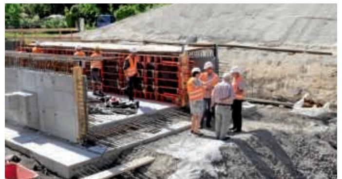
Der Megakanal mit 350 Tonnen Eigengewicht (fotografiert bei einem Vor-Ort-Termin im Juni) wird bald in seine Endlage verbracht und leistet dann auch einen Beitrag zum Hochwasserschutz.

Bruchsal (pa) | Im Auftrag der Stadt Bruchsal laufen seit Anfang dieses Jahres die Arbeiten zur Herstellung der Entlastungsanlage Schattengraben – Eisenbahnüberführung Holzindustrie auf Hochtouren. Im Rahmen dieser Maßnahme wurde in der Örtlichkeit ein Beton-Rechteckprofil (ein Megakanal mit den Maßen 20x6x2 Meter) für eine getrennte Ableitung der Abflüsse des Schattengrabens und der Siedlungsentwässerung im Bereich der DB-Strecke Bruchsal-Karlsruhe errichtet und stellt zukünftig als neuer Gewässerdurchlass eine Eisenbahnüberführung (EÜ) dar. Das bereits vorgefertigte EÜ-Bauteil wird während einer Streckenvollsperrung der Deutschen Bahn, die im Rahmen von Gleisbauarbeiten lange geplant war, in den Gleisbereich eingeschoben. Hierfür steht der von der Stadt Bruchsal beauftragten Firma Grötz aus Gaggenau das erforderliche Baufeld nur im Zeitraum vom 27. Juli – 4.30 Uhr bis 30. Juli 2017 – 7 Uhr zur Verfügung. Der geplante Einschub des rund 350 Tonnen schweren Baukörpers ist für den 28. Juli gegen 13 Uhr vorgesehen und benötigt eine Zeit von etwa sechs Stunden bis zur Endlage. Aufgrund dieses begrenzten Zeitfensters ist die Maßnahme generalstabsmäßig geplant. Ersatzfahrzeuge und Ersatzgerät stehen zur Verfügung, weil die Arbeiten zwingend im angegebenen Zeitfenster erledigt werden müssen.