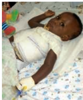
Der erste Verband bei Brunel musste unter Narkose erneuert werden.