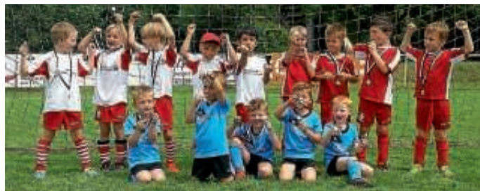
Bambinis des FCO