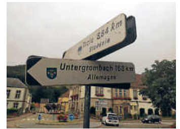
Ein Wegweiser in unserer Partnergemeinde

Wir freuen uns über eine rege Beteiligung! Bis bald!