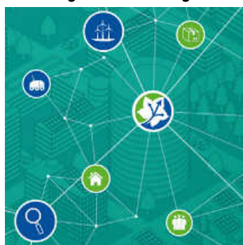
Schematische Darstellung für Nachhaltigkeit

Die efeuCampus Bruchsal GmbH informiert regelmäßig über Neuigkeiten aus dem Gesamtprojekt. Sie erfahren etwas über seine Partner, zukünftige Veranstaltungen und was es sonst Neues gibt. Mit dem Projekt haben die Stadt Bruchsal, die efeuCampus Bruchsal GmbH und das Konsortium mit der SEW-Eurodrive, der big. bechtoldgruppe, dem FZI Forschungszentrum Informatik, der Hochschule Karlsruhe, dem Karlsruher Institut für Technologie (KIT) und der PTV Group eine Idee entwickelt, wie sich Gütermobilität zukünftig im städtischen Raum emissionsfrei, generationengerecht und wirtschaftlich tragfähig gestalten lässt.