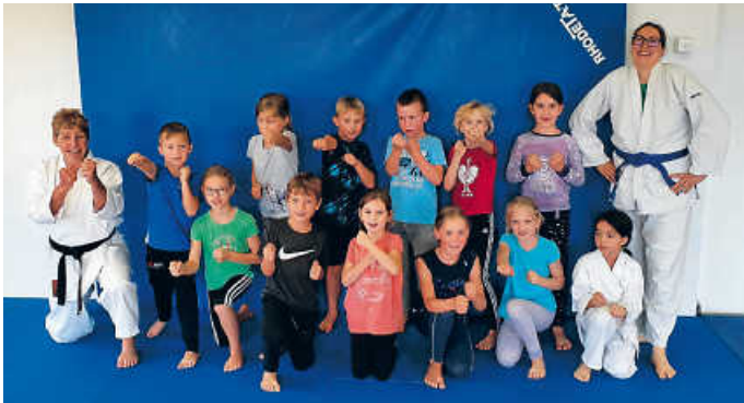
Teilnehmende des Ferienprogramms

ligen Sportart und natürlich Spiele, alles wurde gemeistert. Bei so viel sportlichem Einsatz der Kinder ging die Zeit wie im Flug vorbei. Wir bedanken uns bei unseren Trainern/-innen für ihren Einsatz beim Ferienprogramm.