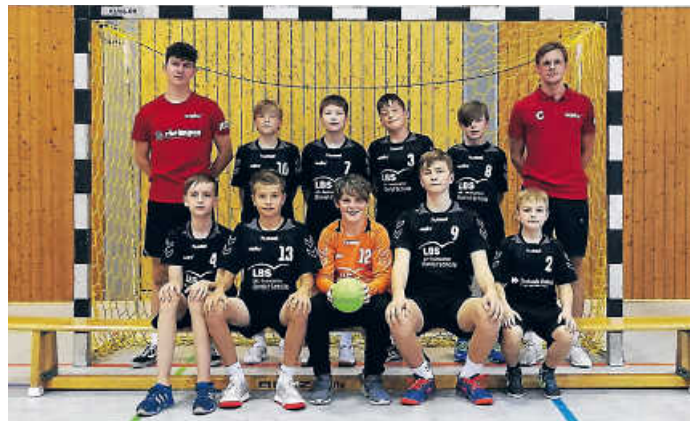
Die männliche D-Jugend der SGHHG

mD-Jugend: Sieben Mannschaften kamen zusammen und spielten um die besten Plätze. Darunter auch unsere D-Jugend. Mit nur acht Spielern traten wir der SG Pforzheim-Eutingen, HSG Dudenhofen-Schifferstadt, TSV Rintheim und anderen Mannschaften entgegen und lieferten tolle und manchmal auch knappe Spiele. Am Ende erlangte unsere D-Jugend den dritten Platz und konnte mit guten Ansätzen für die kommende Saison die Halle verlassen.