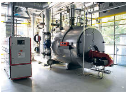
BHKW und Gas-Spitzenlastkessel in der Heizzentrale des GBZ

Grußworte wurde eine filmische Dokumentation über das Fernwärmeprojekt gezeigt. Gleich darauf fand die Vertragsunterzeichnung seitens der Kooperationspartner statt. Zur Feier dieses historischen Moments für den Klimaschutz kredenzte ein lokaler Catering-Service den Gästen Säfte, Sekt und Selters sowie kleine, aber feine Gaumenfreuden. Parallel hierzu gab es ausreichend Gelegenheit für geführte Besichtigungen der Heizzentrale, Interviews sowie Gespräche der Gäste untereinander.