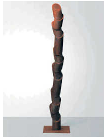
Rundsäule 1, 2021, WV 548

So ist bspw. die häufig zu beobachtende Vertikalität seiner Werke nicht nur der formgewordene Ausdruck einer vertikalen Spannung zwischen Unten und Oben, sondern symbolisiert im übertragenen Sinne gleichzeitig eine vom Künstler postulierte Haltung des Aufrechten und der Aufrichtigkeit.