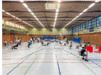
Blutspende in der Bundschuhhalle

Viel Platz für Abstand und Hygienesicherheit bietet die Bundschuhhalle für unsere Blutspendeaktion in Pandemiezeiten. Die Online-Terminvergabe stellt zudem sicher, dass die Spendewilligen sich gleichmäßig über den Spendenzeitraum verteilen. Dies verhindert längere Wartezeiten bei den einzelnen Stationen und gewährleistet eine zügige Abwicklung der Blutspende. So ging unsere Blutspendeaktion am vergangenen Mittwoch trotz der Zahl von insgesamt 133 Spendewilligen ruhig und sicher über die Bühne. Bei nur fünf Rückstellungen konnten 128 Blutkonserven gewonnen werden. Erfreulich war die Zahl von zwölf Erstspenderinnen und -spendern. Nach wie vor kann es keine Verpflegung vor Ort geben. Alternativ gab es für alle Spender/innen Maultaschen „to go“ in der Lunchtüte. Das DRK Untergrombach bedankt sich bei allen Spenderinnen und Spender für ihr Kommen und ihr Blut, dem DRK Blutspendeteam und natürlich bei unseren Helferinnen und Helfern. (wom)