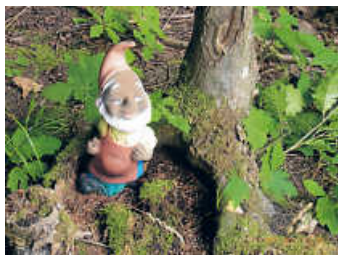
Besuch im Zwergenwald

Der Kneipp-Verein Bruchsal e.V. lädt ein zur Mittwochswanderung im Oktober .