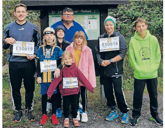
Teilnehmer am Weltrekordversuch

Bitte kommen Sie rechtzeitig, um lange Warteschlangen bei der Einlasskontrolle und Dokumentation zu vermeiden. Den Vorkampf bestreiten die Schüler um 18.30 Uhr.