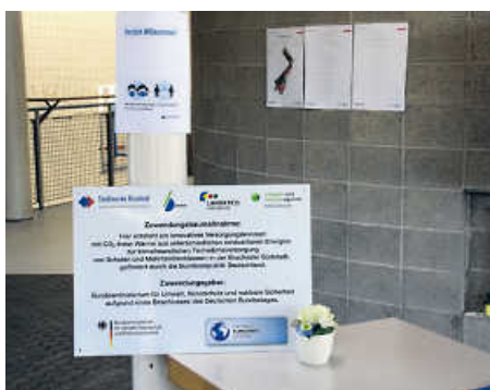
Innovatives Versorgungskonzept mit illustren Partnern und Förderern

fast vollständig regenerativen Wärmeversorgung des Quartiers Bruchsal Südstadt. Das Projekt „zeozweifrei im Quartier“ hat eine thermische Verbindung vom GBZ, also den Balthasar-Neumann-Schulen I und II, über die Konrad-Adenauer-Schule bis zum Neubau des Seniorenzentrums St. Anton der Caritas Bruchsal hergestellt. Mit einbezogen wurden Mehrfamilien- und Einfamilienhäuser entlang der Trasse. Das Besondere daran: Im Winter versorgen eine Holzhackschnitzelanlage, bei der regionales Holz eingebracht wird, eine Pelletanlage und ein Gas-Spitzenlastkessel die Abnehmer, in den Sommermonaten stellen vorwiegend ein mit Biomethan betriebenes Blockheizkraftwerk (BHKW) und eine Freiflächen-Solarthermieanlage die Wärme für die Warmwasserbereitung sicher. Bis Ende September, pünktlich zum Beginn der Heizperiode, sollen nach der technischen Abnahme alle Komponenten in Betrieb gegangen sein. Das innovative Wärmeversorgungskonzept mit dem optimierten Einsatz unterschiedlicher erneuerbarer Energien je nach Jahreszeit, Bedarf und lokalen Gegebenheiten ergibt zusammen mit den Schulen und dem Seniorenzentrum als sogenannten Ankernutzern und dem Einsatz von regionalem Holz eine zukunftsfähige wie bürgerfreundliche Wärmeversorgung. Damit wird ein weiterer Baustein der städtischen Klimaschutzbemühungen konkret umgesetzt und die Energiewende für die Bürger vor Ort erfahrbar. Infos gibt es unter https://www.fernwaerme-suedstadt.stadtwerke-bruchsal.de auf der Projekt-Homepage. Artikel und Fotos: SWB|tw