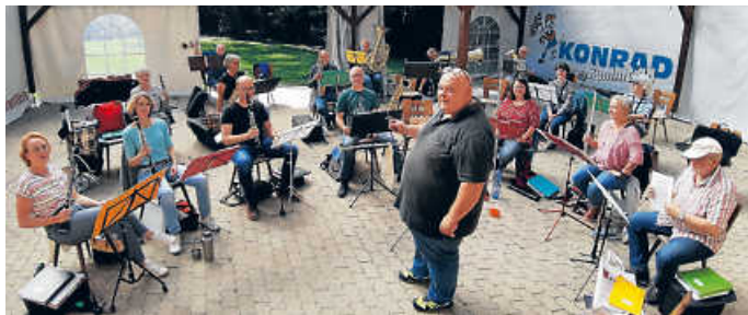
Die Proben haben begonnen