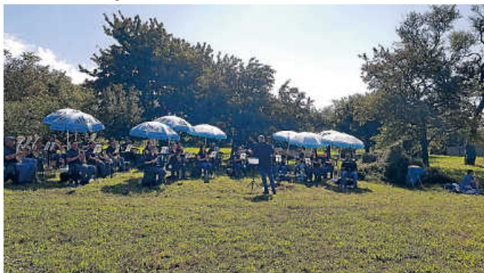
33. Weingartener Weinwandertag