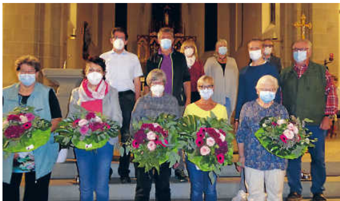
Ehrungen für langjähriges Singen im Kirchenchor