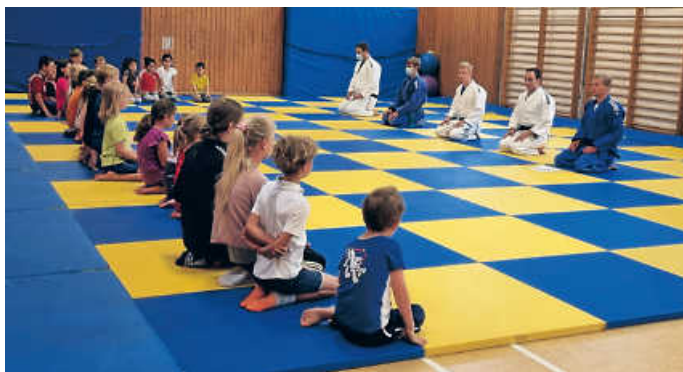
Gemeinsamer Ausflug in die Welt des Judosports