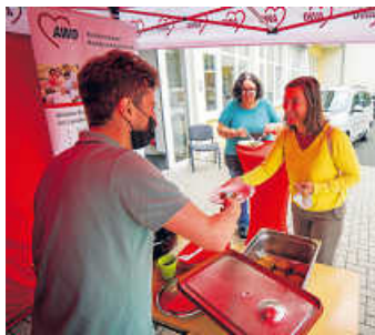
Beim Essen für alle wünscht die AWO guten Appetit