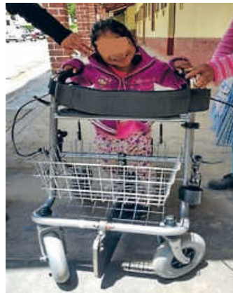
Bolivien: Schwache Kinder freuen sich über die neu gewonnene Mobilität

Allerdings ist dies alles – trotz viel ehrenamtlichen Einsatzes - nicht zum Nulltarif möglich, denn dieses wichtige Hilfsprojekt verursacht monatliche Kosten von 7.000 Euro. Und dieser Betrag ist vollständig durch Spenden zu finanzieren! Dabei trägt dankenswerterweise unser Entwicklungshilfe-Ministerium noch 80 % der Frachtkosten. So ist uns diese Hilfe „Sorgenkind“, aber zugleich auch Herzensangelegenheit! Denn es gibt (leider) Menschen auf dieser Welt, für die ein