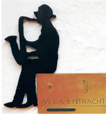
Einer der neuen Mitspieler im Probenraum