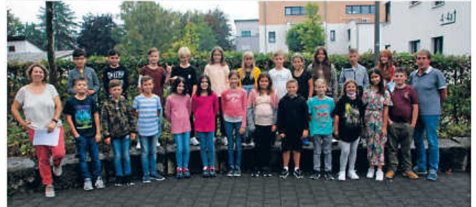
Klassen 5a (oben) und 5b (unten) mit ihren Klassenlehrer/-innen