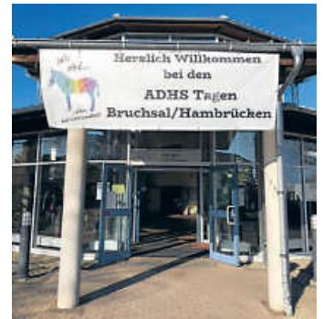
Die Online-Anmeldung für die 4. ADHS-Tage ist bis zum 29. September möglich

„ADHS über die Lebensspanne“ sind die 4. ADHS-Tage am 9. und 10. Oktober in Hambrücken überschrieben, veranstaltet durch die Landesgruppe BW des ADHS Deutschland e.V. Der Titel reflektiert, was in den letzten Jahren immer mehr ins Bewusstsein von Betroffenen und Fachleuten rückte: Die ADHS ist keine Eigentümlichkeit kindlichen Verhaltens. Sie ist jedoch auch keine Kinderkrankheit, eine Störung von Emotionen und Verhalten, die nur im Kindesalter auftritt, sondern auch bis ins hohe Alter die Problematik bleibt.