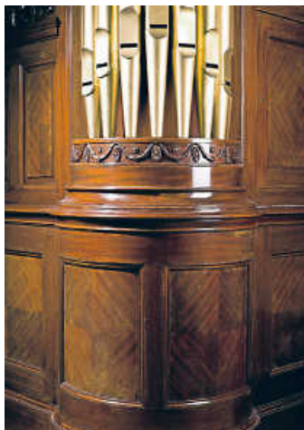
Seitliche Prospektpfeifen und Gehäuse, Philharmonie-Orgel Modell II, M. Welte & Söhne, Freiburg 1911/12