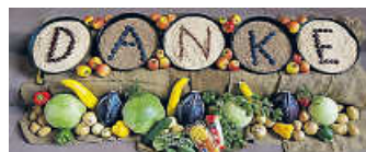
Erntedankfest 2021

10 Uhr Erntedank-Gottesdienst , Ev. Kirche Staffort, mit Pfr. Müller