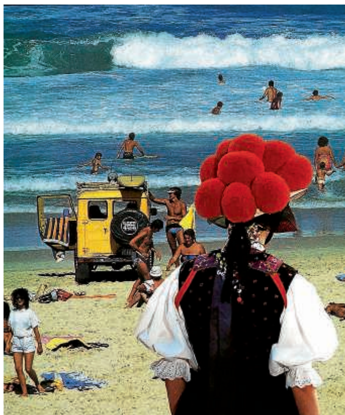
Bollenhut-Frau überblickt Surferparadies

Nachdem die Künstlerin im Januar von Sydney nach Bruchsal gezogen ist, beschreiben ihre neuen Kunstwerke ihre Erfahrung als Ausländerin in einem neuen Land. Helmore verwendet vorgefundene Bilder aus alten Fotobüchern als Grundlage für ihre Kunstwerke, zeichnet darauf und erstellt daraus Collagen.