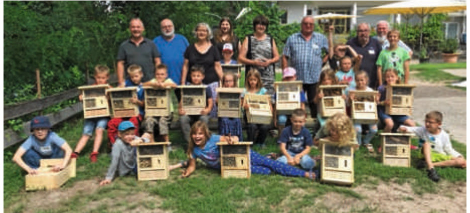
Die Gruppenbilder mit der Oberbürgermeisterin geben nur einen kleinen Einblick in die Vielfalt des Bruchsaler Kinderferienprogrammes

Proportional mit der Zahl der Anmeldungen ist auch die Zahl der Veranstaltungen gestiegen, die in diesem Jahr bei 193 liegt. Dabei reicht das Spektrum vom Tierheimbesuch über zahlreiche Kreativworkshops bis hin zu Sportbootfahren auf dem Rhein und einem Kegeltturnier. „Es findet sich nicht nur für