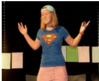
DS-Aufführung am HBG

Kurz vor den Sommerferien besuchten Eltern, Verwandte und interessierte Schüler/-innen das Theaterstück „Märchenprominenz packt aus“ (von Isabell Späth) der Klasse 7d. Das Stück handelte von zwei Redaktionen, die um den Titel „Beste Schülerzeitung“ konkurrieren. Dem „Schülerexpress“ kam die Idee, Märchenfiguren zu interviewen. Da die „Children Times“ keine eigenen Ideen hatten, versuchten sie, durch Betrug und Einbruch in eine fremde Redaktion zu gewinnen.