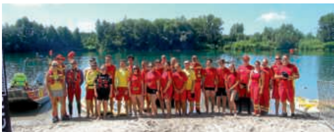
Die DLRG-Einsatzkräfte beim Summertime Triathlon