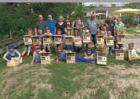
Ferienzeit in Bruchsal