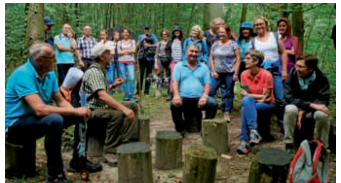
Lustiges und Lehrreiches von Förster Durst für G'sang for fun