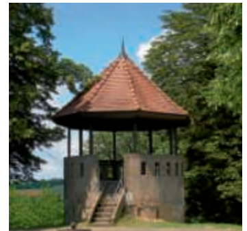
Der Kneipp-Verein wandert

Info: Tel. (07251) 35 82 50 oder mail: mittwochswanderung@t-online.de R-U.O