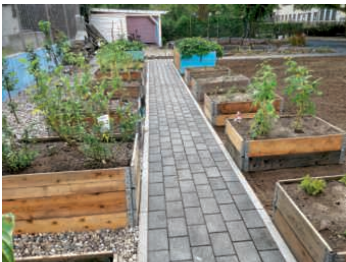
Neue Hochbeete für die Pestalozzischeule