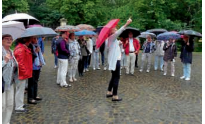
Erläuterungen zum Rüschaus