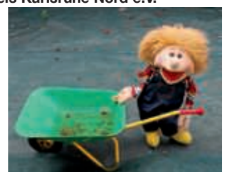
Der Tageselternverein bietet Qualifizierungskurse

...kinderfreundliche Wohnung, ein entsprechendes Haus oder auch geeignete Büroräume in der Bruchsaler Kernstadt und in Büchenau für die Kindertagespflege in anderen geeigneten Räumen (TigeR)