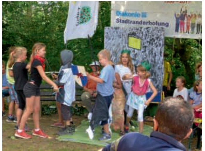
Edle Ritter kämpfen für anmutige Prinzessinnen gegen böse Räuber

Zum Elternnachmittag hatten die Kinder Vorführungen vorbereitet rund um das Thema „Märchen“ mit einer selbstinszenierten Ritter-Saga, mit Lagerliedern, Märchenquiz, Märchen-Pantomime, dem Spiel vom „Wolf und den sieben Geißlein“ sowie mit einer dramatischen Darstellung von Schneewittchens Tod und Aufweckung.