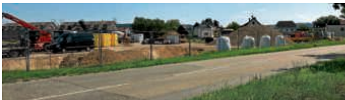
Der Beginn der Hochbauarbeiten in Büchenau geht mit Straßensperrungen einher

Es tut sich etwas am Ortseingang von Büchenau. Die Baustelle ist eingerichtet, die ersten Tiefbauarbeiten sind abgeschlossen, jetzt geht es richtig los: Am kommenden Montag beginnen die Hochbauarbeiten für den neuen Penny. Anschließend werden die Straßen- und Kanalarbeiten ausgeführt. Damit verbunden sind im Oktober dann auch Straßensperrungen. Über deren genaue Termine folgen zeitnah Informationen.