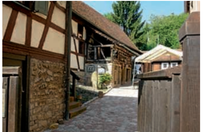
Herzlich willkommen beim TKV Bundschuh

Lassen Sie sich überraschen und feiern Sie mit uns – wir freuen uns auf Sie .