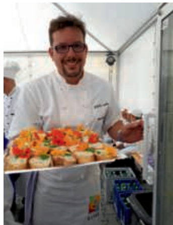
Beim Empfang der Bundesministerin Julia Klöckner

Mitmachen !!!... Mitmachen !!!... und fürs Leben lernen! Köche für die zweite Gruppe Miniköche dringend gesucht!