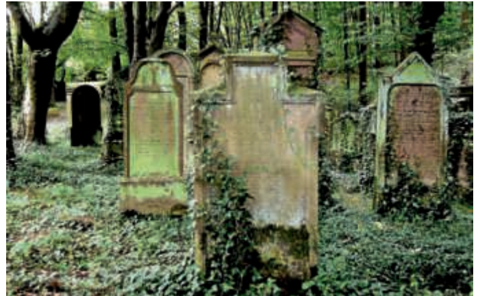
Tag der jüdischen Kultur

2004 beteiligt sich auch die Stadt Bruchsal daran und stellt dabei den eindrucksvollen jüdischen Friedhof auf dem Eichelberg in den Mittelpunkt. Dieser wurde mitten im Dreißigjährigen Krieg angelegt, umfasst heute nach mehreren Ausbaustufen eine Ausdehnung von rund zwei Hektar und besitzt als bedeutendes Kulturdenkmal regionale Bekanntheit. Den schlimmsten Einschnitt erlebte der Friedhof während der NS-Diktatur, als viele Gräber geschändet und ihrer Steine beraubt wurden. Nicht zuletzt durch die Bemühungen der Stadt Bruchsal ist jedoch längst wieder ein würdiger Zustand hergestellt. Zu der Anlage zählt auch eine Gedenkstätte, in die eine Säule der vor 75 Jahren – während der Pogromnacht vom November 1938 – zerstörten Bruchsaler Synagoge integriert wurde.