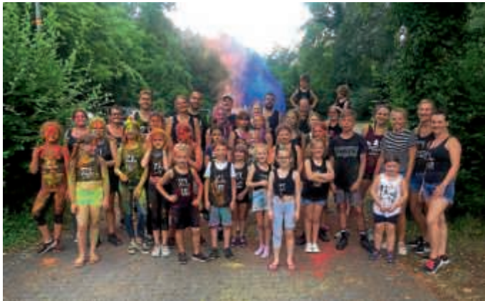
Die bunten Teilnehmer des GroKaGe-Zeltlagers