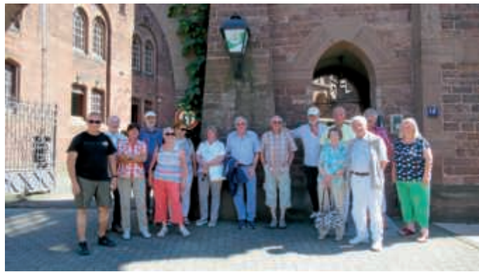
Die Ausflügler des Automobilclubs hatten viel Spaß bei der Brauereibesichtigung