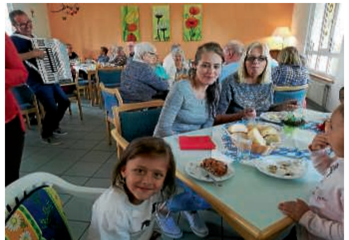
Sommerfest im AWO-Haus Silbertal