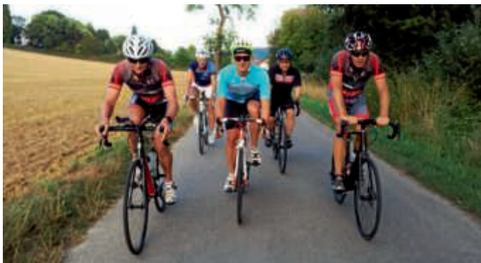
Trainingsgruppe Radsport-Team Kraichgau