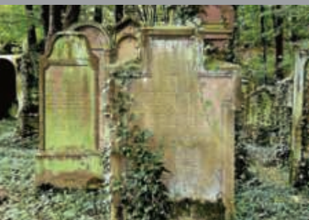
Tag der jüdischen Kultur