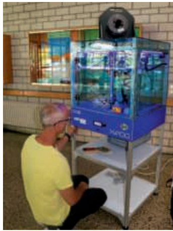
An der BNS1 konnten Schüler/-innen u.a. einen 3D-Drucker bestaunen

So wird das Angebot nicht mehr auf eine bestimmte Schule zugeschnitten, sondern es werden Schulen ausgewählt, die dann von Schülerinnen und Schülern der Umgebung besucht werden. Die Balthasar-Neumann-Schule 1 (BNS 1) bietet sich hierfür an: zentral gelegen, mit eigenem Stadtbahnanschluss ausgestattet und mit der nötigen Raumkapazität, da spätestens Anfang Juli zahlreiche Abschlussklassen bereits ihre Zeugnisse erhalten haben. Ein weiteres Plus ist die Vielzahl der Ausbildungsberufe (Heizung, Mechatroniker, Schreiner, Maler, Lackierer, Metallbauer und Augenoptiker), die von den technischen Lehrern an diesem Tag den Klassen vorgestellt wurden – zusätzlich zu den von der IHK präsentierten Firmen. Zudem besteht für diejenigen, die einen mittleren Bildungsabschluss erworben haben, die Möglichkeit, am Technischen Gymnasium (TG) die allgemeine Hochschulreife zu erwerben. Und dass man hier auf dem neuesten Stand der Technik ist, bewies der zu Demonstrationszwecken aufgebaute 3-D-Drucker, der künftig im Profil „Gestaltung und Medientechnik“ zum Einsatz kommen wird.