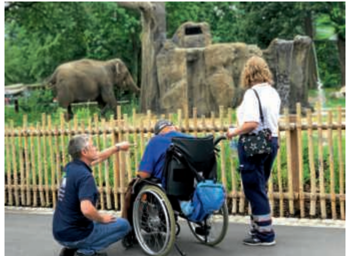
Ausflug mit dem „Herzenswunsch-Krankwagen“ in den Karlsruher Zoo

Noch einmal den Karlsruher Zoo besuchen – Das wünschte sich ein Patient des Caritas-Seniorenhauses St. Elisabeth in Karlsdorf. Das Projekt „Herzenswunsch-Krankwagen“ der Malteser Bruchsal ist dafür da, um Menschen in ihrer letzten Lebensphase unerfüllte Wünsche wahr werden zu lassen. Durch die Zusammenarbeit mit den Maltesern, der Caritas Bruchsal und dem Ökumenischen Hospiz-Dienst konnte eine Herzenswunsch-Krankwagenfahrt in den Zoologischen Stadtgarten Karlsruhe organisiert werden.