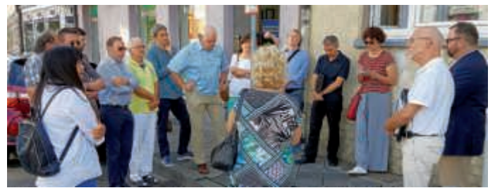
Diskussion um die zukünftige Nutzung des Synagogengeländes