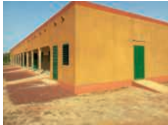
Die Grund- und Realschule Zoundri dient als Muster für die vier neuen Berufsschulgebäude

Am Lebenshilfe-Stand konnten sich kleine und auch größere Besucher Preise in Form von Süßem, aber auch Bundstifte, Luftballons oder Dekoratives, wie lustige Gemüse-Magnete, abholen. Laut Veranstalter waren die Mitmach-Aktionen der Lebenshilfe Bruchsal-Bretten e. V. ein Highlight des Kindersportfests.