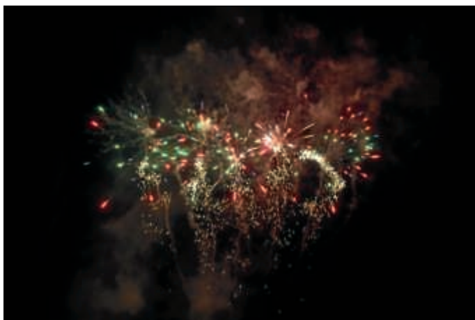
Feuerwerk am Nationalfeiertag