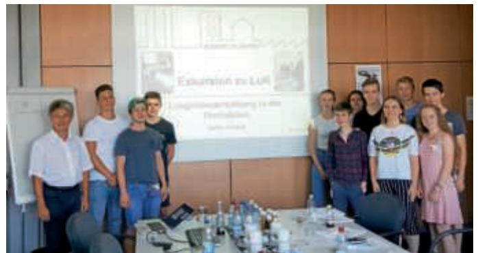
Vertiefungskurs Mathematik des Schönborn-Gymnasiums