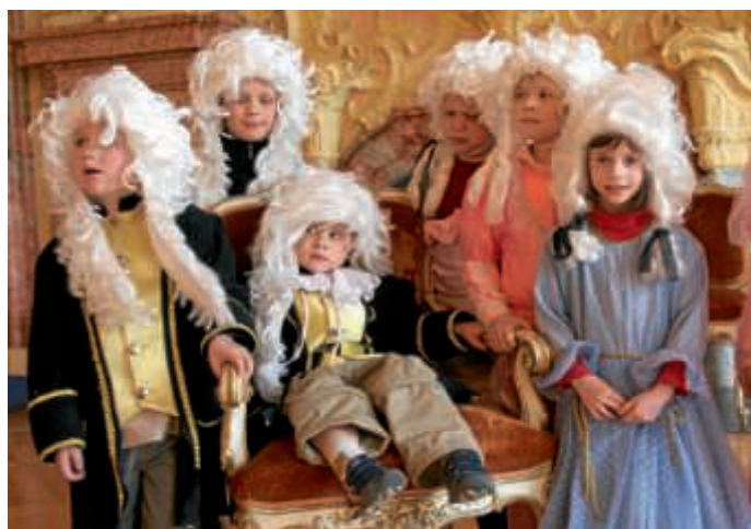
Kindersonderführung im Schloss Bruchsal