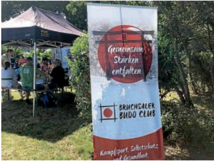
Teilnahme beim Kindertag der Bereitschaftspolizei Bruchsal

Wir danken der Bereitschaftspolizei Bruchsal dafür, dass wir uns auf diese wunderbare Weise präsentieren durften. Und natürlich bei allen Helfern, ohne die eine solche Aktion nicht möglich wäre.