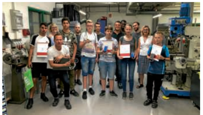
JugendTechnikSchule bei Anton Debatin GmbH

Bei den Kursen kann man Berufe wie den Mechatroniker einfach und ganz praktisch ausprobieren