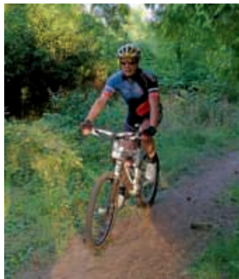
Die Mountainbike Freunde laden zur 23. Heidelheimer Mountainbiketour

Um die Teilnehmer richtig zu versorgen, sind bei der Tour insgesamt zwei Verpflegungsstellen eingerichtet. Die 33 km Distanz ist mit einer und die Langstrecke mit zwei Stationen ausgestattet. Auch dieses Jahr haben wir uns wieder bemüht eine abwechslungsreiche Strecke zusammenzustellen – wie jedes Jahr – ausschließlich auf Wald- und Feldwegen des Kraichgauer Hügellandes. Viele schöne Passagen auch auf Singletails vom Heidelheimer Zauberwald bis hin zum Bruchsaler Eichelberg auf der großen Runde sind die Highlights der diesjährigen Tour.