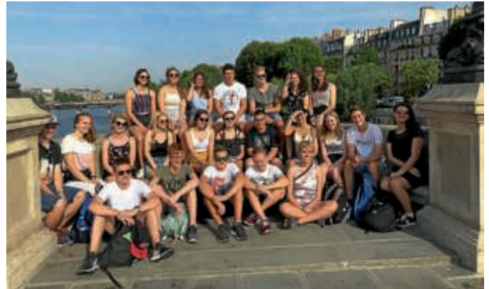
An der Seine