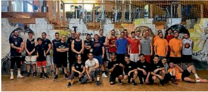
Basketball-Turnier des IdS-Projekts