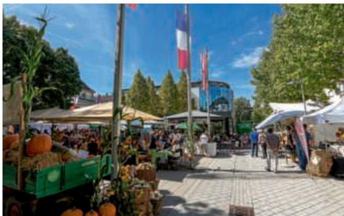
Herbstmarkt auf dem Europaplatz

Das Trio Corde wird am Samstag, 7. September, 19.30 Uhr, das Herbstwochenende einläuten. Drei Musiker, die sich leidenschaftlich der akustischen Gitarrenmusik verschrieben haben, swingen und grooven durch den Feierabend. Temperamentvoll und mitreißend setzen sie südamerikanische Akzente. Eingängige Melodien und anspruchsvolle Eigenkompositionen bieten die perfekte musikalische Begleitung zu einem kurzweiligen Abend.