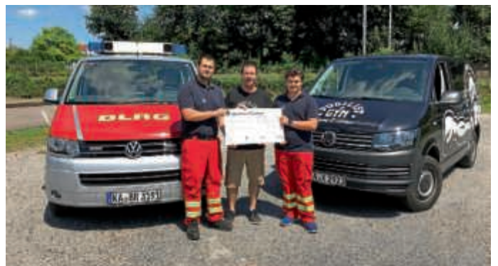
Fun Run 2019