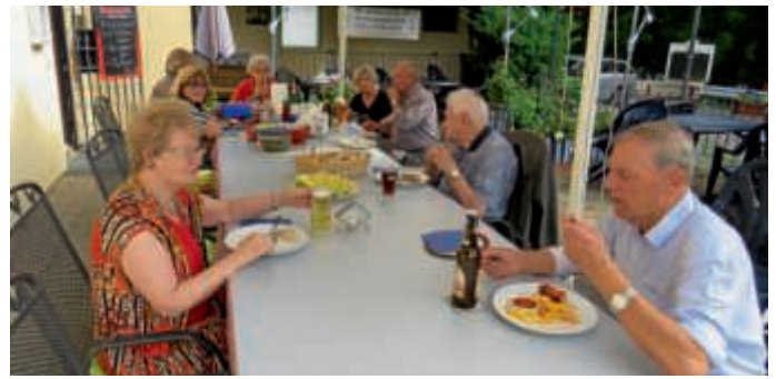
Gemütliches Beisammensein beim Grillfest