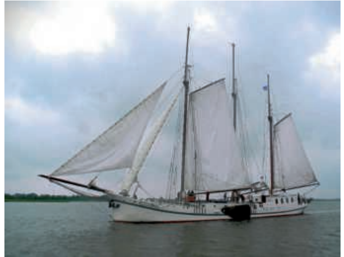
Segler auf großer Fahrt

Die vielen Gespräche mit den Besuchern und die positive Resonanz auf unsere Ausstellung haben alle Mühen vergessen lassen. Uns hat es Freude gemacht, dass die Bilder den Besuchern gefallen haben und es uns auch mitteilten. Dafür bedanken wir uns noch einmal bei allen Gästen des Joss-Fritz-Festes.