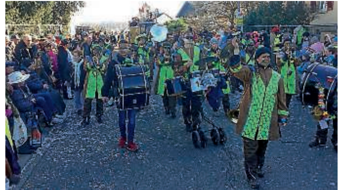
Nashörner in Büchenau