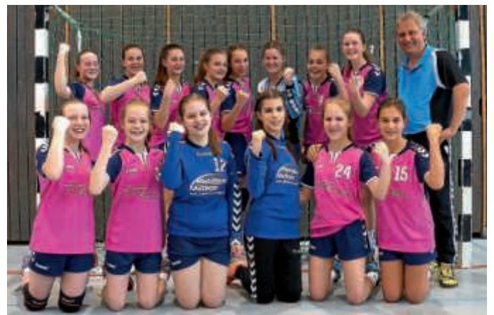
Siegreiche weibliche C-Jugend