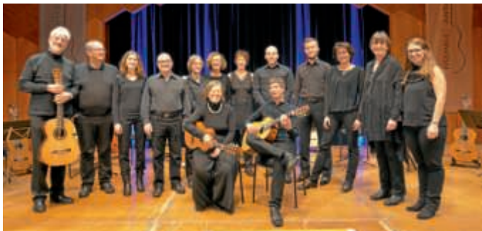
Ensemble Cantabile im Ehrenbergsaal Bruchsal