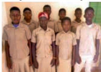
Es wäre schade, wenn diese 8 Kinder nicht weiterlernen könnten.