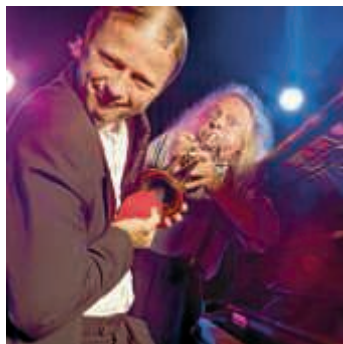
Gogol & Mäx - Das besondere Konzert

Für das Frühjahrskonzert im Jubiläumsjahr hat sich der Musikverein einer besonderen Herausforderung gestellt: es gilt zu beweisen, dass Blasmusik sowohl ernsthaft als auch humorvoll sein kann. Ersteres wird das Hauptorchester des Vereins im ersten Teil vor der Pause mit Arrangements vieler bekannter Melodien darlegen. Für den zweiten Teil des Konzertes hat sich der Verein die Unterstützung von zwei international erfolgreichen Profis gesichert, die es verstehen das Zwerchfell des Publikums zu strapazieren. Erleben Sie Gogol & Mäx in diesem „besonderen Konzert“.