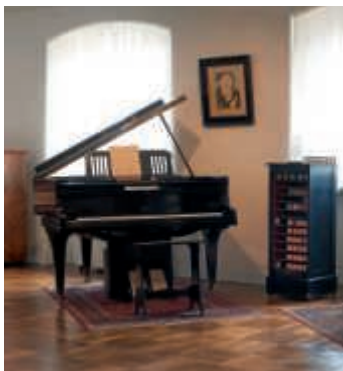
Konrad-Adenauerfluegel, Firma Hupfeld, Leipzig 1921, Foto: Klaus Biber, Badisches Landesmuseum

Anmeldung bis 7. März unter dmm@landesmuseum.de oder Telefon: (07251) 742652