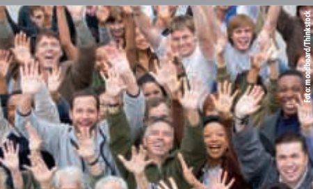
Entwicklung der Einwohnerzahlen 2017