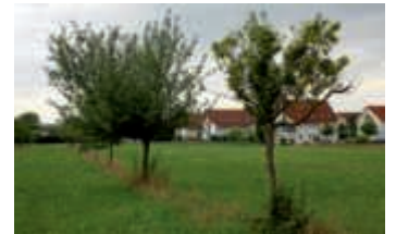
Diese Bäume sollen am 3.3. einen Pflegeschnitt erhalten