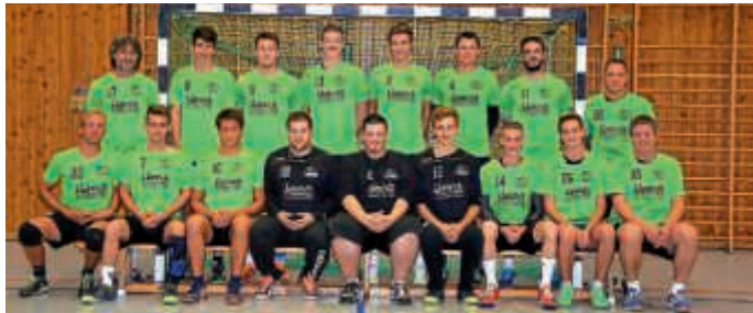
Die 2. Herrenmannschaft

HSG Bruchsal/Untergrombach II - TV Neuthard II 23:12 (12:6)