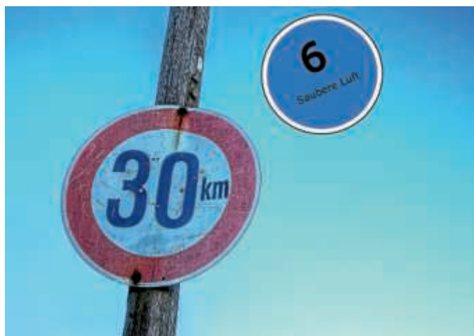
AG Umwelt und Energie lädt zum Gruppentreffen.