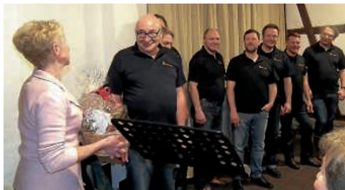
Präsentübergabe an die Ohrzwigga für diesen großartigen Auftritt