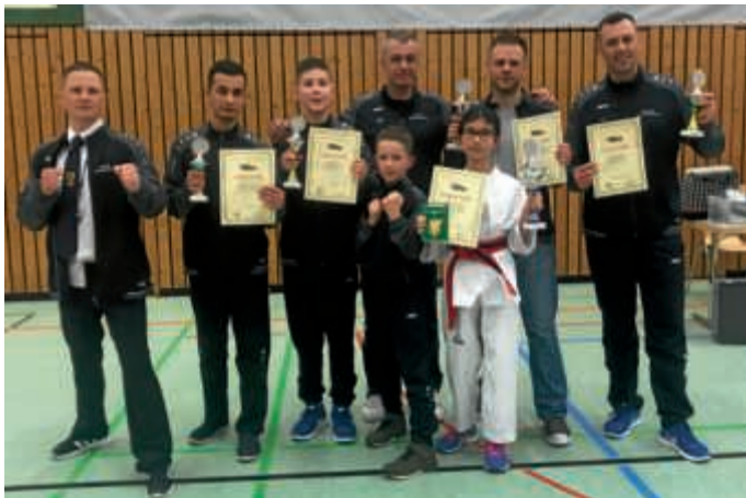
Glückliche Gewinner vom Taekwondo Zentrum Bruchsal e.V.

Am 24.02.2018 fand die Baden-Württembergische Leichtkontakt Meisterschaft 2018 in Elgersweier unter Leitung des Großmeisters Herrn Kum Sik Kwak (9. DAN) statt. Es waren zahlreiche Vereine und Sportschulen mit über 200 Wettkämpfern vertreten.