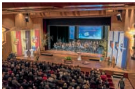
Karten für den Bürgerempfang 2018 erhältlich ab Montag, 5. März.

schutzes. Zu den Elementen des Bürgerempfangs zählt - neben einem unterhaltsamen Rahmenprogramm - ein Podiumsgespräch mit ausgewählten Gästen zum Schwerpunktthema des Abends.