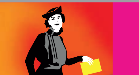
Veranstaltungen Rund um den Internationalen Frauentag 2018