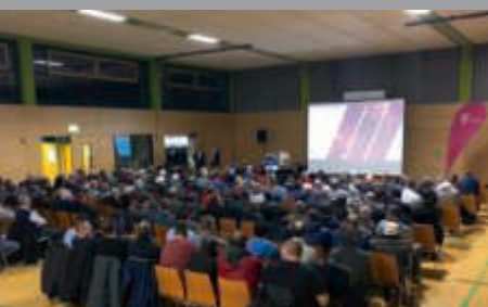
Infoveranstaltungen der Deutschen Telekom