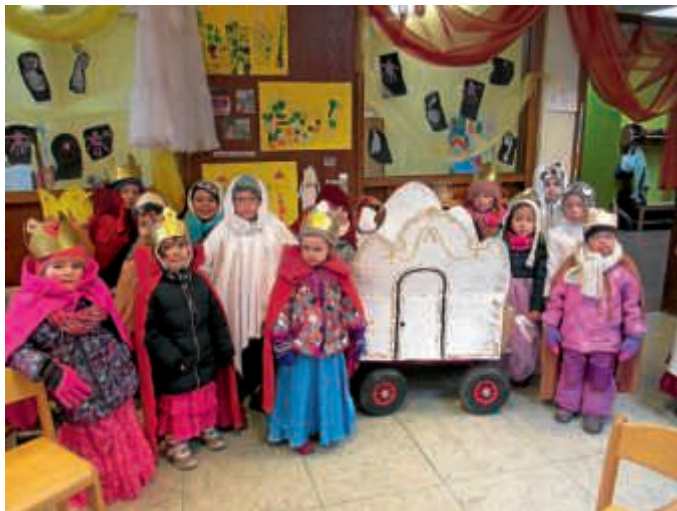
Los geht's zum Krach-Umzug