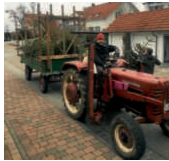
Handballer bei der Christbaumsammelaktion

Erfolgreich war wiederum das Zeltlager 2017 unter Lagerleiter Jens Hardock mit 32 Schülern und 13 Betreuern. In diesem Jahr steht das 50-jährige Lager-Jubiläum an und das soll groß gefeiert werden.