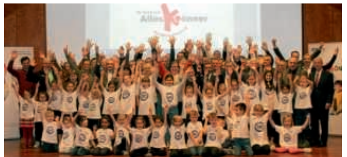
TSG-Turnkinder beim Deutschen Turntag im Bürgerzentrum

Der Deutsche Turnerbund und seine Landesturnverbände widmen sich in den kommenden Jahren durch die „Offensive Kinderturnen“ in besonderer Weise der Förderung und öffentlichen Wahrnehmung des Kinderturnens. U.a. findet hierzu am 11. November 2017 bundesweit der „Tag des Kinderturnens“ statt.