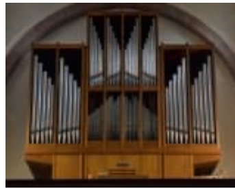
Orgel Foto: St. Cosmas und Damian Untergrombach

Anlässlich des 50-jährigen Orgeljubiläums und des 125-jährigen Bestehens des Kirchenchores St. Cosmas und Damian Untergrombach fand am 29. Oktober 2017 ein sonntägliches Kirchenkonzert statt, das naturgemäß Orgel und Chor in den Mittelpunkt stellte und demgemäß nur