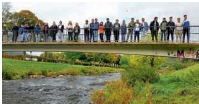
Die Klassen 8a und b im Schullandheim