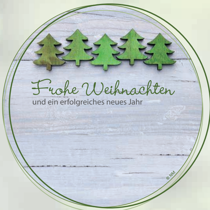
WA17_063: 2-spaltig, 90 x 90 mm