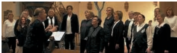
All Cantare beim Festgottesdienst in Staffort