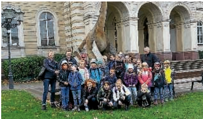
Vor dem Naturkundemuseum Karlsruhe