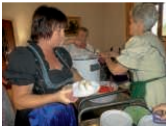
Oktoberfest 2017