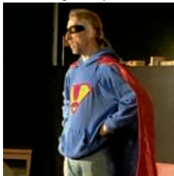
Lesung Stadtbücherei R. Rudloff

Am letzten Schultag vor den Herbstferien machten wir uns auf den Weg in die Stadtbücherei Bruchsal, um eine actiongeladene Lesung von Rainer Rudloff zu hören. Mit superheldenmäßigem Outfit und rasantem Start waren wir sofort Teil der Geschichte um Pelle, einem eher dicklichen, unscheinbaren Jungen, der durch den Biss einer mutierten Ameise zu superschnellen, superstarken und supermutigen Helden wird- „Antboy“.