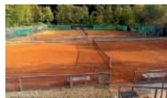
Die Anlage muss winterfest gemacht werden

zur Erhaltung unserer wunderschönen Tennisanlage ist die Mitarbeit aller Mitglieder des TC Obergrombach notwendig. Der Winter naht und es gibt noch einiges zu tun. Daher treffen wir uns zum nächsten Arbeitseinsatz am Samstag, 18. November um 9.00 Uhr.