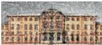
Adventskalender Bruchsal-Schloss

Der Lions-Club Bruchsal-Schloss konzentriert seine Unterstützung auf junge und bedürftige Menschen in Bruchsal. Der Erlös der diesjährigen Adventskalenderaktion soll der Hausaufgabenbetreuung am Jugendzentrum Südstadt, den Lernassistenten an der Bruchsaler Konrad-Adenauer-Schule, der Suchtprävention und kulturellen Zwecken zugutekommen.