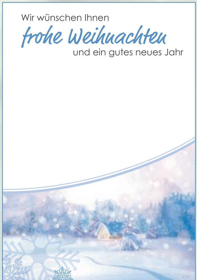
WA17_013: 2-spaltig, 130 mm