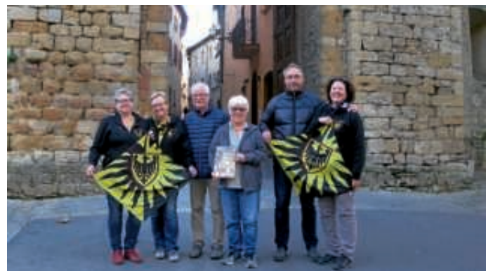
Freundeskreis Volterra vor der Porta Fiorentina