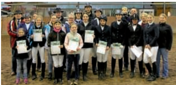
Erfolgreiche Teilnehmer von den Reitabzeichenprüfungen