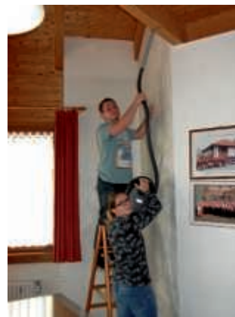
Kampf den Spinnweben, auch an der Decke

Am 28. Oktober fand zwischen 9.30 und 15.30 Uhr wieder der alljährliche Großputz im und um das Musikerheim statt. Insgesamt brachten 18 Personen, wobei auch passive MVO-Mitglieder tatkräftig zupackten, nicht nur Küche, Theke, Sitzungszimmer und Probensaal, sondern das gesamte Musikerheim von Garage über Lager bis zum Speicher wieder ordentlich auf Hochglanz. Das Musikerheim ist nun fit für das Jubiläumsjahr 2018!