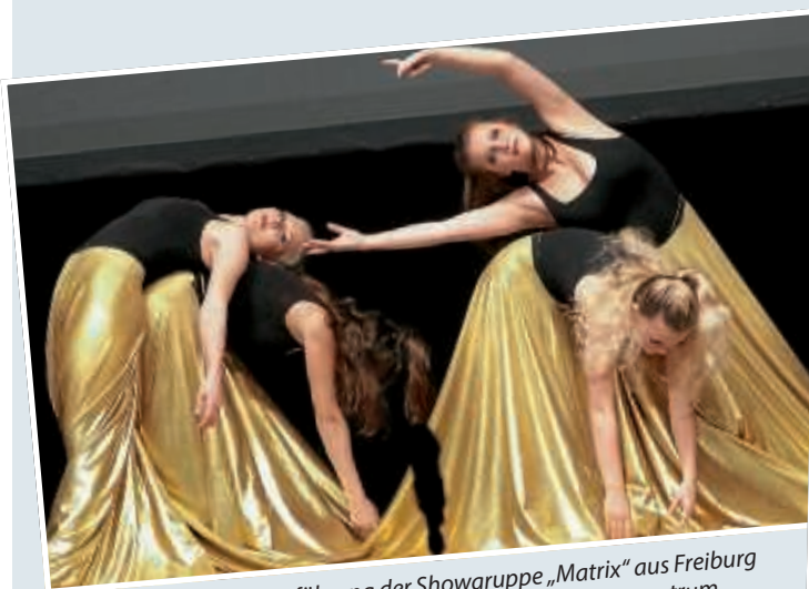
▲ Tolle Vorführung der Showgruppe „Matrix“ aus Freiburg bei der Eröffnungsveranstaltung im Bürgerzentrum.