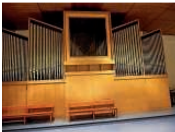
Die Orgel in der Pauluskirche spielt wieder.