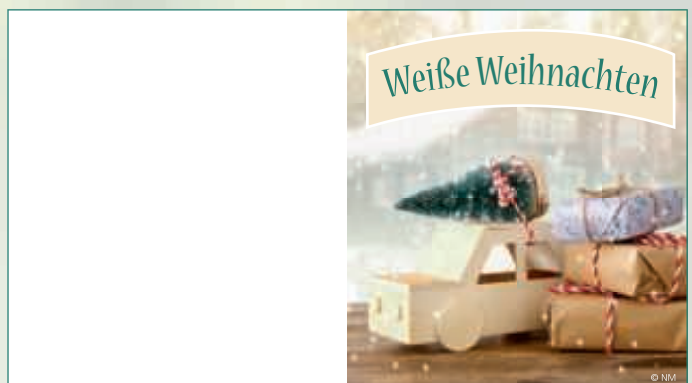
WA17_029: 2-spaltig, 90 x 50 mm