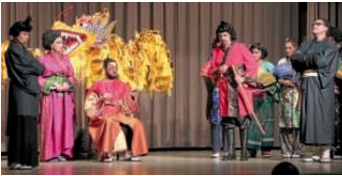
Der Mikado hält Hof – aber was halten seine Untertanen davon?