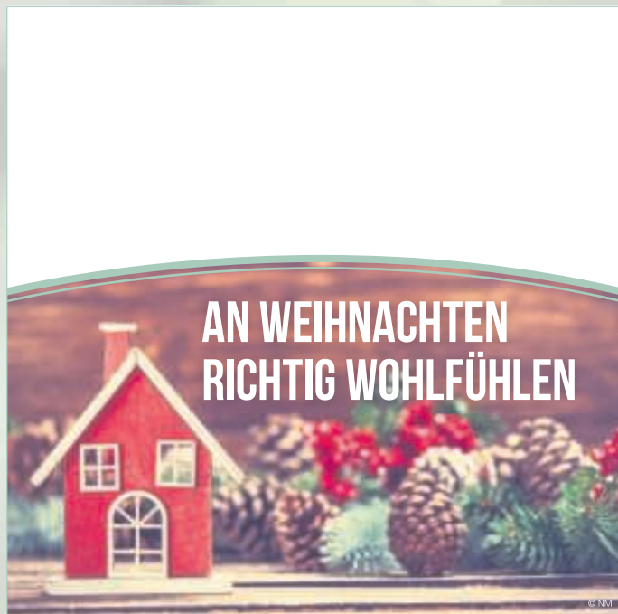
WA17_034: 2-spaltig, 90 x 90 mm - Raumausstattung