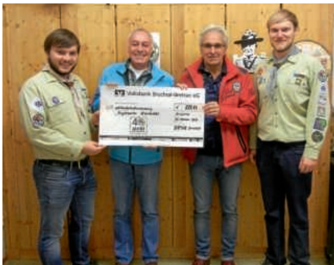
Georgspfadfinder sammeln für den Projektgarten Heubühl.

Die Georgspfadfinder der DPSG Bruchsal konnten sich dieses Jahr erneut beim Heubühl-Fest einbringen. Mit einem Kuchenverkauf wurden Spenden in Höhe von über 800 Euro gesammelt. Zugute kam die Spende dem Projektgarten Heubühl, der es sich zur Aufgabe gemacht hat, Kindern die Möglichkeit zu geben, wieder Abenteuer draußen und in der Natur zu erleben. Die Spende wurde nun in den Räumlichkeiten der Pfadfinder an zwei Vertreter des Projektgartens übergeben, die mit diesen Mitteln weitere Angebote schaffen wollen und bereits vorhandene entsprechend erneuern.