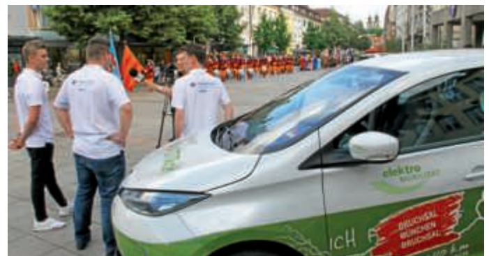
Wenn 21. Jahrhundert auf 15. Jahrhundert trifft: Zur Feier ihrer Rückkehr spielten Bruchsaler Fanfarenzüge auf. Ein unwirklicher Moment.