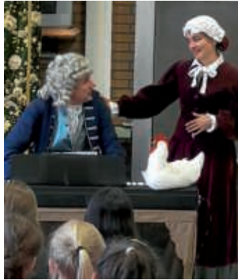
Klaviertheater Santa

Vor den Pfingstferien gastierte das Klaviertheater Santa mit dem Stück „den Bachen geizmet Lachen“ an der Konrad-Adenauer-Schule. Die Schülerinnen und Schüler erlebten die Musik von Johann Sebastian Bach und begaben sich mit ihm und seiner Frau erzählerisch und musikalisch auf eine Reise in die Welt der Familie Bach. Dabei erfuhren sie, dass Johann Sebastian und seine Frau Anna Magdalena dreizehn Kinder hatten und das Leben als Künstlerfamilie nicht immer leicht war. Durch Singen und Bewegung wurden die Kinder aktiv in das Geschehen einbezogen: Sie sangen zusammen mit Herrn und Frau Bach einen Auszug aus der Bauernkantate und einige Schüler verwandelten sich mit Hilfe passender Kostüme in die dargestellten Personen. Dies war schon der zweite Besuch des Klaviertheaters an der Adenauerschule und die Schulgemeinschaft der Grundschule freut sich schon auf den nächsten Besuch.