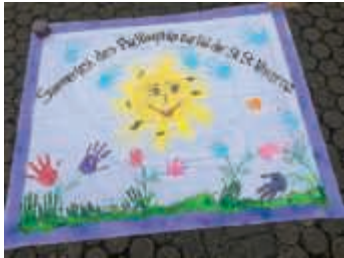
Sommerfest Café St. Paul