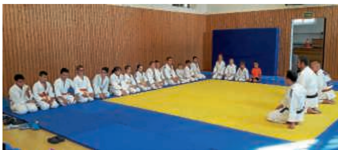
Teilnehmer und Teilnehmerinnen der Vereinsmeisterschaft