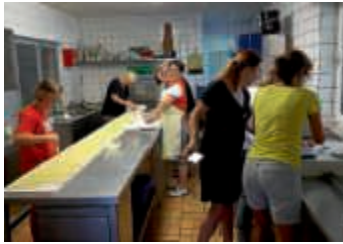
TVO bereitet sich vor

Seit 2016 steht außerdem noch Pulled-Pork auf der Speisekarte des Turnvereins. Nach amerikanischem Vorbild wird dabei Schweinefleisch acht bis zwölf Stunden bei niedrigen Temperaturen im Smoker gegart. Zusammen mit den Brötchen der Bäckerei Bannholzer, cremigem Krautsalat und Barbecue-Sauce entsteht daraus ein leckerer Burger – das perfekte Streetfood. Schnell sein lohnt sich. Der Burger wird nur sonntags angeboten und war beim letzten Burgfest bereits nach nur zwei Stunden vergriffen. Als Dessert empfehlen wir einen unserer süßen Crepes. Auch hier ist der Teig hausgemacht!