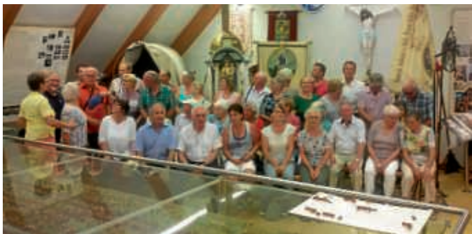
Kirchenchor im Parabutscher Museum