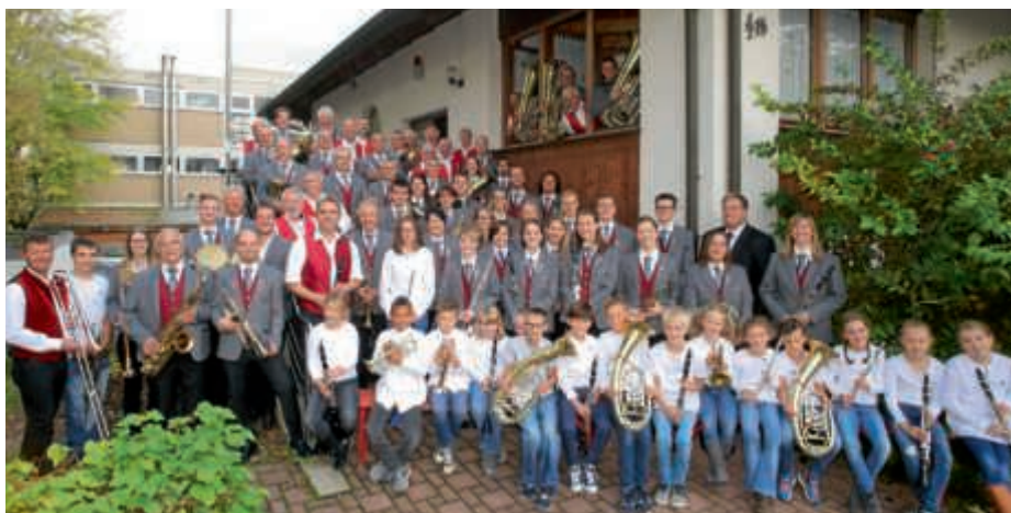
Musikverein „Eintracht“ Obergrombach feiert 125-jähriges Bestehen

hältlich bei der Sparkasse in Obergrombach (Hauptstraße 1), der Buchhandlung Braunbarth in Bruchsal (Kaiserstraße 30) sowie per E-Mail unter reservierung@musikverein-obergrombach.de . Weitere Informationen auf der Homepage des MVO: www.125jahre.musikverein-obergrombach.de Lesen Sie mehr unter den Stadtteilnachrichten Obergrombach.