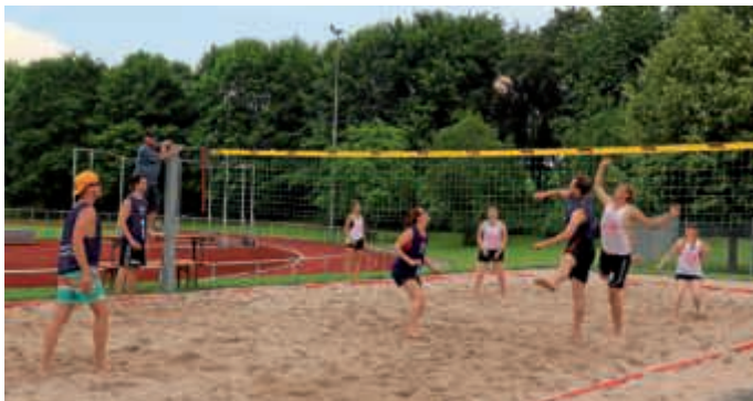
Erstes Turnier auf dem neuen Beachvolleyballplatz