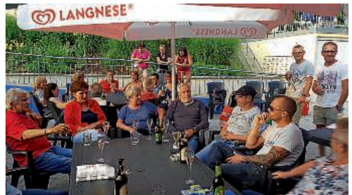
Einige der anwesenden Team-Helfer beim Helfer-Hock