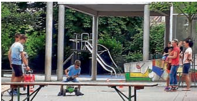
Viele Kinder hatten Spaß beim Besuch der Spielstraße