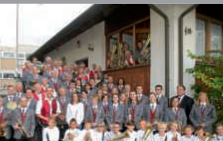
Musikverein „Eintracht“ feiert 125-jähriges Bestehen