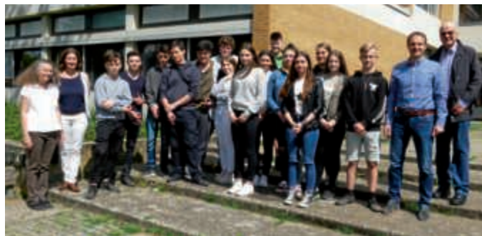
Schülerinnen und Schüler der Konrad-Adenauer-Schule arbeiteten für die Bürgerstiftung

„Heute schon die Welt verändern“, stand auf einer Kollagen-Wand im Foyer der Konrad-Adenauer-Schule in Bruchsal. Gemäß diesem Motto hatten viele Schülerinnen und Schülern „gestern“ freiwillig und unentgeltlich für die Stiftung gearbeitet. Beim jährlichen „Mitmachtag“, „Mitmachen – Ehrensache“, hatten sie sich mächtig ins Zeug gelegt. Sie hatten sich um Beschäftigungen beworben, um dort einen Tag lang zu arbeiten und den verdienten Lohn an die Bürgerstiftung zu spenden. Insgesamt kam am Schluss die stolze Summe von 2.500 Euro zusammen. Und warum gerade für die Bürgerstiftung? „Die Bürgerstiftung hat bereits viel Gutes für unsere Schule getan und so wollten wir einmal etwas für die Stiftung tun“, sagten die Jugendlichen. „Außerdem kann dieses Geld wieder anderen Menschen helfen – ein Kreislauf des Guten.“