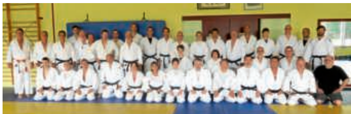
Teilnehmer des Kata-Workshop