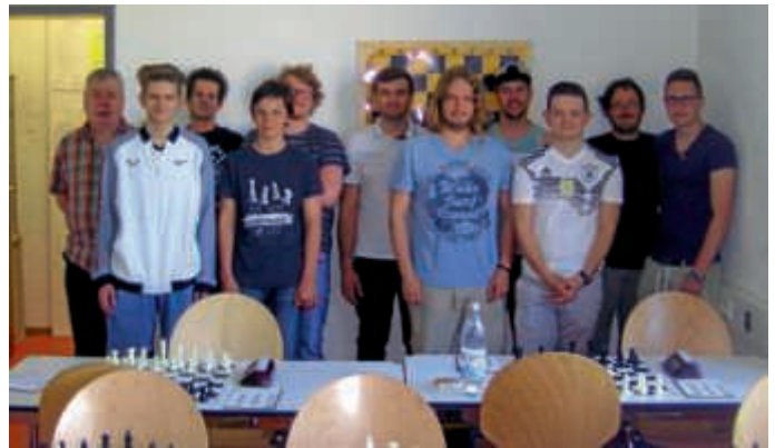
Die souveräne Meistermannschaft!

Nach dem Abstieg aus der Bereichsliga 2017 hat unsere Erste den direkten Wiederaufstieg realisiert und das in unglaublich überzeugender Weise. So konnten wir alle (!) neun Spiele gewinnen und die meisten klar und deutlich! Insofern hat das Team gezeigt, dass es in die Bereichsliga gehört und unsere jungen Spieler haben eine deutliche Entwicklung vollzogen in dieser Saison, sodass wir gespannt die neue, allerdings bekanntermaßen ungleich schwierigere Aufgabe anzugehen.