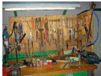
Gute Werkzeuge und Arbeitsgeräte sind immer sehr willkommen.