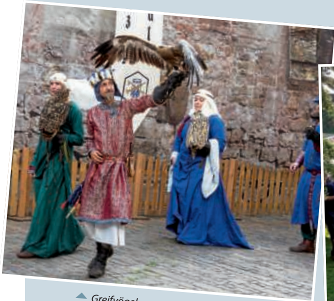
▲ Greifvögel zogen die Aufmerksamkeit der zahlreichen Besucher auf sich.