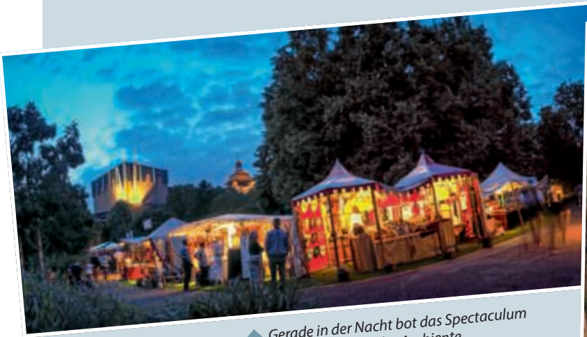
▲ Gerade in der Nacht bot das Spectaculum ein stimmungsvolles Ambiente.