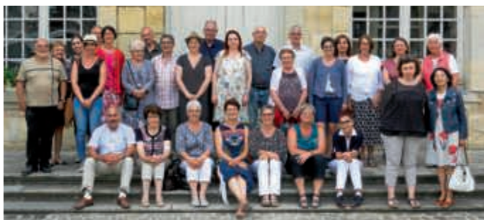
Begrüßungsfoto vor dem Hôtel de Ville in Ste. Ménehould am 8. Juni mit allen Teilnehmern