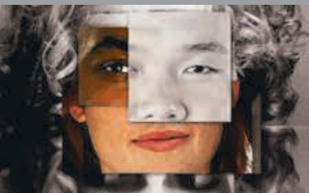
Internationales Stadtfest am 30. Juni 2018