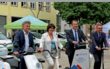
Tag der Mobilität auf dem Marktplatz