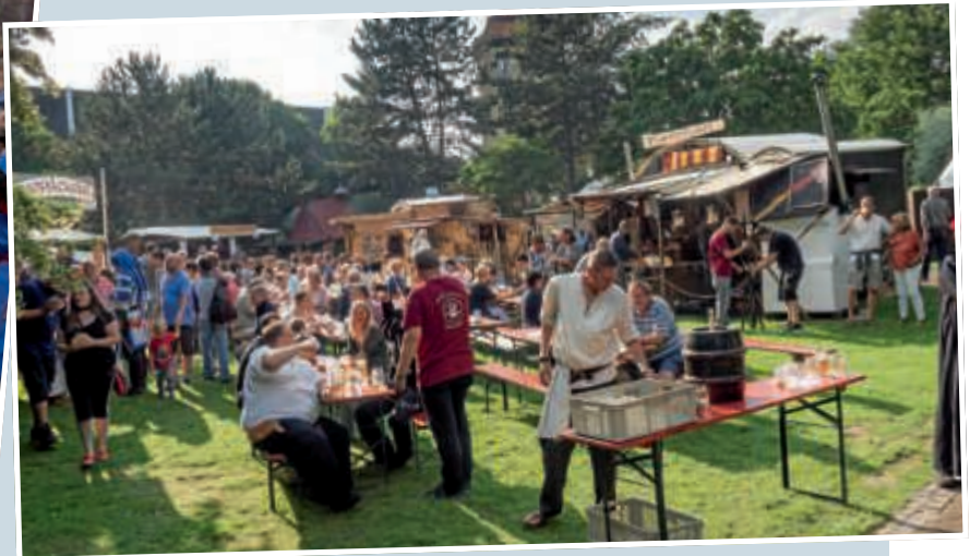
▲ Fröhliches Treiben rund um den Bergfried bei schönstem Wetter.