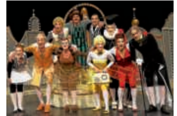
Figaros Hochzeit

Mit „Der tolle Tag oder Figaros Hochzeit“ bringt die Badische Landesbühne in diesem Theatersommer ein fröhliches Intrigenstück mit Tiefgang auf die Freilichtbühne. Am 12. Juli um 20.30 Uhr ist die Bruchsaler Premiere im Schlosspark zu sehen.