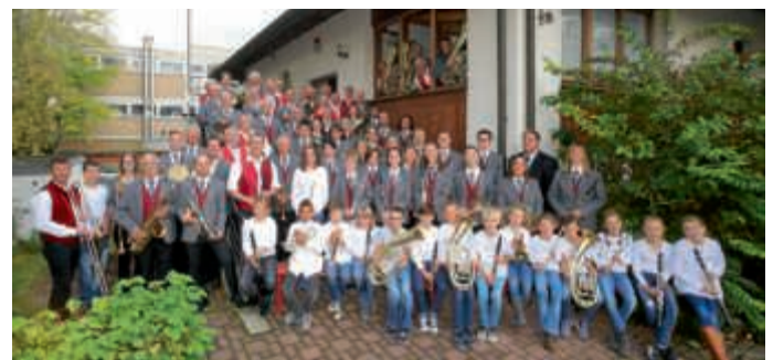
Der MVO freut sich auf das Jubiläumsfestwochenende mit Ihnen

Unter dem Motto, „Hier spielt die Musik!“ hat der Musikverein „Eintracht“ Obergrombach ein wahrlich abwechslungsreiches und vielseitiges Programm für das Jubiläumsfest vom 22. bis 25. Juni zusammengestellt, so dass für wirklich jeden Musikfan etwas dabei ist.