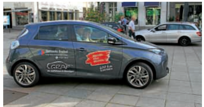
Kurz nach Team „München“ startete auch Team „Köln“ wie vorgegeben über Landes- und Bundesstraßen in Richtung seiner Ziel-Metropole.