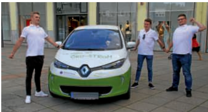
Nach 750 km Fahrt mit Umleitungen trafen die „Münchener“ am Freitag um 17:30 Uhr erschöpft, aber guter Dinge wieder am Rathaus ein.