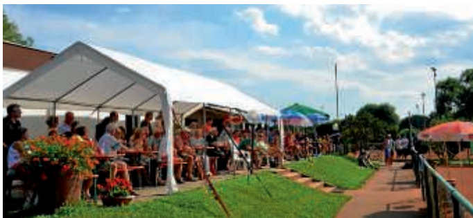
Viele Zuschauer beim Michaelsbergturnier 2017