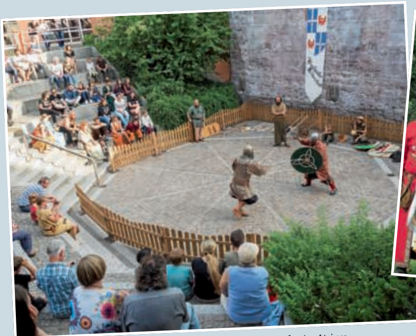
▲ Laut dröhnten die Schwertschläge bei den Ritterkämpfen im Atrium.