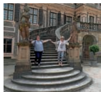
Internet-Zeitalter trifft Barock