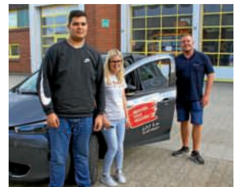
Nach einem unverhofft langen Ladestopp in Wiesbaden kehrten die „Kölner“ – später als erwartet – um 19:15 Uhr zur SWB zurück.