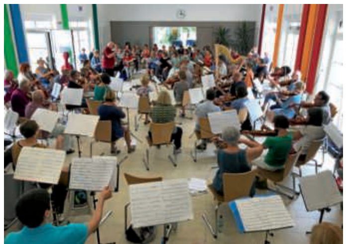
Probenwochenende mit dem DFC München

Besondere Gäste, besonderer Ort, besonderes Programm: Gemeinsam mit dem Deutsch-Französischen Chor München gestalten wir ein „Freundschaftskonzert – Concert d’Amitié“, das dieses Jahr unsere traditionelle Serenade am Belvedere ersetzt. Vergangenes Wochenende trafen wir uns mit den Münchener Chor-Freunden zu einem intensiven Probenwochenende in Schloss Flehingen. Wir freuen uns nun auf ein besonderes Programm mit berührenden chorsinfonischen Werken der französischen Komponisten Gabriel Fauré, Francis Poulenc und Georges Bizet.