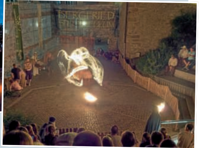
▲ Feuerschwinger beeindruckten die Zuschauer mit ihrem gefährlichen Spiel.