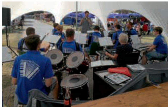
1. Orchester, Leitung von J. Rützler