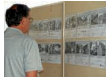
Die Bildwand zur Heimatgeschichte fand viele interessierte Betrachter

Da sich im Laufe der Jahre so viele interessante und zum Teil verschollen geglaubte Bilder angesammelt hatten, entschieden die Mitglieder einen virtuellen Rundgang durch die frühere Haupt- und Schulstraße in einem sechsten Heft zusammenzustellen. Diese zeigt, wie Büchenau zwischen 1882 und 1945 ausgesehen hat. Nahezu alle dortigen Häuser sind abgebildet und wurden zum großen Teil mit den ehemaligen und jetzigen Besitzern in Verbindung gebracht. Ebenso wurden Themenbereiche wie Landwirtschaft, Tabak- und Spargelanbau sowie die vom Arbeitskreis eingerichtete heimatkundliche Sammlung einbezogen. Die Umsetzung, die Sichtung des Bildmaterials, die Recherche nach weiteren noch fehlenden Bildern lagen in den Händen von Günter Weih und Harald Bläske. Ein Dank ging an die Mitstreiterinnen und Mitstreiter des Arbeitskreises Ortsgeschichte für ihr unermüdeliches ehrenamtliches Engagement und an die derzeitigen und früheren Bewohner, die mitgeholfen hatten, Bilder wieder zu entdecken. Für sieben Euro kann das Heft beim Arbeitskreis oder im Buchhandel käuflich erworben werden.