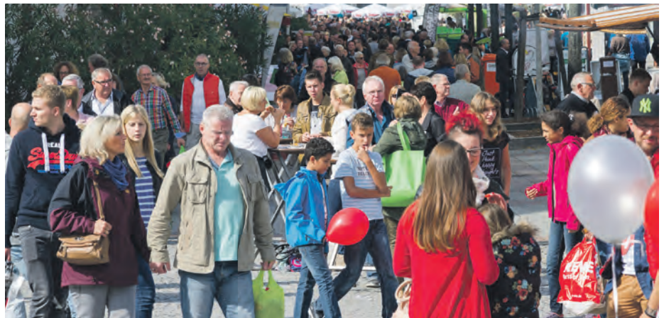
Der Branchenbund B3 lädt alle Besucher zur Brusl Night am Freitag, 24. und Samstag, 25. Juni in die Geschäfte und buntem Programm ein.