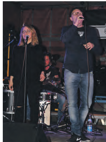
Das Gesangsduo von The Hörps begeisterte das Publikum