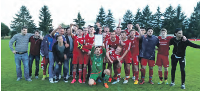
Aufsteiger Landesliga A-Junioren