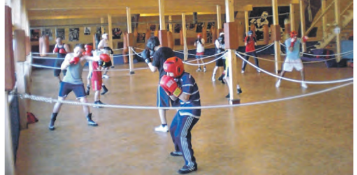
Boxen für Kinder

Montag, Mittwoch und Freitag von 16.30 – 17.30 Uhr.