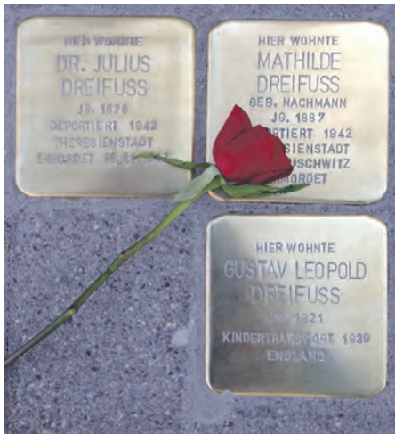
„Stolpersteine“ des Kölner Künstlers Gunter Demnig werden zum Gedenken an die NS-Opfer am 27. Juni in Bruchsal verlegt.

Bruchsal (pa) | Das Projekt „Stolpersteine“ des Kölner Künstlers Gunter Demnig, im Jahre 1997 ins Leben gerufen, ist zwischenzeitlich zum größten dezentralen Mahnmahl gegen Unterdrückung und Totalitarismus in Europa angewachsen. Seine kleinen „Stolpersteine“, zehn mal zehn Zentimeter große Würfel mit den Lebensdaten von NS-Opfern, werden verlegt vor den Häusern, in denen diese Menschen zuletzt freiwillig gelebt oder gearbeitet haben, aus denen sie vertrieben oder deportiert wurden. Am Montag, 27. Juni, werden zum zweiten Mal Stolpersteine in Bruchsal verlegt, maß-