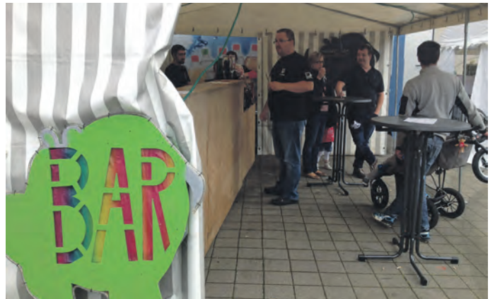
Benefizfest mit Nashorn-Bar