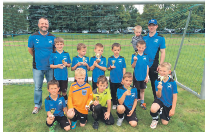
F-Junioren in Grötzingen

Am Samstag 18.06.2016 traten unsere beiden Teams der F2-Junioren beim Sommersportfest des VfB Grötzingen an. Nachdem unser letzter Spieltag nicht so berauschend war, zeigten sich unsere Jungs heute wieder von Ihrer erfolgreichen Seite. So sahen sowohl die mitgereisten Fans als auch das Trainergespann 8 tolle und spannende Spiele mit nur 2 Niederlagen. Großes Lob an beide Teams!