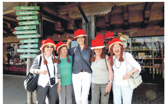
Die Bollenhüte hatten es den Damen angetan