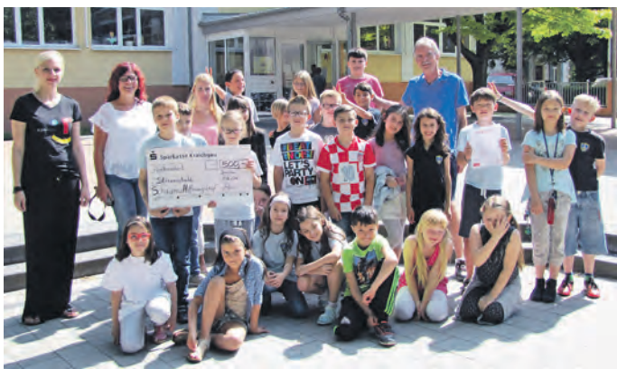
Preisübergabe in der Stirumschule