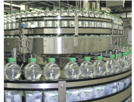
Von der Herstellung der Kunststoffflaschen bis zum Abfüllen des Mineralwassers können die Besucher bei Hansa-Heemann alles hautnah miterleben.

des Hansa-Heemann-Standorts in der Industriestraße. Dort haben sie Gelegenheit, die Wasserentnahme, die Wasseraufbereitung, ebenso wie die Aufbereitung mit Zusätzen, sowie die Abfüllanlage zu besichtigen. Auf dem Rückweg legt der Stadtbus einen Zwischenstopp bei den Stadtwerken ein, wo die Teilnehmer bei Kaffee und Kuchen ihre Eindrücke austauschen können, bevor sie später wieder ans Rendezvous in der Bahnhofstraße, den Ausgangspunkt ihrer kleinen Bildungsreise, zurückgebracht werden. tw