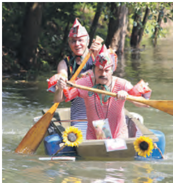
Mit Kreativität und Schnelligkeit ans Ziel

Von der mutigen Idee zur Wirklichkeit: Im Rahmen der Bruchsaler Heimmattage 2015 entstand doch mancherlei, was sich in diesem für die Stadt ganz besonderen Jahr gewiss leichter in die Realität umsetzen ließ als zu „normalen“ Zeiten: Das 1. Heidelsheimer Melkkiwreider-Rennen auf der Saalbach entlang der Zehntgasse. Im selbstgebauten „Melkkiw“ traten sechsdreißig Zweiergruppen an, gefordert waren Schnelligkeit und Kreativität. Ob Wikinger, Piraten oder Gondolieri aus dem fernen Venedig, ob echte „Melkkübel“, Badewannen oder Mörtelbottiche – der Fantasie war, was Fortbewegungstechnik und Beschaffenheit der fahrbaren Untersätze anbelangte, keine Grenzen gesetzt.