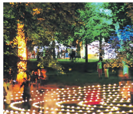
Lichterfest am Samstag, 13. August im Schloss Bruchsal.

Für die besondere Stimmung im Garten der einstigen Residenz der Fürstbischöfe sorgen Damen und Herren in barocken Kostümen und verkleidete Stelzenläufer. Abwechslung soll auch das gastronomische Angebot an verschiedenen Ständen im Schlossgarten bieten. Das Schloss wird während des Lichterfestes geöffnet sein; besondere Führungen bieten die Möglichkeit, die Prunkräume des Schlosses zu erleben. Für den Abschluss des Abends ist gegen 22.45 Uhr ein glänzendes Höhenfeuerwerk angekündigt.