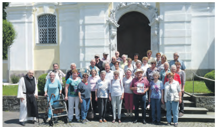
Gruppenbild Kloster Engelszell