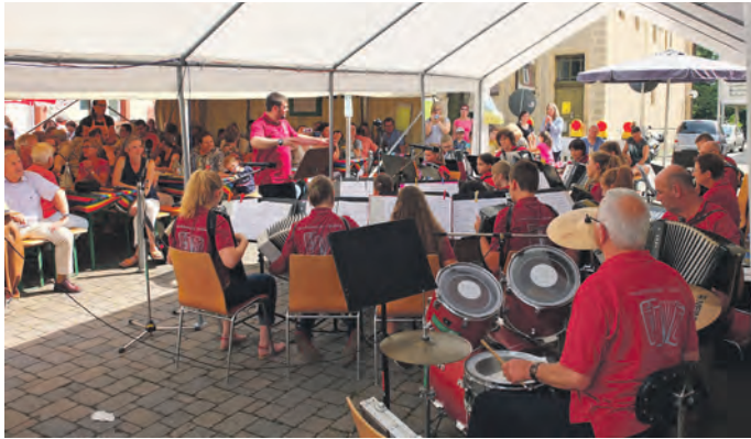
HSH lädt ein zum Sommerfest

Uhr sorgen die Harmonika-Freunde Helmsheim, Werner & Friends, Akkordeonschüler und das Jugendorchester des Handharmonika-Spielring Heidelberg, die Harmonika Freunde Büchenau sowie das Akkordeon-Senioren-Hobbyorchester aus Durlach für vielfältige musikalische Unterhaltung. Auch für kulinarische Höhepunkte ist bestens gesorgt: Von Steak, Grill- und Bratwurst über Pommes, Maultaschen mit Kartoffelsalat bis hin zum fast schon legendären HSH-Mittagstisch (Rindfleisch mit Meerrettich) ist für jeden Geschmack etwas dabei. Zum Nachtisch stehen außerdem unser großes Kuchenbuffet und Kaffee bereit.