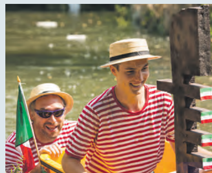
2016 findet zum zweiten Mal das Heidelheimer Melkkiwwl-Rennen am Sonntag, 17. Juli statt.

und Beschaffenheit der fahrbaren Untersätze anbelangte, keine Grenzen gesetzt. Und was beim ersten Mal so erfolgreich war, ruft in diesem Jahr nach einer Neuauflage. Aus Anlass ihres zehnjährigen Bestehens laden die Heidelheimer Melkkiwwlreider am Samstag, 16. und Sonntag, 17. Juli zum zweiten Mal auf den Lutherplatz und an das Saalbachufer ein. Samstags gibt es zunächst Festbetrieb mit Cocktailbar und Lounge sowie ab 18 Uhr Livemusik mit „The Curbside Prophets“ und der Heidelheimer Band „Feßi/DC“, am Sonntag startet – nach einem Mittagstisch mit deutsch-italienischen Spezialitäten – das Rennen ab 14 Uhr. Unterstützt wird der Festbetrieb dann ab 17 Uhr von der Band „People are People“, die Sieger des zweiten Heidel-