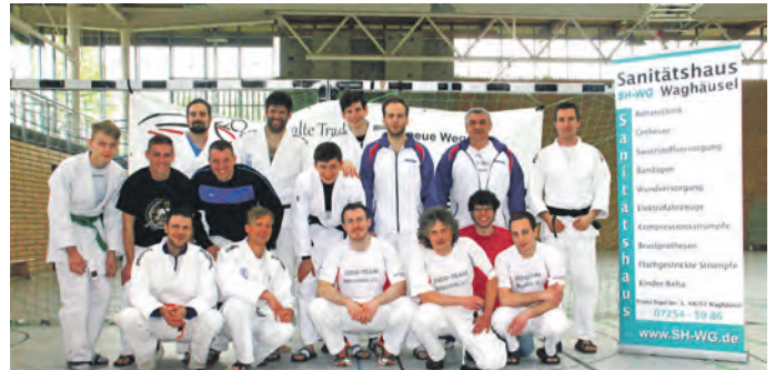
Mannschaft des JTB