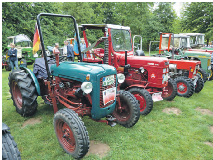
Bulldoggtreffen in Helmsheim