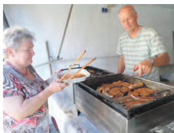
Grillen im Pfarrhof 2015