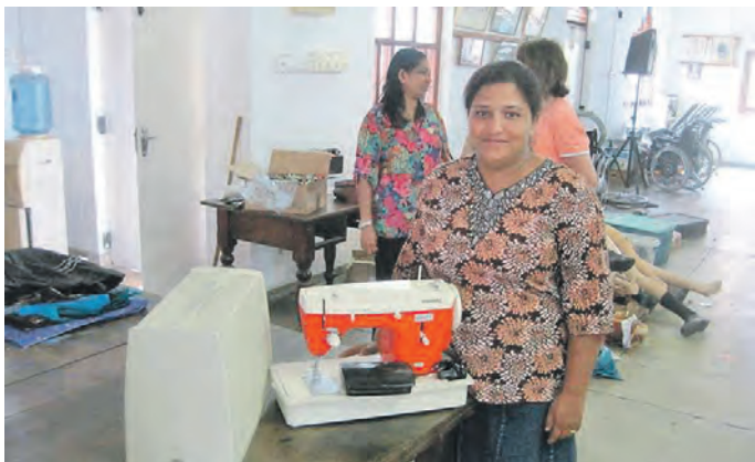
Nähmaschinen sind in vielen Ländern die Basis für ein selbstbestimmtes Leben!

Große Sammelaktion für bedürftige Menschen am kommenden Samstag, 2. Juli 2016 von 8-12 Uhr in Oberhausen, Weiherweg 22