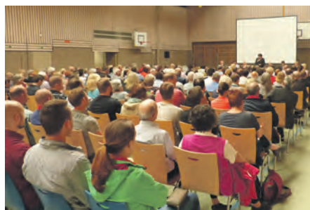
Interessierte Bürgerinnen und Bürger bei der Informationsveranstaltung in der Karl-Berberich-Schule am 13. Juni.