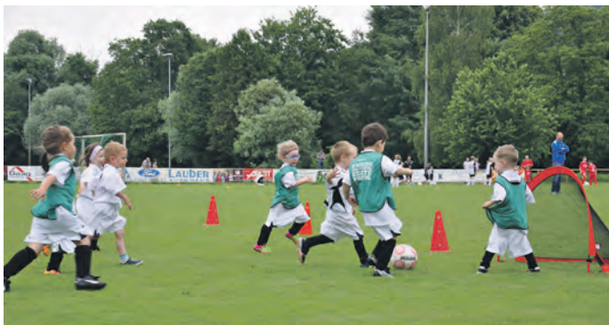
Tag der Jugend beim FCU