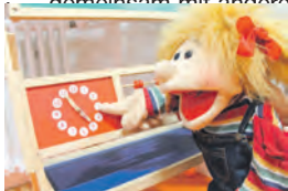
Kinderbetreuung zum Beruf machen