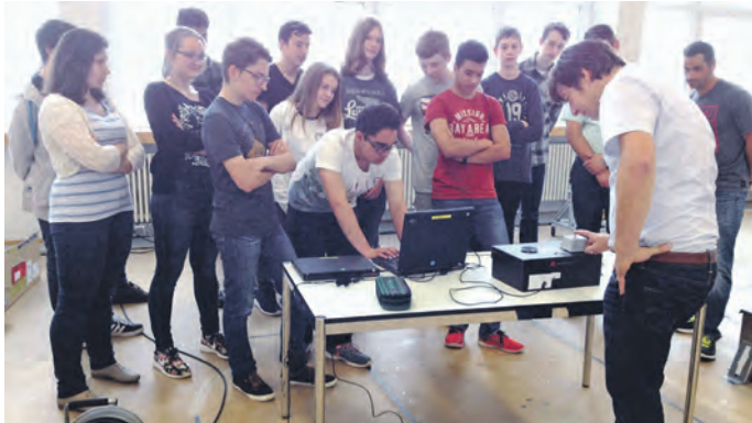
Erasmus+Gruppe des Schönborn präsentiert Ergebnisse aus dem NWT-Unterricht bei SEW