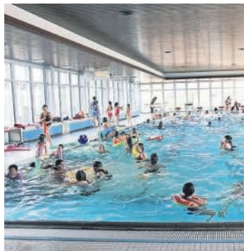
MALA-Treffen im Pfinzbad

Anfang April waren wir zu Besuch im Pfinzbad in Philippsburg. Gemeinsam mit den Kolleginnen von MALA (Mädchenarbeitskreis Landkreis Karlsruhe) boten wir den 60 Mädchen aus verschiedenen Einrichtungen aus dem Landkreis einen fröhlichen Nachmittag.