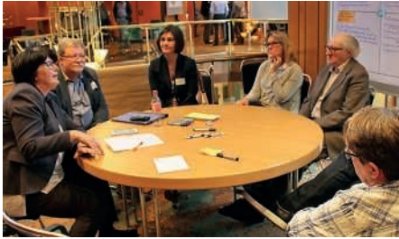
Die Zukunftswerkstatt war geprägt von intensiven Gesprächen in mehreren Arbeitsgruppen.

Miteinander ins Gespräch kommen, neue Ideen zulassen, Lösungen entwickeln – das ist das Ziel der Bürgerwerkstätten im Projekt „Bruchsal wächst! – Wohnen und Zusammenleben“. Diesmal ging es um den Bereich „Kernstadt Nord“ von der B35 bis zum Stadtrand nach Ubstadt-Weiher. Der Vormittag, die Zukunftswerkstatt, war geprägt von intensiven Gesprächen in mehreren Arbeitsgruppen. Dabei ging es um die Bereiche Fuchsloch mit Nachbarschaft; Bauwiesenstraße, Schafgarten, Würtemberger Straße, Eggerten; gute Begegnung im Quartier und Sicherheit in der Nordstadt. Mitarbeiter der Verwaltung haben alle Ideen und Anregungen dokumentiert, damit sie in den endgültigen Entscheidungsprozess im Gemeinderat einfließen können. Die Bürgerversammlung am Nachmittag griff die Ergebnisse des Vormittags auf und diskutierte sie im Plenum. Oberbürgermeisterin