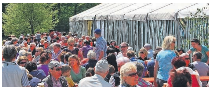
2017-Maifest mit LIVE Musik und Barbetrieb