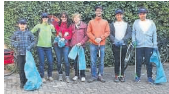
TV-Entmüller mit drei Brüdern aus Afghanistan

Am 8.4. startete die traditionelle Gemarkungsputzete, zu der Ortsvorsteherin Marika Kramer aufgerufen hatte. Auch vom TV waren einige Mitglieder angetreten, andere Leute Müll zu entsorgen. Man begab sich auf die Laufstrecke der Walking/Jogging-Strecke am Kehrweg und Richtung Büchenauer Hardtwald. Einige TV-Mitglieder mit Kindern waren mit anderen Gruppen aktiv beim Entmüllen rund um Büchenau.