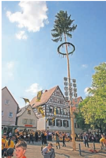
Die gesamte Bevölkerung von Heidelberg und Umgebung ist herzlich eingeladen.