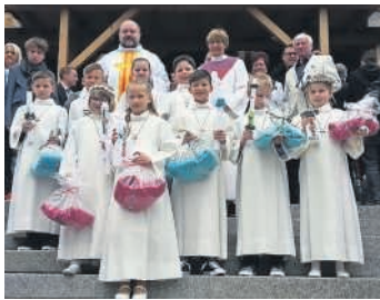
Kommunionkinder des MVO

Wie jedes Jahr begleitete der Musikverein Obergrombach auch dieses Jahr wieder die Erstkommunionkinder vom Rathaus mit dem Stück „Lasst die Kleinen zu mir kommen“ zur Kirche. Nach dem Auszug aus der Kirche empfangen die Musiker und Musikerinnen die Kinder und Kirchenbesucher mit den Stücken „Nessaja“ und „The lion sleeps tonight“. Die Jugendleitung überreichte den insgesamt neun Mitgliedern des MVO unter den Erstkommunikanten ein kleines Geschenk von Seiten des Vereins.