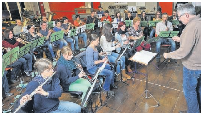
Probearbeit für Konzert am 7. Mai