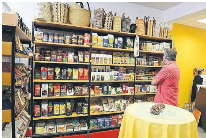
Lebensmittel-Auswahl von süß bis pikant

ebenfalls ehrenamtlich arbeitender MitarbeiterInnen, das es uns nun ermöglicht, auch über Mittag zu öffnen. Für Sie als KundInnen auch in der Mittagspause eine Möglichkeit, Waren aus dem Fairen Handel kennen zu lernen, bzw. zu erwerben und der Weltladen kann die Stadt Bruchsal auf dem Weg zur FairTrade-Stadt weiter unterstützen.