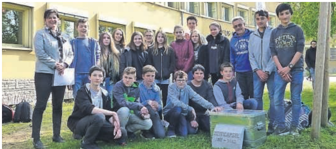
Gruppe Projekt Zeitkapsel