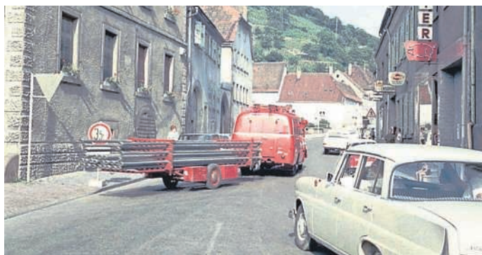
Das 1959 angeschaffte Tragkraftspritzenfahrzeug mit einer TS 8 und dem Rohranhänger

Rückblick in die 125-jährige Historie der Feuerwehr Untergrombach Teil 4