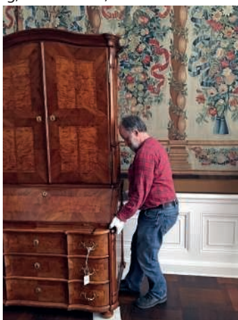
Von Samstag, 29. April, bis Montag, 1. Mai 2017, findet das verlängerte Eröffnungswochenende statt, mit dem die Wiedereinrichtung der Beletage gefeiert wird. Foto: SSG

Am Sonntag, 30. April, und Montag, 1. Mai 2017, ist der Eintritt frei. Schlossführerinnen und -führer stehen in den Schlossräumen bereit, erzählen und beantworten die Fragen der Gäste zur Wiedereinrichtung. Die regulären Führungen entfallen an diesen Tagen. Der Ehrenhof vor der Schlossfassade bietet ein vielfältiges Programm mit Aktionen, etwa einem Kunsthandwerkermarkt mit Vorführungen zur alten Brillenmacher-Kunst, dem Flechten von Haarnetzen, Bürstenbinden und Schmieden. Stände mit Speisen und Getränken laden zum Verweilen ein. Stimmungsvoll flanieren Damen und Herren in historischen Kostümen über den Hof. Die Barockgruppe „Theatro Veneziano“ in historischen Kostümen, Clownin „Stracciatella La Bomboniera“ und der Gaukler „Marquise de Schade“ treten auf. Wer mag, kann mit dem Ensemble „Allegre“ im Marmorsaal das Tanzbein schwingen. Das Ensemble „I Danzatori Palatini“ entführt außerdem auf eine modische Zeitreise. Im Deutschen Musikautomaten-Museum werden zudem die historischen Musikautomaten erklingen. Im Museum der Stadt Bruchsal werden Vorführungen zur Steinzeit und ein Kinderschminken angeboten. SSG