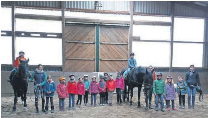
Schnuppertag beim Reiterverein