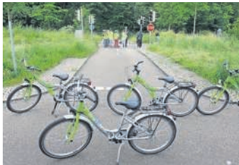
Radfahrunterricht auf der Jugendverkehrsschule

2016 war das unfallreichste Jahr seit der deutschen Wiedervereinigung mit rund 2,6 Mio. polizeilich aufgenommenen Unfällen. 3.214 Menschen starben im deutschen Straßenverkehr: darunter deutlich mehr Menschen auf Fahrrädern oder Mofas, während weniger Motorradfahrer und Autofahrer tödlich verunglückten. Soweit die Angaben des Statistischen Bundesamtes. Die Verkehrswacht Bruchsal-Bretten hat es sich zur Aufgabe gemacht, junge