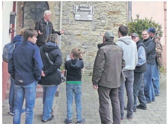
Bulldogfreunde in Heildesheim