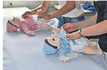
Babysitterkurs Juni 2017

Du bist mindestens 14 Jahre alt? Du möchtest dein Taschengeld aufbessern? Du hast Spaß am Spielen mit Kindern? Bist dir aber noch unsicher im Umgang mit Ihnen? Dann haben wir das Richtige für dich -> Unser Babysitter Kurs in Bruchsal!