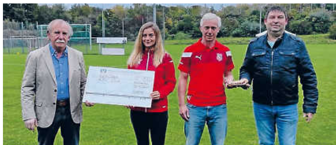
FSV und KZV