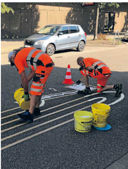
Die Tempo 30-Zone in der Prinz-Wilhelm-Straße wurde im Juni eingerichtet

„Wenn wir den Straßenverkehr schon nicht reduzieren können, dann müssen wir ihn so sicher und geräuscharm wie möglich gestalten, um die Lebensqualität der Anwohnerinnen und Anwohner zu erhöhen“, sagt die Oberbürgermeisterin. „Durch die Temporeduzierung ergibt sich eine wesentliche Lärminderung.“