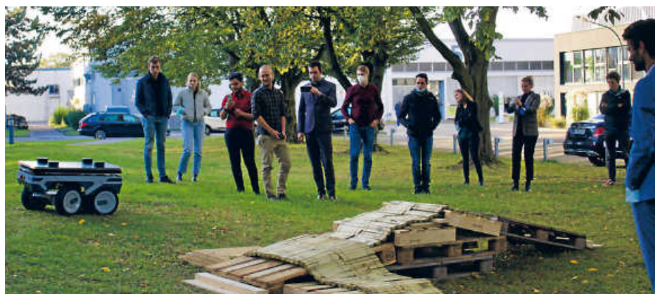
Der Lieferroboter wird im Reallabor präsentiert