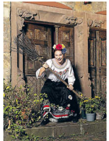
Die kleine Hexe

Die kleine Hexe ist erst 127 Jahre alt: viel zu jung, sagen die großen Hexen, um am jährlichen Hexentanz in der Walpurgisnacht teilnehmen zu dürfen! Aber nichts wünscht sich die kleine Hexe sehnlicher. Heimlich fliegt sie auf den Blocksberg, doch sie wird schnell entdeckt und nach Hause geschickt. Ein wenig Hoffnung schimmert aber doch am Horizont: Die Oberhexe verspricht ihr, dass sie im nächsten Jahr dabei sein darf, wenn sie bis dahin bewiesen hat, dass sie eine gute Hexe ist. Nun muss sich die kleine Hexe mächtig ins Zeug legen! Nicht nur sechs, sondern sieben Stunden lernt sie jeden Tag und arbeitet das ganze Hexenbuch durch. Unterstützung bekommt sie von ihrem Freund, dem Raben Abraxas, der sie ermahnt, von jetzt an nur noch Gutes zu hexen, sonst könne sie schließlich keine gute Hexe werden. Und so hilft sie armen Menschen, bestraft Bösewichte, rettet Tiere und findet neue Freunde. Doch die fiese Wetterhexe Rumpumpel verfolgt Abraxas und die kleine Hexe auf Schritt und Tritt. Sie ist überhaupt nicht einverstanden mit all den guten Taten der kleinen Hexe, denn unter großen Hexen gilt: Hexen müssen böse sein! Ob die Heldin am Ende doch noch alle vom Guten überzeugen kann?