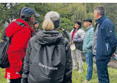
Bürgermeister- wandern gut besucht | 2