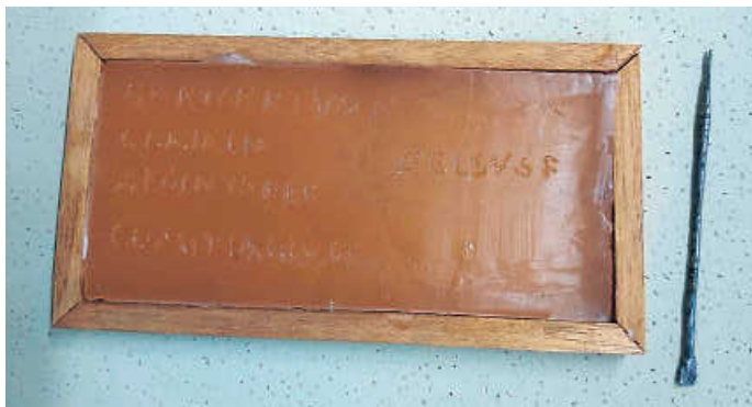
Römischer Stilus mit Wachstafelnachbildung