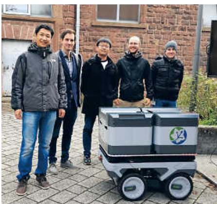
Die Entwickler des Lieferroboters

das Testareal des Forschungsprojekts, die Dragonerkaserne in Bruchsal, in Kleinformat nachbaute. Die SEW-Eurodrive, die big. bechtold-gruppe, die Hochschule Karlsruhe, das FZI Forschungszentrum Informatik, das Karlsruher Institut für Technologie (KIT) und die PTV Group, stellten ihre Projektinhalte an Infoständen aus. Auch die Bewohner/-innen des HubWerk01 stellten sich vor und zeigten an ihren Ständen ihre innovativen Entwicklungen für die Städte von Morgen.