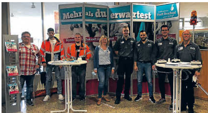
Das Messteam der Stadt Bruchsal

Zum ersten Mal fand die Ausbildungsmesse „GBZ meets Sprungbrett Ausbildung“ im Gewerblichen Bildungszentrum Bruchsal statt, bei der die handwerklichen Berufe im Vordergrund standen. Die Stadt Bruchsal, die ebenfalls mit einem Stand vertreten war, hat in diesem Bereich einiges zu bieten. Das Messteam, bestehend aus Ausbilder/-innen und Auszubildenden, informierte zu den Berufen Elektroniker/-in für Betriebstechnik, Straßenbauer/-in, Landschaftsgärtner/-in und Fachkraft für Abwassertechnik. Die Auszubildenden vor Ort konnten die interessierten Jugendlichen aufgrund eigener Erfahrungen von der Vielfältigkeit der Ausbildungsinhalte bei einer Stadtverwaltung überzeugen. Auch die Schnupperangebote vom Praktikum bis zum Bundesfreiwilligendienst sind für Schulabgänger/-innen eine Chance, den Weg ins Berufsleben zu finden. Wer noch Infos zu den Ausbildungsberufen sucht oder sich bewerben möchte, wird über www.bruchsal.de/ausbildung fündig.