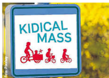
Erste Kidical Mass-Fahrradaktion | 10