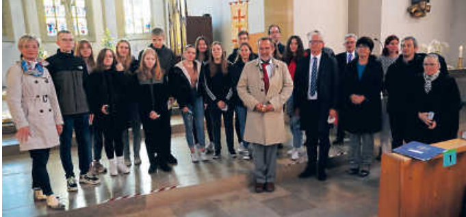
Kooperationspartner und Jugendliche, die sich eingearbeitet haben - für das Foto ohne Maske