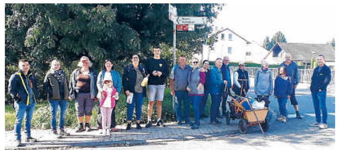
Die SKH auf Wanderung