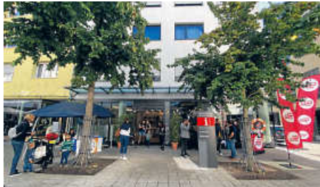
Das Servicecenter H7 freut sich auf seine Besucher/innen!

Am zweiten Verkaufsoffenen Sonntag dieses Jahres, dem 24. Oktober, lädt der Branchenbund (B3) erneut zum Bum-