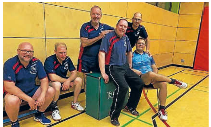
Die überraschten Sieger

Zu Beginn der Spiele zeigte sich gleich, dass es für uns nicht einfach werden würde. Beide Startdoppel Essig/Jork und Melcher/Neuberth mussten sich im Fünften knapp geschlagen geben. Degen/Schuh machten es besser und holten sich einen Fünfsatzsieg, genauso wie Essig im ersten Einzel. Jork verlor sein Spiel klar gegen die Nummer eins von Neuenbürg/Unteröwisheim. Das mittlere Paarkreuz mit Melcher (Sieg) und Degen spielte ausgeglichen, ebenso Schuh (Sieg) und Neuberth. Beim Stand von 4:5 ging es in die zweite Einzelrunde, in der Essig gegen den starken Stuhlmüller genauso wie Jork im ersten Spiel keine Chance hatte. Doch dann wendete sich das Blatt. Melcher, Degen, Neuberth und Jork holten vier Punkte zur 8:6-Führung. Leider konnte sich im Duell der Reservisten Hotz gegen Schuh für seine Niederlage im Spiel der zweiten Mannschaften vor einer Woche revanchieren und es nochmal spannend gestalten. Unser neues Einserdoppel Essig/Jork machte aber kurzen Prozess und den Sack für uns zu.