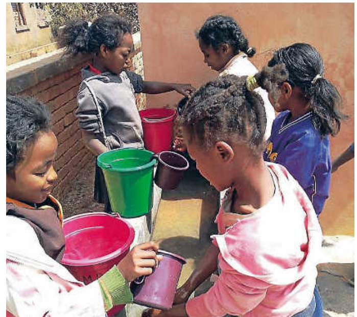
Endlich Wasser an der Schule