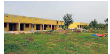
Letzte Anstreicherarbeiten an der Berufsschule (2. September)