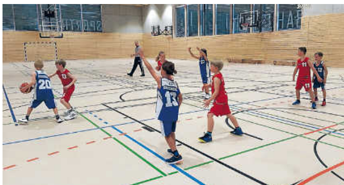
TSG Bruchsal – U10 gemischt