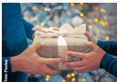
Weihnachtswunsch- aktion startet wieder | 9