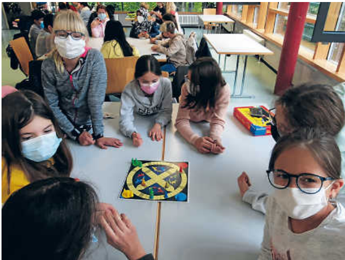
Gemeinsames Spielen in der Mensa

ten auch ihr eigenen Spiele mitbringen. Immer wieder wechselten sie begeistert die Spieltische und schlossen sich anderen Gruppen an, so dass man auch neue Bekanntschaften und Freundschaften schließen konnte. Es war alles so spannend, dass man sogar völlig vergessen konnte, dass alle noch Masken tragen mussten.