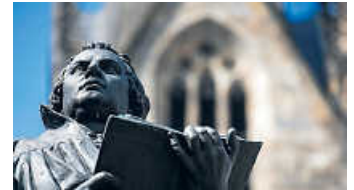
REFORMATION statt Resignation!

www.youtube.com/hashtag/ekibageistlich – geistliche Videos aus Baden