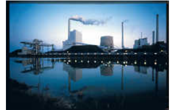
Technik und Licht