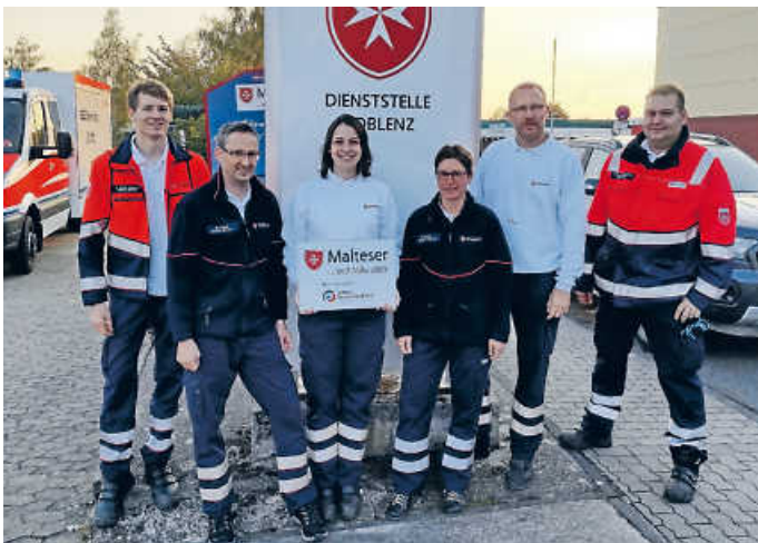
Die Malteser Bruchsal im Ahrtal