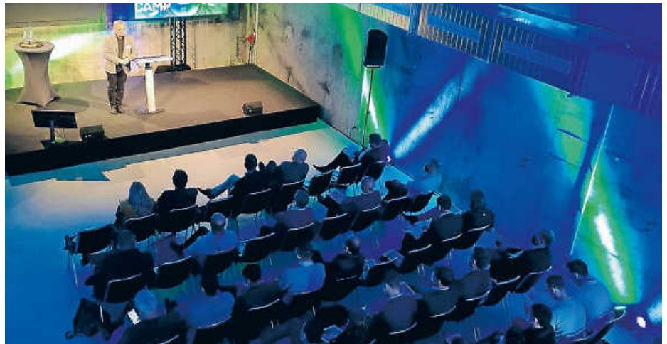
Gespannte Zuhörer/-innen im HubWerk01

„Lassen Sie sich mitreißen von den Zukunftsvisionen, die hier in Bruchsal nicht nur gedacht, sondern umgesetzt werden. Und erleben Sie hautnah, wie die Gütermobilität in der Stadt von morgen ausse-