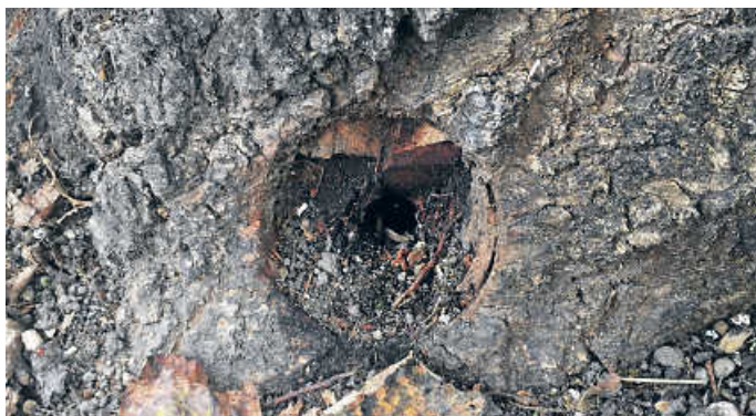
Bohrloch im Stammfuß der Linde