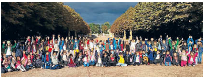
Juhuuu! Viele Runden geschafft!