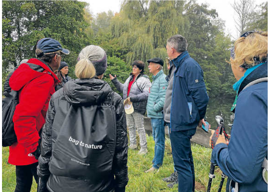
Das schlechte Wetter hielt die Wanderlustigen nicht von der Teilnahme ab