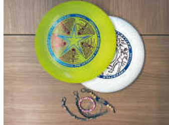
Frisbee und Kreativkurs Foto: pr

In den Herbstferien bietet die Offene Jugendarbeit zwei verschiedene Workshops für Kinder und Jugendliche ab zehn Jahren. Zum einen am Dienstag, 2. November, einen Kreativkurs „Ketten und Schlüsselanhänger“ bei dem Ihr eure persönlichen Schmuckstücke gestalten dürft. Zum anderen am Donnerstag, 4. November, einen Freestyle-Frisbee-Kurs, bei dem die TeilnehmerInnen den richtigen Umgang mit der Frisbee und verschiedene Wurftechniken lernen. Beide Angebote sind kostenlos, lediglich eine schriftliche Anmeldung per Mail ist notwendig. Fragen zu den beiden Workshops bitte per Mail an hdb@bruchsal.de .