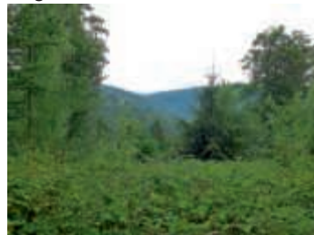
Um Löwenstein herum

Anmeldungen und Informationen bei Silvia Bäuerle: (0173) 4580098. Gäste sind herzlich willkommen.