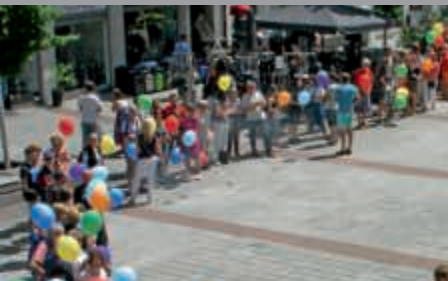
Eine Kette für die Menschlichkeit in Bruchsal

Mitglied der Technologie Region Karlsruhe HighTech trifft Lebensart