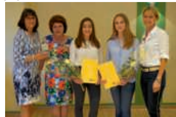
Preisträgerinnen des Young Women in Public Affairs Award

Informationen zum Young Women in Public Affairs Award findet man auf der Homepage www.Zonta-Bruchsal.de