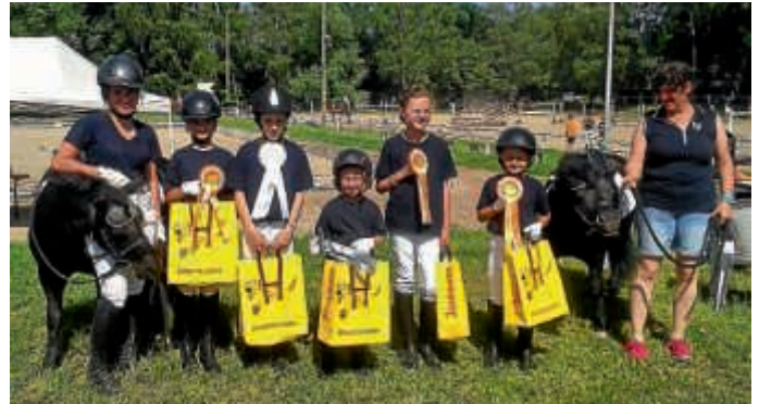
Erfolgreiche Heildesheimer Reiterjugend