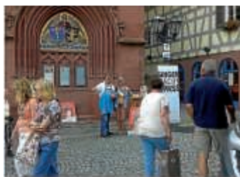
Konzert Werbung am Marktplatz Bretten

Dieses Mal mit einem Infostand auf dem Brettener Marktplatz vor dem Melanchthon Museum bei herrlichen Wetter. Zeitgleich mit einem BNN Artikel über unser Konzert. Ohne Werbung geht nichts, war auch in Bretten die Meinung vieler Besucher vom Infostand. Danke an alle Helfer. Karten für dieses Konzert gibt es bei unserer Ticket Hotline (07251) 358509, im BTMV Bruchsal, bei Reservix und bei der Volksbank Filiale Helmsheim. Auch unter www.gv-helmsheim.de GV