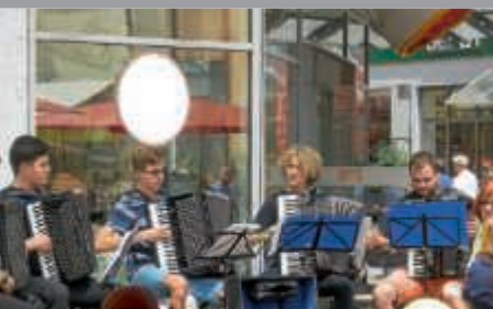
Klangvolle Tage für die Stadt Bruchsal