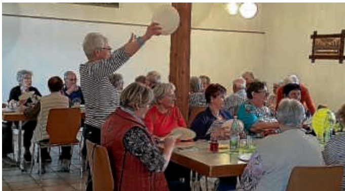
Spiele beim Altenwerk im April 2018