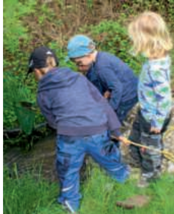
Spaß in der Natur bietet der Projektgarten Heubühl.

Treffen der Agendagruppe Radfahren am Montag, 11. Juni, um 18 Uhr am Bürgerbüro, Otto Oppenheimer Platz. Die Gruppe fährt