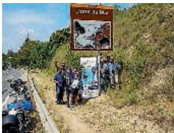
29. Mai, 12:12 Uhr nach 12 Etappen: Die Florettisten haben den Stadtrand von Lloret de Mar erreicht