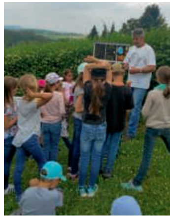
Auf der Sternwarte-Kraichtal

Ein ausführlicherer Bericht steht auf unserer Homepage www.fvbo.de