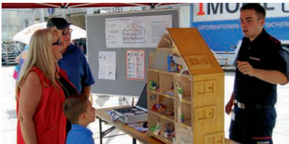
Das sichere Haus - ein Aspekt des Sicherheitstags

Zusätzlich wird es Gelegenheit für Diskussionen und Gespräche an den Informationsständen geben. Treffen Sie die Fachleute, und stellen Sie ihnen Fragen! Im Fokus stehen praktische Beispiele, die sich für jeden Interessenten als nützlich erweisen sollen. (DiMü)