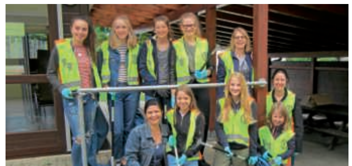
Die Tanzgruppe „Aerobic, Dance and more“ des TSV Untergrombach sammelt Müll.

Bruchsal (pa) | Getreu dem Motto „Mitmachen und Vorbild sein“ traf sich im Rahmen der ehrenamtlichen Müllsammelaktion „Saubere Stadt“ Ende April die Tanzgruppe „Aerobic, Dance and more“ des TSV Untergrombach zum Müllsammeln. In dem Gebiet rund um die Bundschuhhalle füllten die Mädchen mit ihren Betreuerinnen eifrig innerhalb von zweieinhalb Stunden sechs große Müllsäcke. Auch im nächsten Jahr wollen die Mädchen die Aktion erneut durchführen. Sollten auch andere Freiwilligengruppen, Schulklassen oder Kindergärten Interesse an der Aktion haben, gibt es weitere Informationen über die Stadt Bruchsal, die Material zur Verfügung stellt und bei der Organisation und der Müllentsorgung unterstützt. Bei Fragen wenden Sie sich an das Agenda-Büro, E-Mail: Agendabuero@bruchsal.de oder unter Telefon: (07251) 79-373.