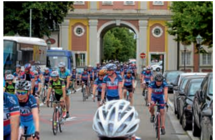
Rund 300 Rennradfahrer kommen auf einer Benefiztour nach Bruchsal

Bruchsal (art) Gleich zwei Radsportereignisse bestreitet das Radsportteam Kraichgau am Sonntag, 17. Juni, in Bruchsal. Am Bruchsaler Schloss empfängt der Verein mit zahlreichen Helfern die Benefizradtour des Radtreffs Rhein-Neckar zur Mittagspause. Hier werden gegen 12.45 Uhr rund 300 Rennradfahrer erwartet, die im geschlossenen Verband in Bruchsal einrollen werden. Diese Tour, die der Radsportverein Rhein-Neckar seit 1998 jährlich organisiert, sammelt Spenden für den Kampf gegen Leukämie. Bereits 2016 war die Tour in Bruchsal zu Gast und genoss die Pause am Schloss.