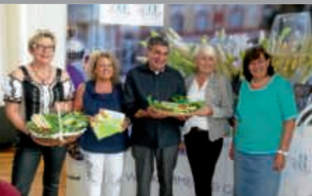
Bruchsaler Spargelerlebnis 9. und 10. Juni am Kübelmarkt