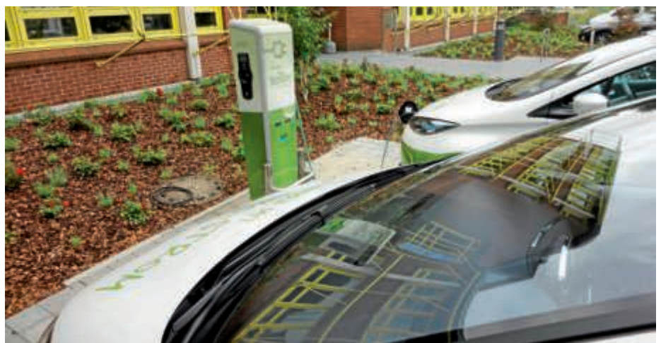
Das Gebäude der Bruchsaler Stadtwerke im Spiegel der Zoë-Frontscheibe.