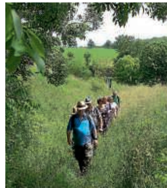
Slow Food Safari im Kraichgau