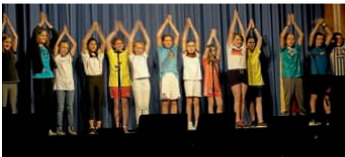
Der Unterstufenchor in voller Aktion

Das Thema „Flächen und Linien“ war in ganz unterschiedlichen Techniken und Materialien realisiert. So sah man Stadt und Wald in grau und bunt, Masken und Porträts, Skulpturen sowie Ferienhaus-Modelle, Spiderman-Figuren kletterten an der Tafel herum und vom Cockpit konnte man Sterne und Planeten erkennen.