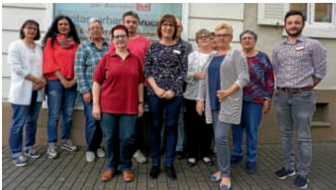
Teilnehmerinnen und Teilnehmer des Hauskrankenpflegekurses