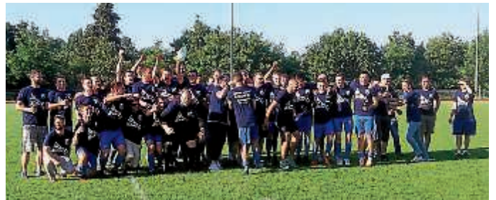
Meister und Aufsteiger 2017/2018

nell Platz zwei in der C-Klasse. Einfach nur sensationell. Wir möchten uns bei allen bedanken, die zu dieser wahnsinnigen Saison beigetragen haben. Damit sind nicht nur die Aktiven auf dem Platz gemeint, sondern auch alle drum herum. Das schließt Trainer, Betreuer, alle Mitglieder der Verwaltung, Wirtschaftsdienst, Platzwart einfach alle, die sich in welcher Form auch immer für unseren FC Obergrombach einsetzen und diesen Verein zu etwas Besonderem machen ein! Ein Dank geht natürlich auch an alle Gönner und Sponsoren. Und natürlich ihr, ein enthusiastisches und begeistertes Publikum, das die Mannschaft zuhause, aber auch auswärts, anfeuert und nach vorne treibt. Ihr habt die Auswärtsspiele zu Heimspielen gemacht, das Finale in Bretten war einfach unglaublich! Solche Fans findet man im Umkreis ganz sicher nicht!