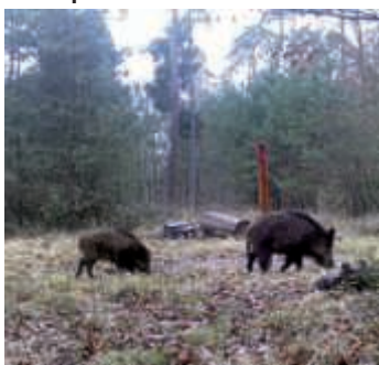
Wildschweine auf Futtersuche

Im Bereich Tiergesundheit sorgt die Afrikanische Schweinepest für Schlagzeilen. Die Afrikanische Schweinepest ist eine anzeigepflichtige Tierseuche, von der Haus- und Wildschweine betroffen sind. Die Virusinfektion verläuft bei Schweinen fast immer tödlich, ist jedoch für den Menschen und andere Haustierarten ungefährlich. Impfstoffe und Therapiemöglichkeiten gibt es keine. Für die Bekämpfung kommen daher nur die Einhaltung von Biosicherheitsmaßen und die Regulierung der Wildschweinpopulation in Betracht. „Im vergangenen