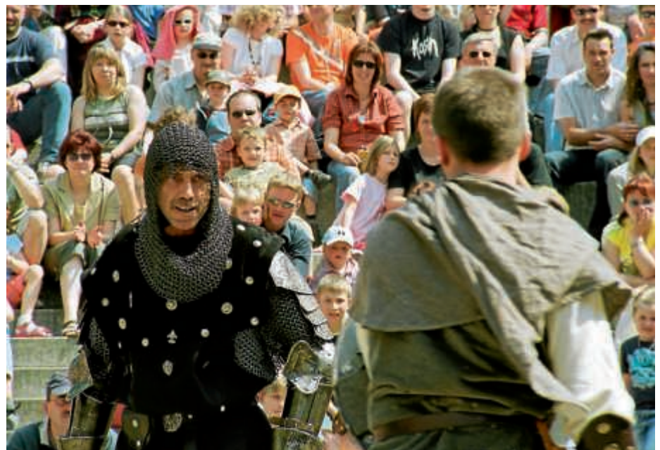
Ritterkämpfe beim Bergfried Spectaculum

allen drei Tagen auch der Bergfried selbst, das älteste Bauwerk der Stadt aus dem 14. Jahrhundert. Besteigungen sind jederzeit möglich, die oberste Plattform erlaubt einen weiten Blick herab auf Bruchsal und die abwechslungsreiche Landschaft.