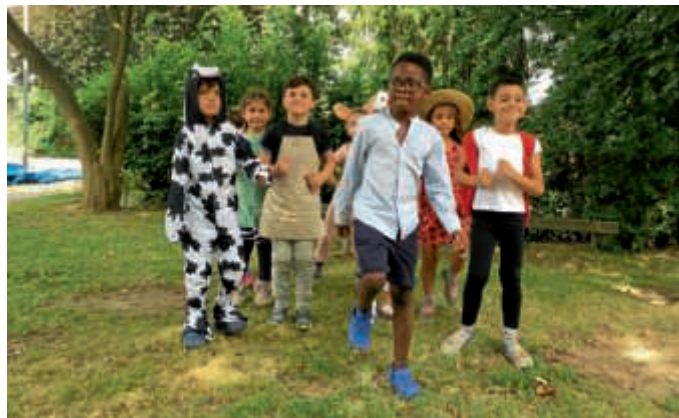
Die Kinder spielten mit Begeisterung das Märchen „Hans im Glück“