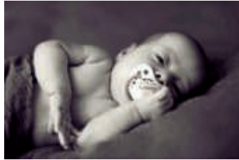
Caritas-Tagesstätte bietet Kurs für schwangere Frauen mit postpartaler Depression an