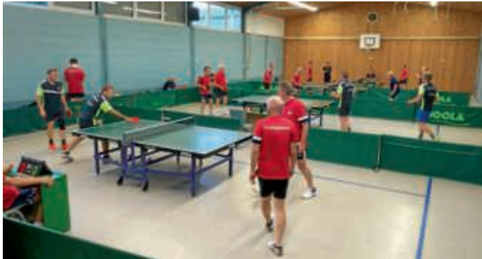
Regler Spielbetrieb beim TVH vor dem Saisonstart