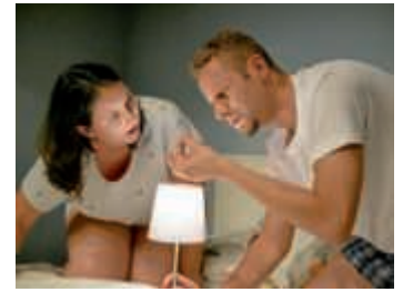
Eine Wanze verändert plötzlich alles

Karten für 12 Euro beziehungsweise 8 Euro ermäßigt. Ermäßigungen werden an der Abendkasse nach Vorlage eines entsprechenden Nachweises gewährt.