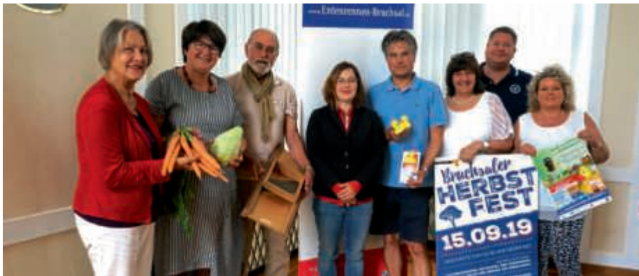
Die Verantwortlichen des Herbstfestes.

Das große Plus: Der Max-Bus bringt Groß und Klein wieder kostenlos in die Innenstadt und zu den Geschäften in den Gewerbegebieten Stegwiesen und Am Mantel als Beitrag der städtischen Verkehrsbetriebe zum Herbstfest. (hüb/mcs)