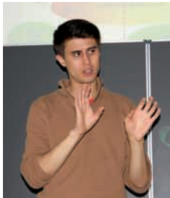
Ein Politikdoktorand am HBG

Im Rahmen der Projektstage im Juli besuchten Schülerinnen und Schüler der UNESCO-AG der Heisenberg-Gymnasien Bruchsal und Ettlingen gemeinsam mit Frau Honert das alljährlich stattfindende UNESCO-Sommercamp. In Baden-Württemberg gibt es 33 UNESCO-Projektschulen und 18 davon waren mit einer Auswahl an Teilnehmerinnen und Teilnehmern dabei. Die Unterbringung in der Jugendherberge auf dem Gelände der Bundesgartenschau (BUGA) war genial. Drei Tage lang hatte man Zeit, sich kennenzulernen und an zahlreichen Workshops zu den Themen Mensch und Umwelt, Klimawandel und Biodiversität oder Nachhaltigkeit/Konsum/Wirtschaftssystem auf dem BUGA-Gelände teilzunehmen. Natürlich blieb auch noch Zeit die nahegelegene Experimenta samt Science Dome zu besuchen. Die BUGA mit ihrem Blumenmeer und den zahlreichen Musikdarbietungen und Wasserspielen konnte man dann am Abend entspannt genießen. Hon