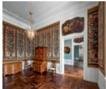
Kostbare Möbelstücke im Garderobenzimmer

Eine Restauratorin und ein Kunsthistoriker der Staatlichen Schlösser und Gärten Baden-Württemberg übernehmen am Sonntag, 15. September, um 15 Uhr die Führung in der Beletage und öffnen, ausgerüstet