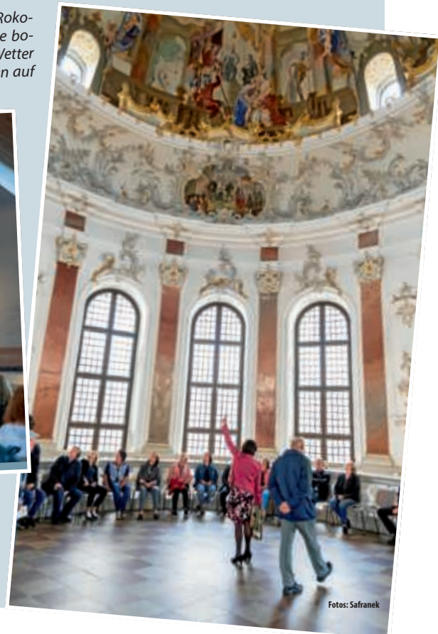
▶ Einen Umbruch in Architektur und Malerei markierte im 18. Jahrhundert das Barock, der prägende Stil des fürstbischöflichen Schlosses.