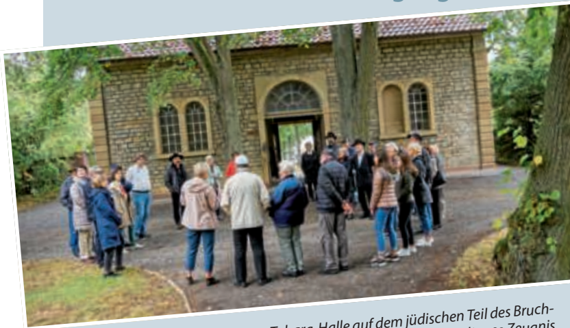
▲ Die Tahara-Halle auf dem jüdischen Teil des Bruchsaler Friedhofes ist ein original erhaltenes Zeugnis jüdischen Lebens im 19. Jahrhundert.