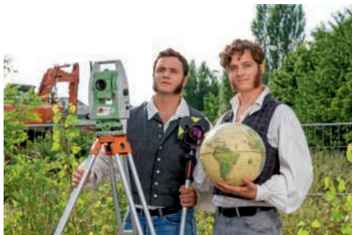
Die Vermessung der Welt

Karten bei der BLB, Telefon (07251) 727 23, E-Mail: ticket@dieblb.de , oder unter www.reservix.de .