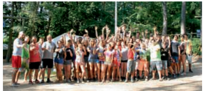
Zeltlager in Mellnau bei Wetter