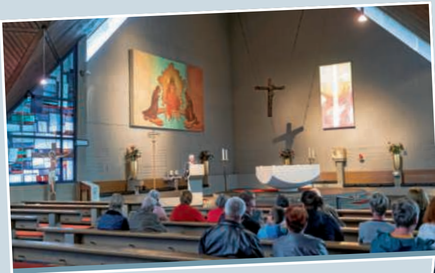
▲ Als eine der bedeutendsten zeltförmigen Kirchen in Baden-Württemberg gilt St. Josef in der Philippsburger Straße.