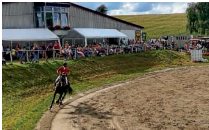
Das Highlight am Sonntag – das große S Springen