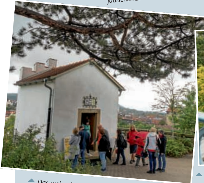
▲ Das wahrscheinlich kleinste Museum in Baden-Württemberg, das Graf-Kuno-Museum oberhalb der Andreasstafel, fand regen Anklang.