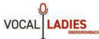
Das neue Logo des Frauenchores

Mit dieser Begeisterung und neuem Schwung starten wir nun in die Vorbereitungen für unser anstehendes Highlight im Oktober. Das Wanderkonzert am Sonntag, 27. Oktober, im Schloss Bruchsal, wird für die nächsten Wochen eine große Herausforderung für uns sein. In den nächsten Tagen werden Plakate und Flyer auf dieses großartige Event hinweisen. Daher sollten sich alle Liebhaber des Chorgesangs diesen Termin jetzt schon vormerken! (P.L.)