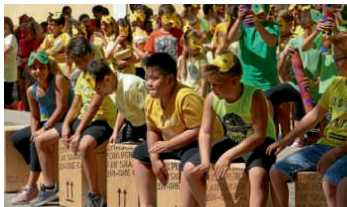
Cajongruppe und „bunte Vögel“