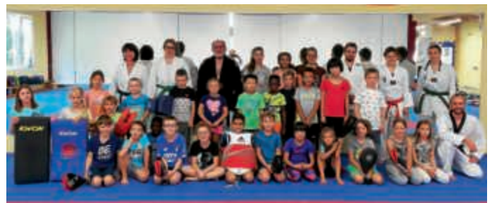
Teilnehmende und Trainer beim Sommerferienprogramm 1. BBC

Auch dieses Jahr standen unsere Trainer und Trainerinnen an zwei Vormittagen für das Sommerferienprogramm zur Verfügung, um über fünfzig jungen Teilnehmenden Auszüge unserer Sportarten näher zu bringen. Die Kinder und Jugendlichen hatten die Möglichkeit Einblicke ins Judo, Karate und Taekwondo zu bekommen und waren mit viel Begeisterung dabei. In altersgerechten Gruppen eingeteilt wurden Partner- und Fallübungen, Selbstverteidigung, Grundschole, Faust- und Fußstöße auf die Pratze geübt. Zwei aufregende Vormittage, an denen auch Spaß und Spiel nicht zu kurz kamen, vergingen wie im Flug.