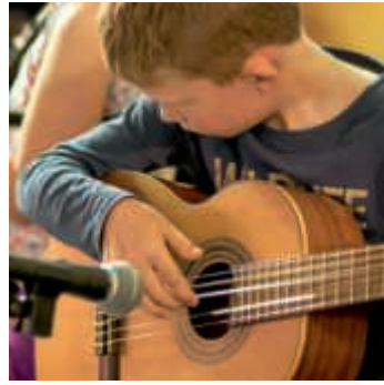
Probemonat in der MuKS

MuKS-Service-Telefon (07251) 913 40 oder mail@muks-bruchsal.de.