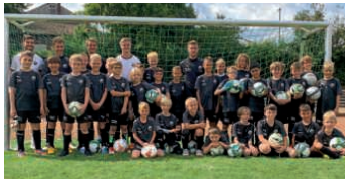
Die begeisterten Kinder beim Fußballcamp des SV Sandhausen im Heidelheimer Kraichgaustadion

Vom 4. bis 6. September hatten wir wieder die Gelegenheit, die Fußballschule des SV Sandhausen hier im Heidelheimer Kraichgaustadion begrüßen zu dürfen. Bei schönstem Fußballwetter nahmen 31 Fußballerinnen und Fußballer, im Alter von sieben bis 13 Jahren, an diesem Camp teil. Das Motto für die drei Tage lautete „Jeder hat einmal klein angefangen“.