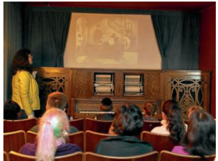
Kinoleinwand mit Photoplayer, Wurlitzer, New York um 1925