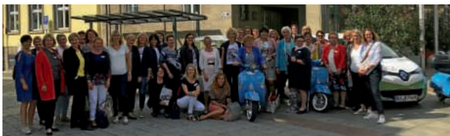
Treffen der Oberbürgermeisterinnen und Bürgermeisterinnen

Im Mittelpunkt der Diskussionsrunde im Bruchsaler Rathaus standen aktuelle Themen wie die Digitalisierung in der Verwaltung, die Global Goals, die Gleichstellung und die Agenda 2030, deren Neuausrichtung derzeit bei der Stadt Bruchsal stattfindet. Eigene Erfahrungen konnten die Rathauschefinnen anschließend mit dem hiesigen E-Carsharing-System machen und dem E-Roller Moritz. Eine Betriebsführung bei der SEW gehörte ebenso zu den Vorort-Terminen wie ein Besuch in der Bahnstadt, als Leuchtturmprojekt für die Stadtentwicklung Bruchsal. Der fachliche Gedankenaustausch endete in Hubwerk 01, dem Digitalisierungszentrum der Wirtschaftsregion Bruchsal. Mit dem Hubwerk 01 wird das von der Landesregierung mit einer Million Euro geförderte Projekt Digital Hub realisiert.