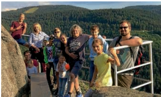
Vereinsfreizeit in Unterstmatt