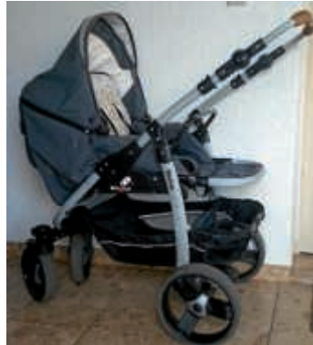
Gute Kinderwagen für bedürftige Familien dringend benötigt!

Große Sachspendensammlung für bedürftige Menschen Samstag, 21. September von 8 bis 12 Uhr in Oberhausen, Weiherweg 22