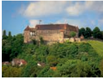
Blick auf Burg Stettenfels

Wir wandern von der Weinbaugemeinde Flein an den Weinberghängen vorbei nach Donnbronn. Hier hat man einen großartigen Ausblick über das Heilbronner Land. Weiter geht es von Donnbronn nach Untergruppenbach, 1000 Jahre, breit, mächtig und weithin sichtbar thront die Burg Stettenfels über Untergruppenbach. Keiner kann sie übersehen, der auf der Autobahn von Stuttgart aus nach Norden fährt oder sich von Heilbronn aus ostwärts in Richtung Löwensteiner Berge begibt. Bei diesem Ausblick geht es weiter nach Abstatt. Oberhalb von Abstatt hat man einen großartigen Umblick auf die Löwensteiner Berge mit ihren Burgen. Die Wanderung endet beim Kanadischen Blockhaus Seeger. Kleine Rucksackverpflegung mitnehmen.