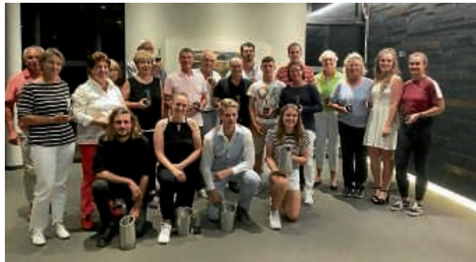
Siegesfeier der Clubmeisterschaften 2019