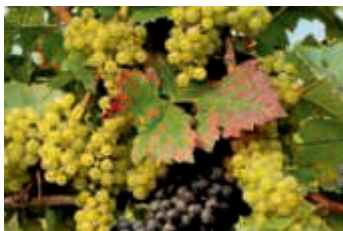
Auf den Spuren des „dorschtigen“ Grafen Kuno

„Ja der Dorscht, ja der Dorscht, ja der alte Brusler Dorscht“... unter diesem Motto findet am Sonntag, 15. September, eine Stadtführung auf den Spuren des Grafen Kuno und dem legendären Brusler Dorscht statt. Es ist eine Zeitreise vom Mittelalter über die Barockzeit, durch die Wirren der badischen Revolution bis hin zur Entstehung der Brauereien im 19. Jahrhundert sowie die Stadt der Gasthäuser in der Mitte des 20. Jahrhunderts. Der Spaziergang durch die Innenstadt wird untermalt durch amüsante Geschichten und Wissenswerten zu den „Brusler“ Gasthäusern, Herbergen, Kneipen, Cafés und Brauereilokalen von einst und teilweise auch noch von heute.