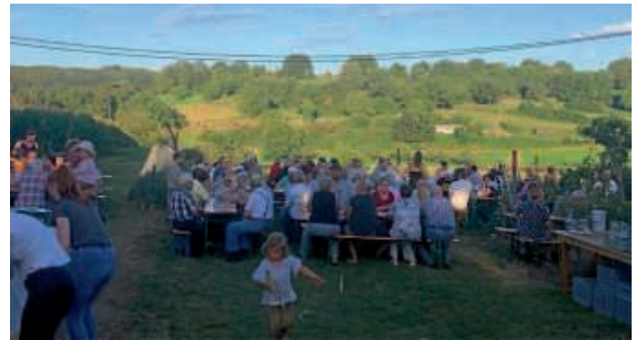
Lichterfest in der Obstanlage

Wir hoffen, Euch in zwei Jahren bei gutem Wetter wieder bewirten zu dürfen.