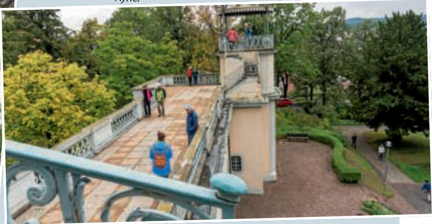
▲ Von der Dachterrasse des Roko-Schießhauses Belvedere boten sich auch bei trübem Wetter eindrucksvolle Impressionen auf Stadt und Stadtgarten.