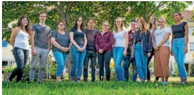
Viel Spaß und viel Wissenswertes gab es beim Einführungstag für die Azubis der Lebenshilfe

„Ein super Tag mit einem vielversprechenden Jahrgang“