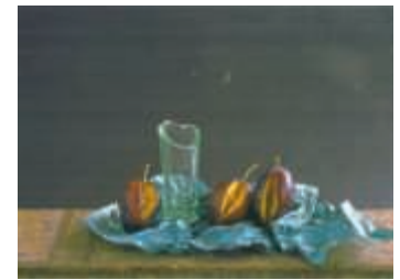
Stilleben no. 11

Die Ausstellung ist vom 15. September bis zum 13. Oktober, samstags von 14 bis 17 Uhr und sonntags von 11 bis 17 Uhr, im Bruchsaler Kunstverein „Das Damianstor“ e.V. zu sehen. Vernissage ist am Sonntag, 15. September, um 11.30 Uhr im Kunstverein Damianstor.