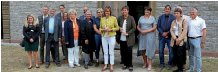
Besichtigung der Taharahalle

forschung und Pflege sei. Die Bruchsaler Tahara-Halle ist nicht nur eine der wenigen noch vorhandenen Leichenwaschhallen in Baden-Württemberg. Sie zeichnet sich darüber hinaus durch eine aufwändige Gestaltung im Stil des Spätklassizismus aus. Der Umstand, dass sich der jüdische Teil des Friedhofes in unmittelbarer Nähe des christlichen Friedhofes befindet, weist auf das gute Zusammenleben zwischen Juden und der übrigen Bevölkerung in dieser Zeit in Bruchsal hin. Der jüdische Friedhof in Bruchsal wurde auch nicht geschändet. Die Tahara-Halle und das Grundstück des jüdischen Friedhofes gehört der Israelitischen Gemeinde Baden. Die Unterhaltung des Gebäudes obliegt aufgrund entsprechender Vereinbarungen der Stadt Bruchsal.