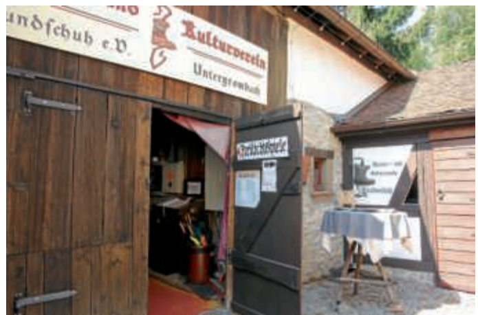
Treten Sie ein in unsere Theaterwelt.

Herzlich willkommen auf unserem Vereinsgelände! Schnuppern Sie am kommenden Sonntag „Theaterluft“ bei freiem Eintritt. Kinder, Eltern, Großeltern, Theater- und Kulturliebhaber*innen sind eingeladen, den Theater- und Kulturverein Bundschuh auf vielfältige Art und Weise kennen zu lernen und zu erleben. Kinderschminken, Kinderworkshop „Theater erleben“ und Feuerspucker versprechen einen tollen Tag für Groß und Klein. Auch das musikalische Unterhaltungsprogramm kann sich sehen lassen: Um 12.30 Uhr spielen die Dorfhopper aus Obergrombach und um 15.30 Uhr singt die Gruppe Ton-Art des GV Bruderbund Untergrombach unter der Leitung von Christel Lauber. Für das leibliche Wohl ist unter anderem mit einem traditionellem Linsengericht, einer selbst gebackenen Kuchenauswahl im Theatercafé, Crêpes sowie kalten und warmen Getränken bestens gesorgt. Lassen Sie sich überraschen und feiern Sie mit uns – wir freuen uns auf Sie.