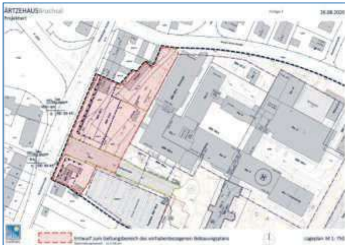
Abb.: Räumlicher Geltungsbereich (ohne Maßstab) Bruchsal, den 30.09.2020

Die genaue Abgrenzung des räumlichen Geltungsbereiches ist der Plan-darstellung zu entnehmen.