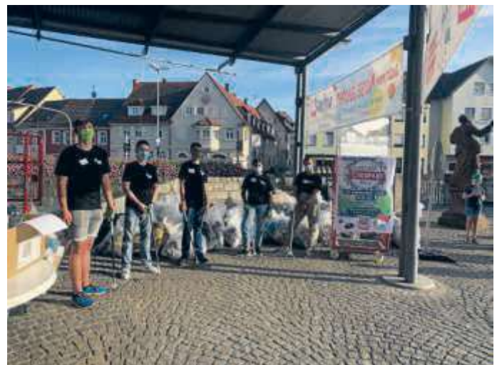
Zum World Cleanup Day organisierte der Bruchsaler Jugendgemeinderat erneut eine Müllsammelaktion.

Der Jugendgemeinderat Bruchsal hat eine Müllsammelaktion veranstaltet und hat somit jedem die Möglichkeit gegeben seinen eigenen Teil zu dem „World Cleanup Day“, eine internationale Aufräumaktion, beizutragen.