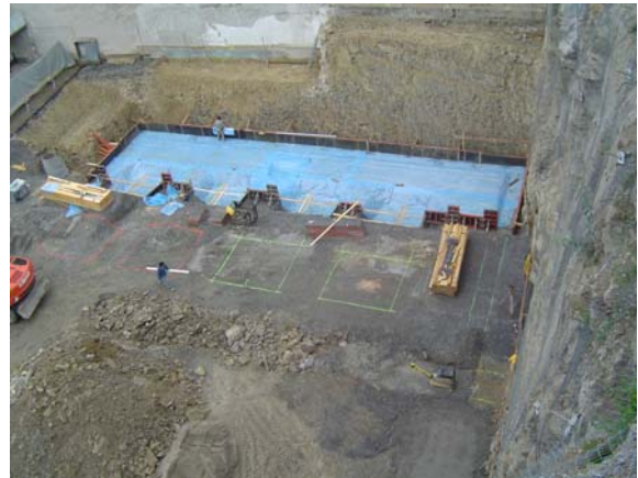
Fundamentarbeiten für Haus A am 30.05.2005