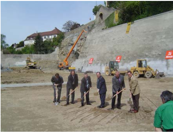
Spatenstich am 28.04.2005