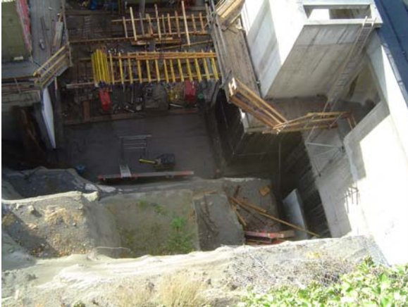
03.11.2005 Beginn der Fundamentarbeiten 23.12.2005 Betonarbeiten und Verlegen der Trittstufen