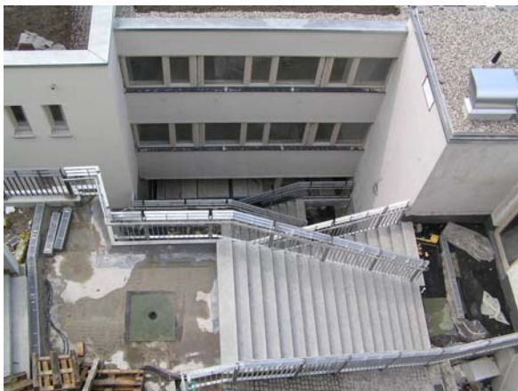
14.07.2006 Erstellen der Handläufe