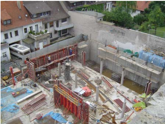
07.07.2005 Betonarbeiten im Garagengeschoss des Hauses A