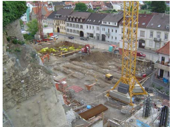
07.07.2005 Beginn der Fundamentarbeiten an den Häusern B und C