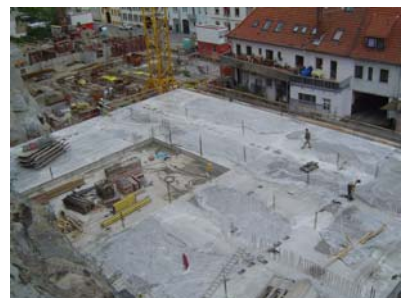
10.08.2005 Beton- und Fundamentarbeiten