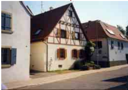
Merianstraße 55, 61, 67